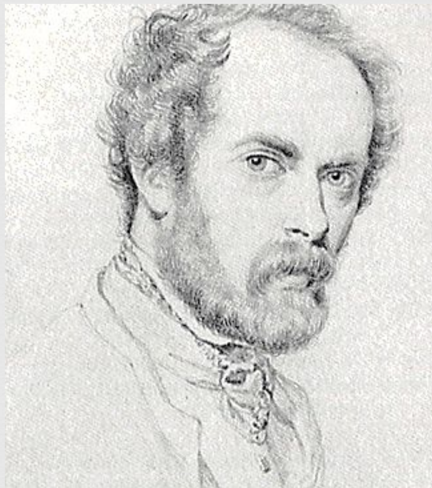
Гранвиль, Изидор Жерар