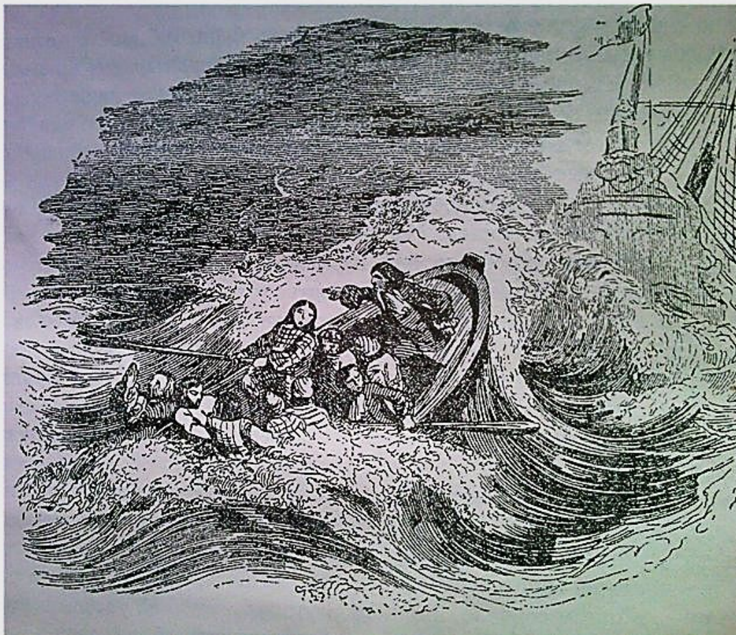
Гранвиль. Иллюстрация к роману Дефо «Робинзон Крузо»