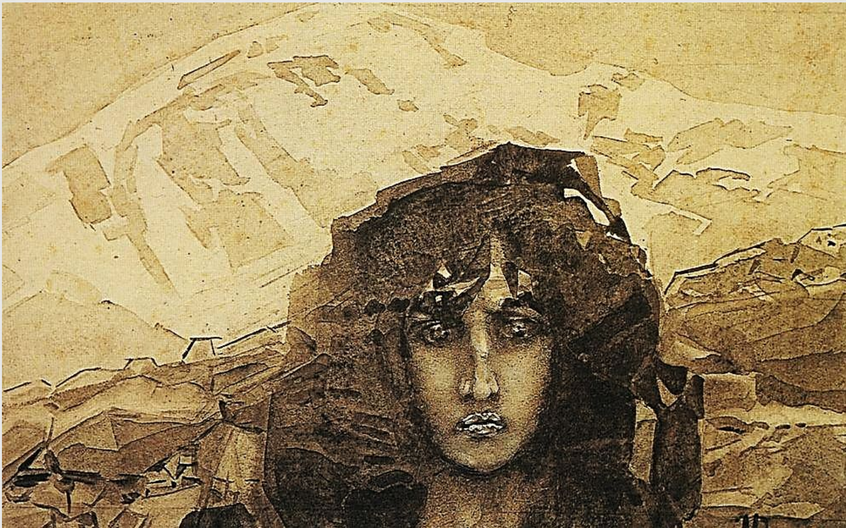
М. Врубель. Образ Демона