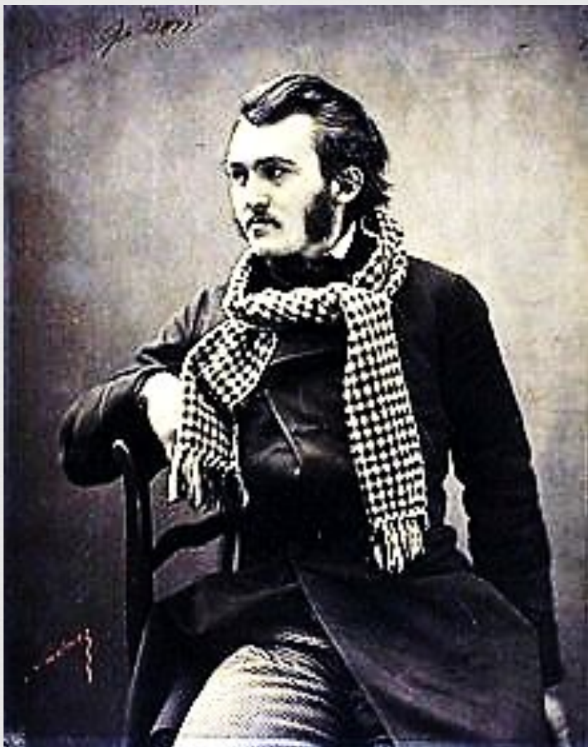
Гюстав Доре (1832-1883)