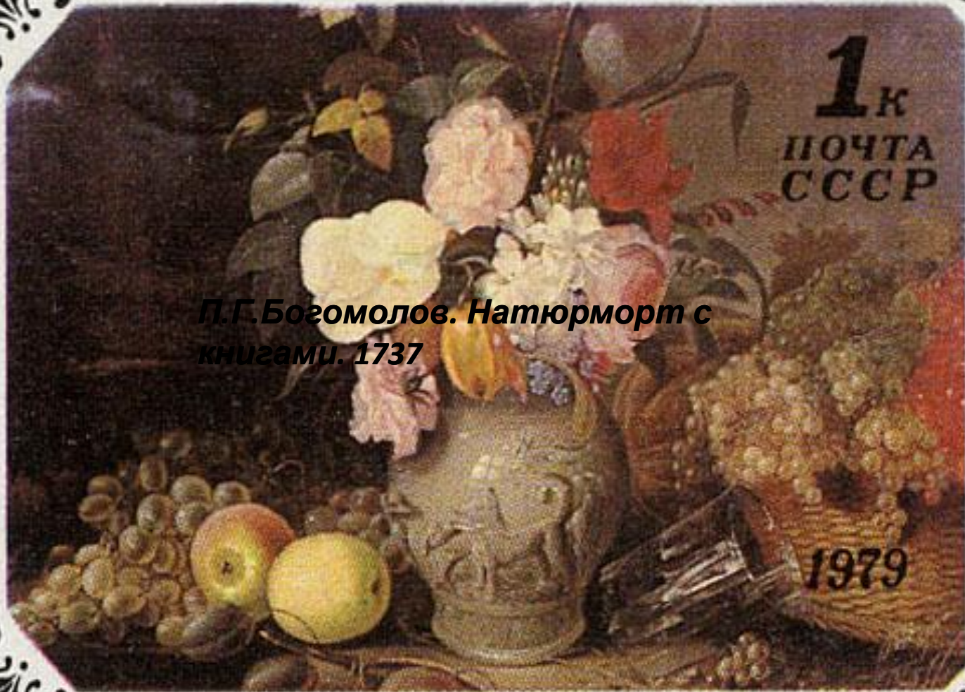
П.Г.Богомолов. Натюрморт с книгами. 1737