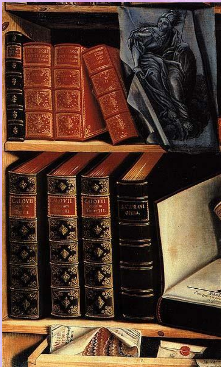
П.Г.Богомолов. Натюрморт с книгами. 1737