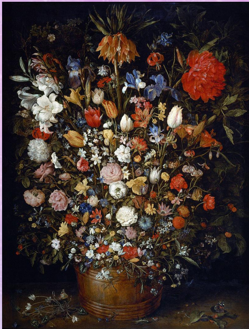
Ян Брейгель Старший. «Цветы в деревянном вазоне».