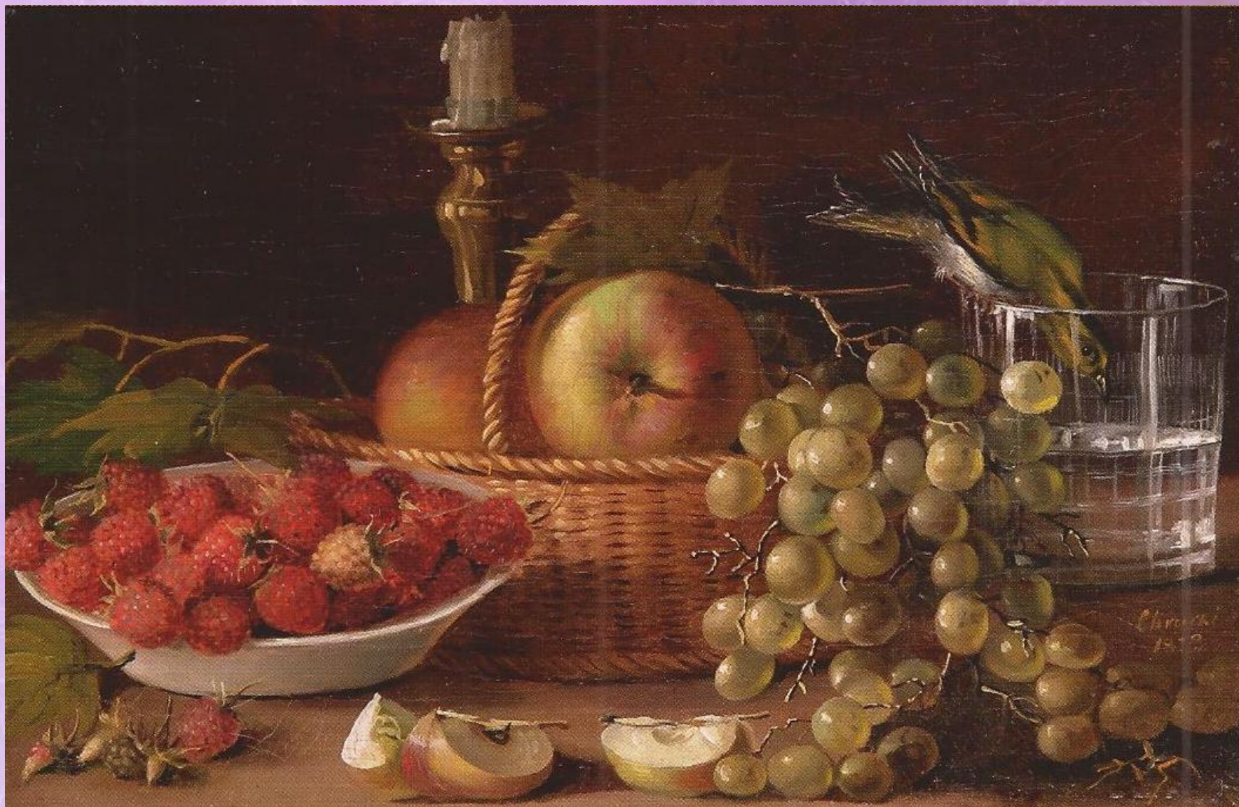
«Плоды и птичка» (1833)