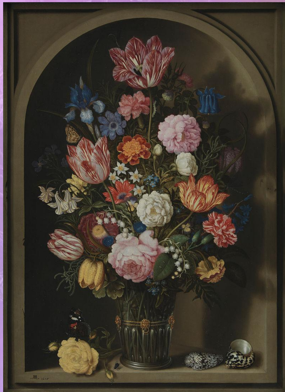
Амброзиус Боссхарт Старший. «Букет цветов в нише».