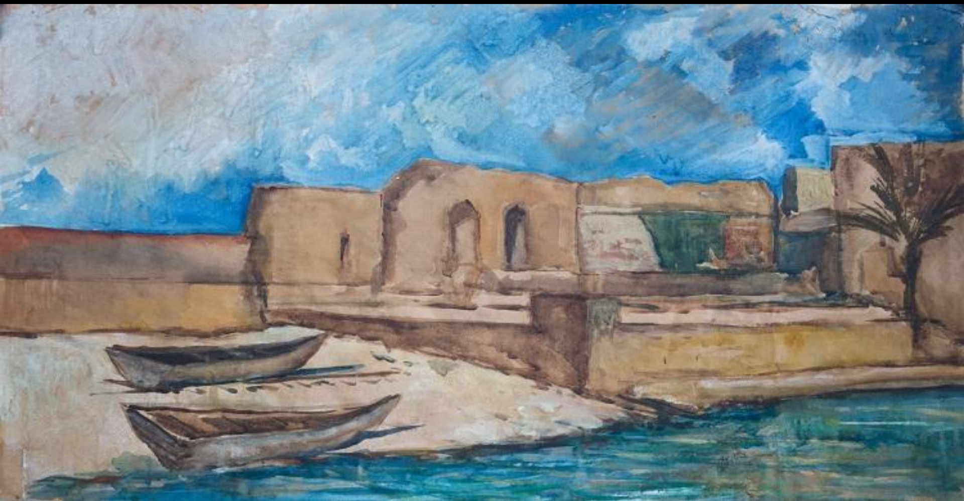
Старый причал. Греция.