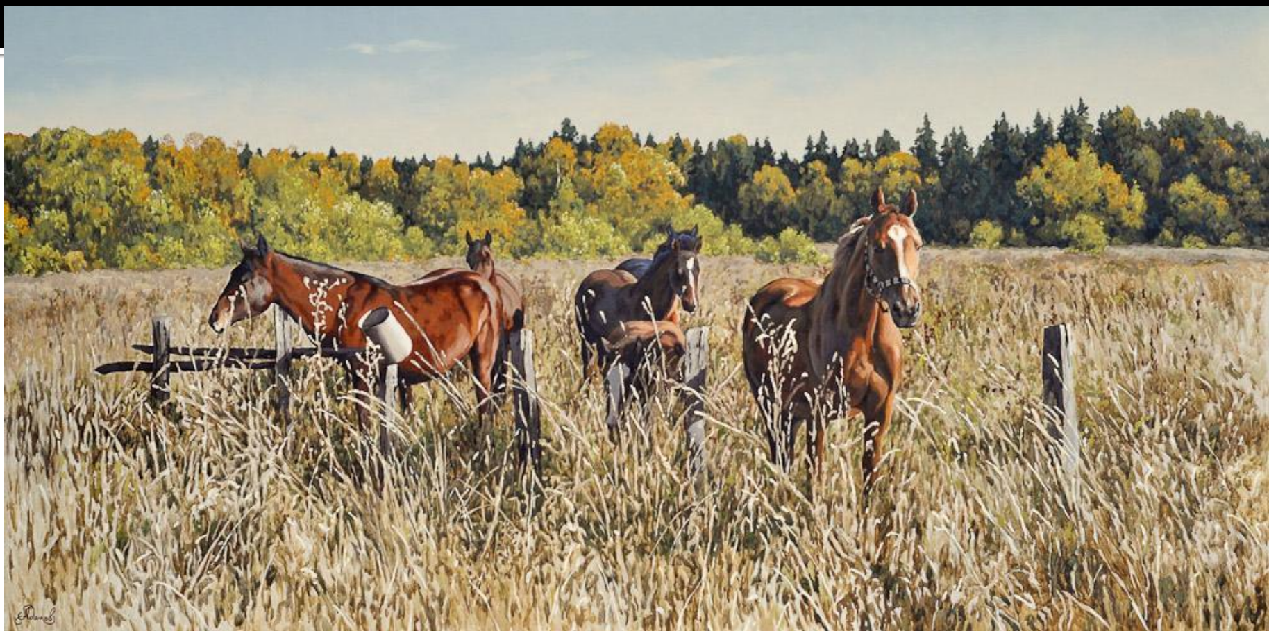
Лошади в поле