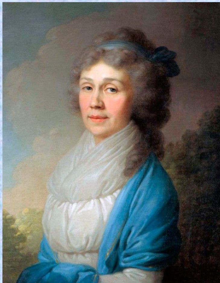
Портрет неизвестной в голубой шали. 1795

Боровиковский имел учеников, которые по распространенному обычаю того времени жили в его доме и как бы становились членами семьи. Среди них был А. Г. Венецианов, на всю жизнь сохранивший теплую память об учителе. В последние годы жизни Боровиковский оказался во власти религиозно-мистических настроений. Мастерство его пошло на убыль.