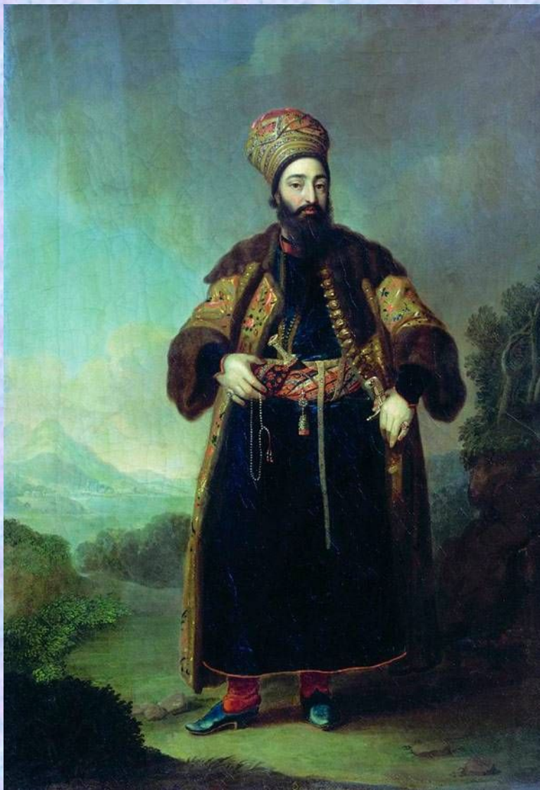
Портрет Муртазы- Кули-хана. 1796