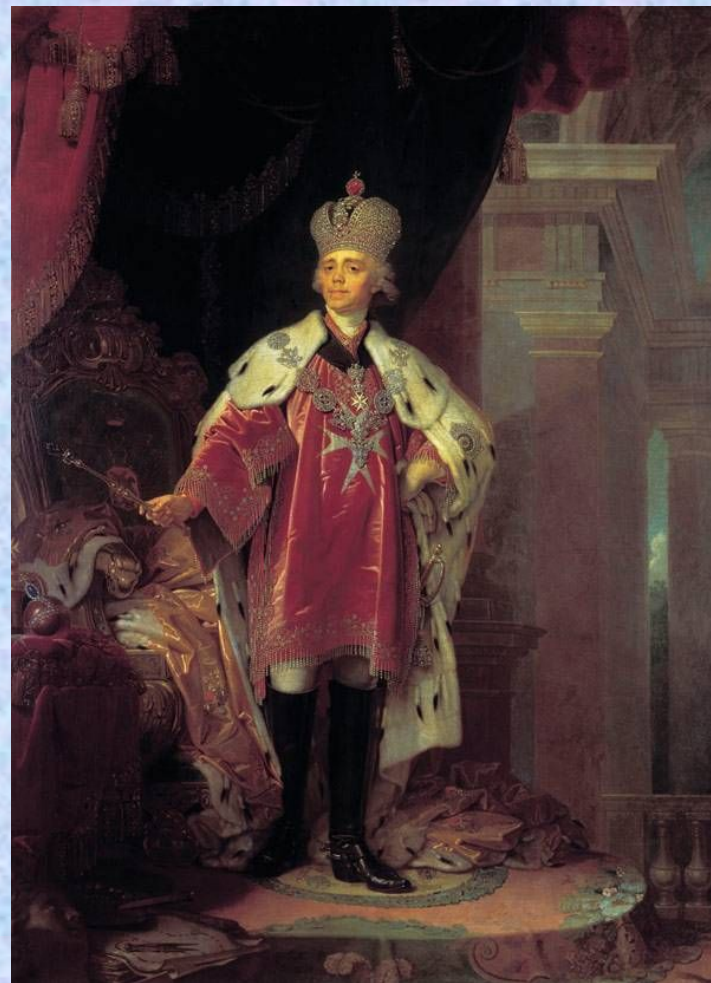
Портрет Павла I в costume гроссмейстера Мальтийского ордена. 1800. Холст, масло. 266x202 см. Государственный Русский музей, Санкт-Петербург

Австрийский портретист Лампи, у которого Боровиковский некоторое время брал уроки, при отъезде из Петербурга оставил ему свою мастерскую. Академия художеств оценила успехи художника и в 1795 году удостоила его званием академика. Боровиковский обращался к различным формам портрета — интимным, парадным, миниатюрным.