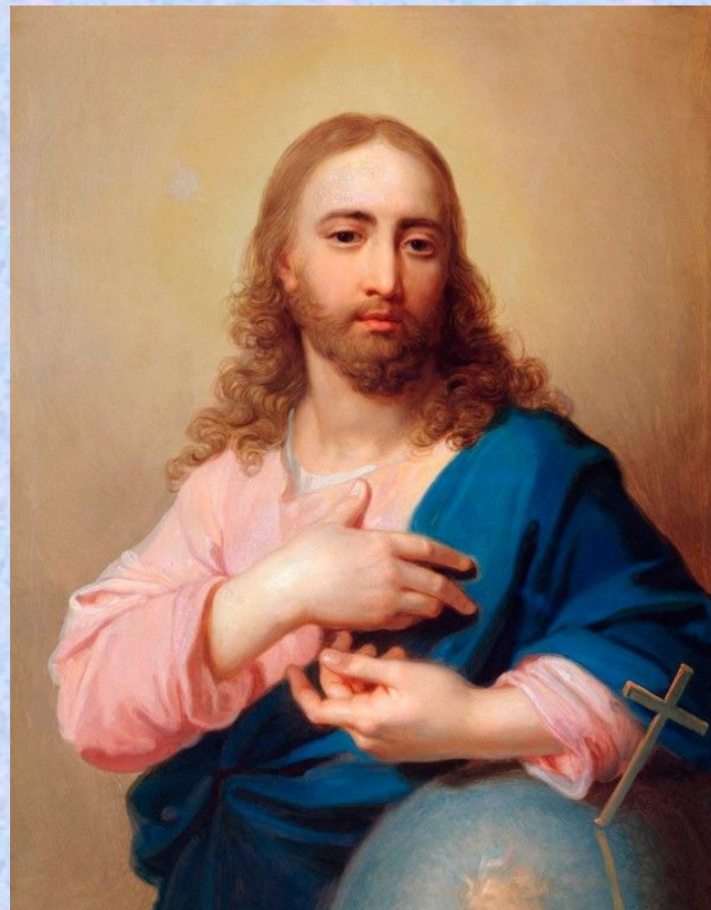
Христос со сферой