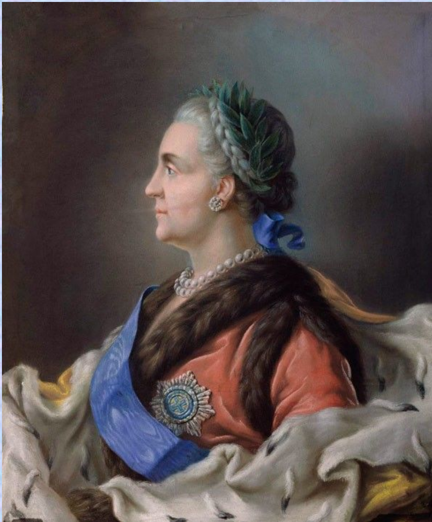
Портрет Екатерины II