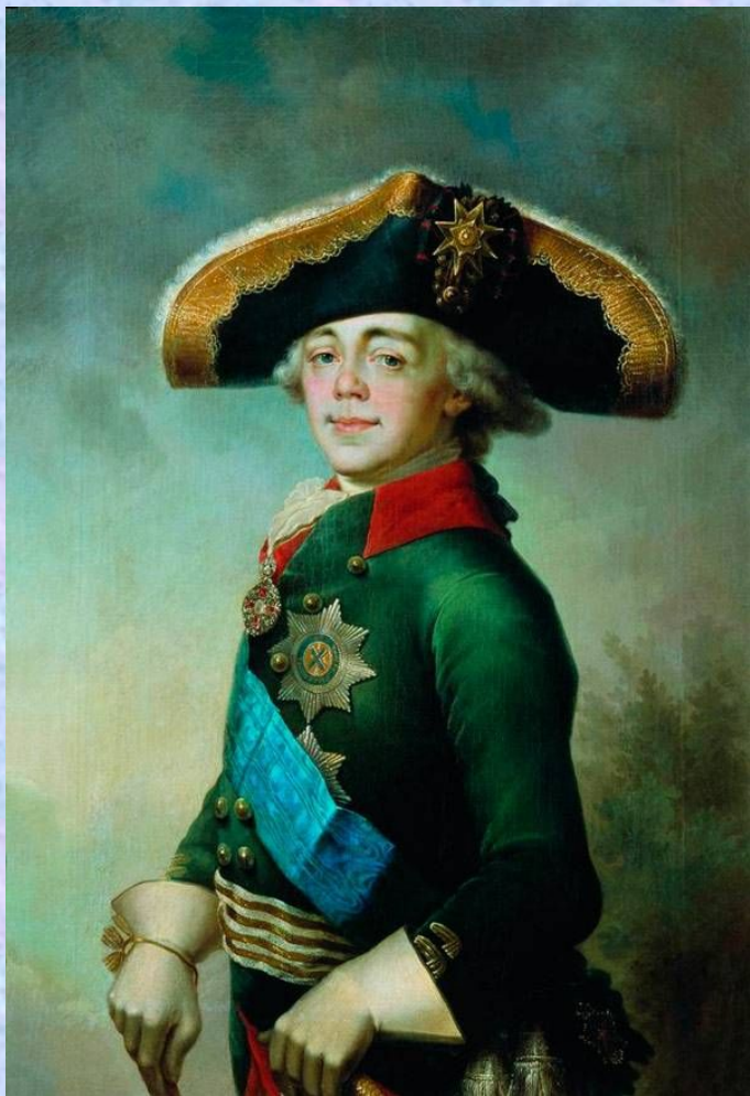
Портрет Павла I, российского императора. 1796