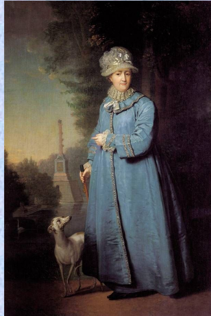
Екатерина II на прогулке в Царскосельском парке. 1794. Холст, масло. 94,5x66 см. Государственная Третьяковская галерея, Москва

Решающую роль в его дальнейшей судьбе сыграло получение заказа на оформление дворца в Кременчуге, в котором предполагала остановиться Екатерина II во время путешествия по югу России в 1787 году. Боровиковский исполнил для дворца две аллегорические картины и был приглашен в Петербург. В столице, с которой связано все его последующее творчество, он несколько лет жил у известного архитектора, поэта и музыканта Н. А. Львова, окружение которого повлияло на духовное развитие художника