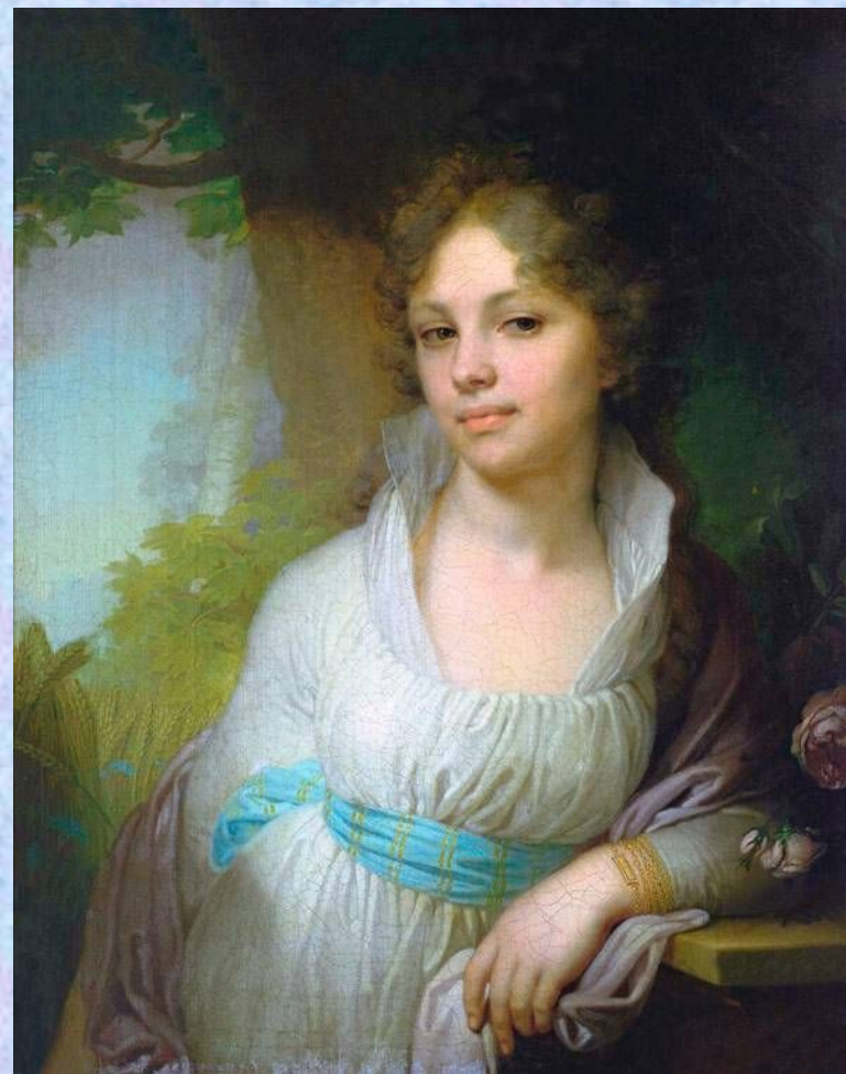
Портрет Марии Ивановны Лопухиной. 1797. Холст, масло. 72x53,5 см. Государственная Третьяковская галерея, Москва

Боровиковский познакомился и с известным портретистом Д. Г. Левицким и, возможно, пользовался его советами. Один из самых ранних портретов, выполненных в Петербурге, — "Портрет О. К. Филипповой" (1790, ГРМ), отличающийся, несмотря на некоторую неуверенность кисти, нежной мечтательностью образа. Мастерство Боровиковского быстро крепло, он приобрел известность.