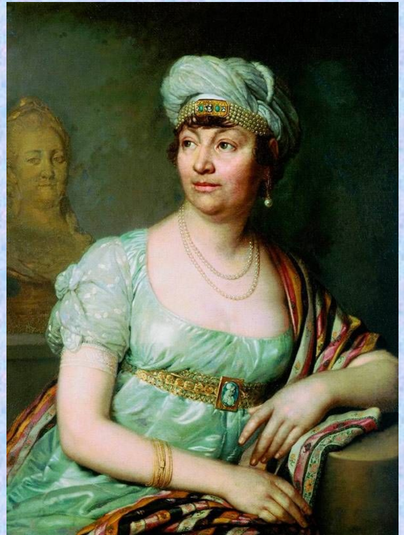
Портрет Анны Луизы Жермены де Сталь. 1812