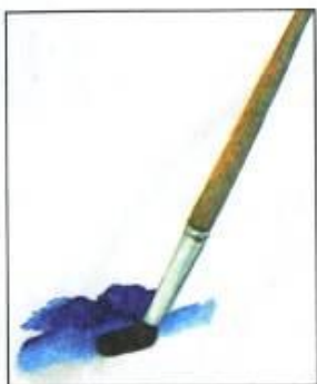
Мазок с тенью