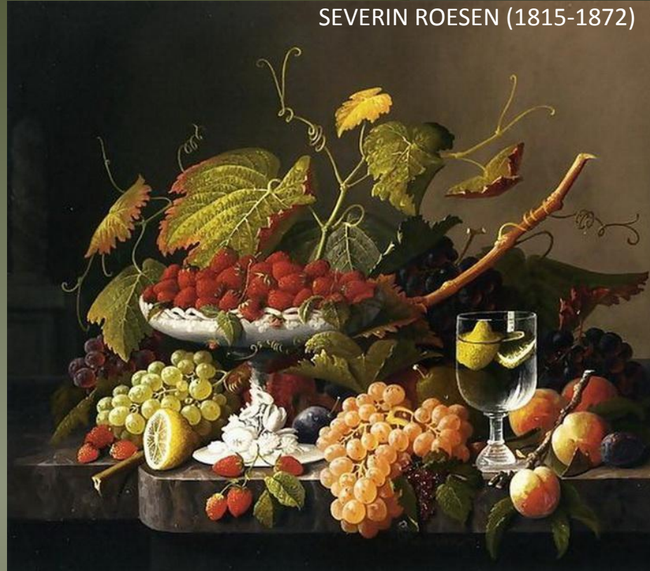
SEVERIN ROESEN (1815-1872)