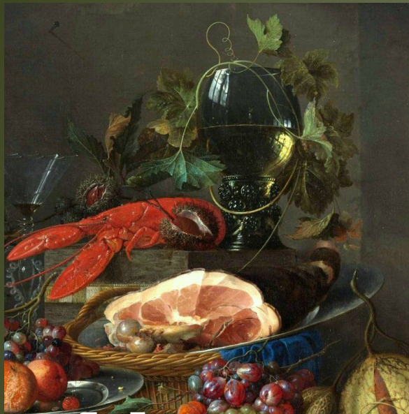
Ян Давидс де Хем

Какая это странная живопись - натюрморт: она заставляет любоваться копией тех вещей, оригиналами которых не любишь.