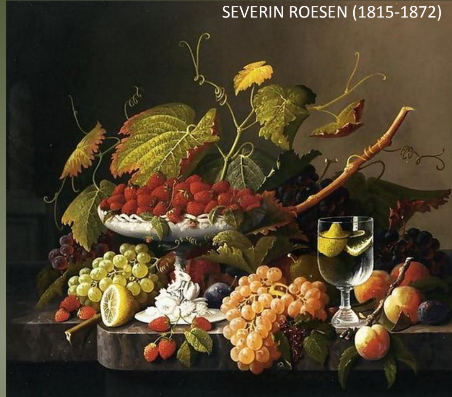
SEVERIN ROESEN (1815-1872)