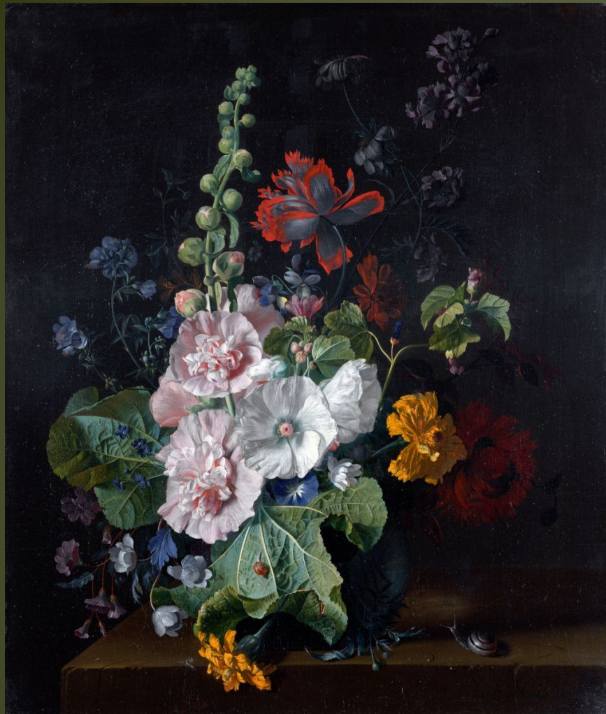
Ян Ван хейсум