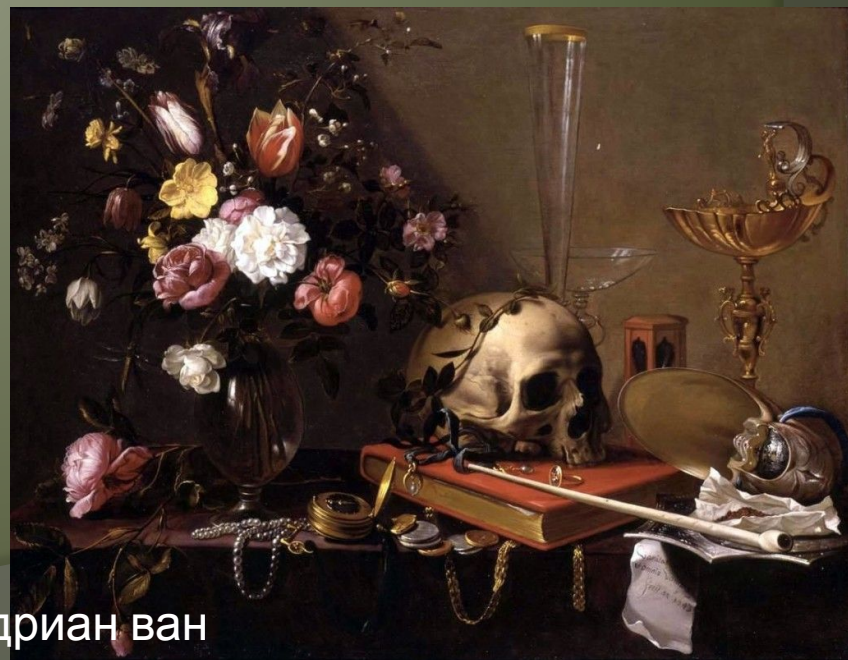
Адриан ван Утрехт