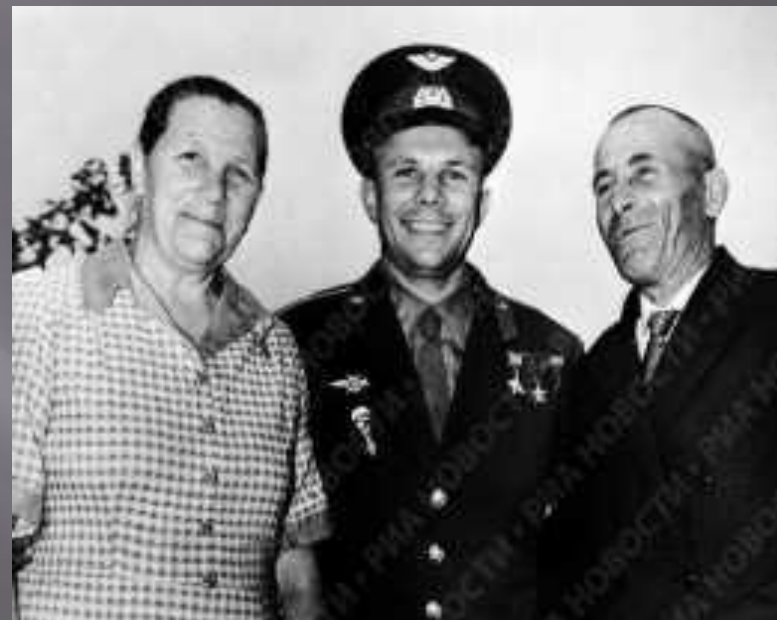
Родители Ю.А. Гагарина