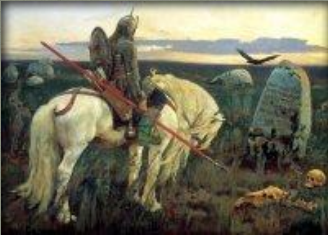
Витязь на распутье (1878)