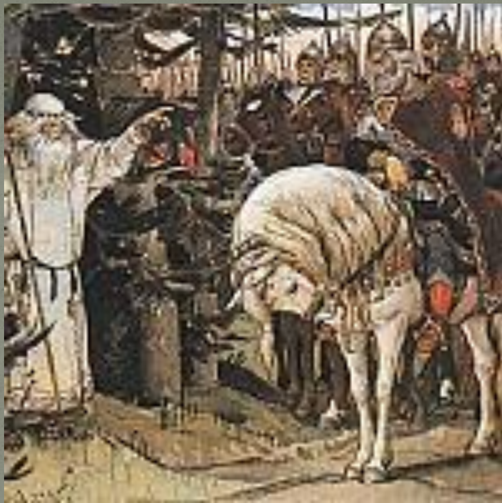
Встреча Олега с кудесником (1899)