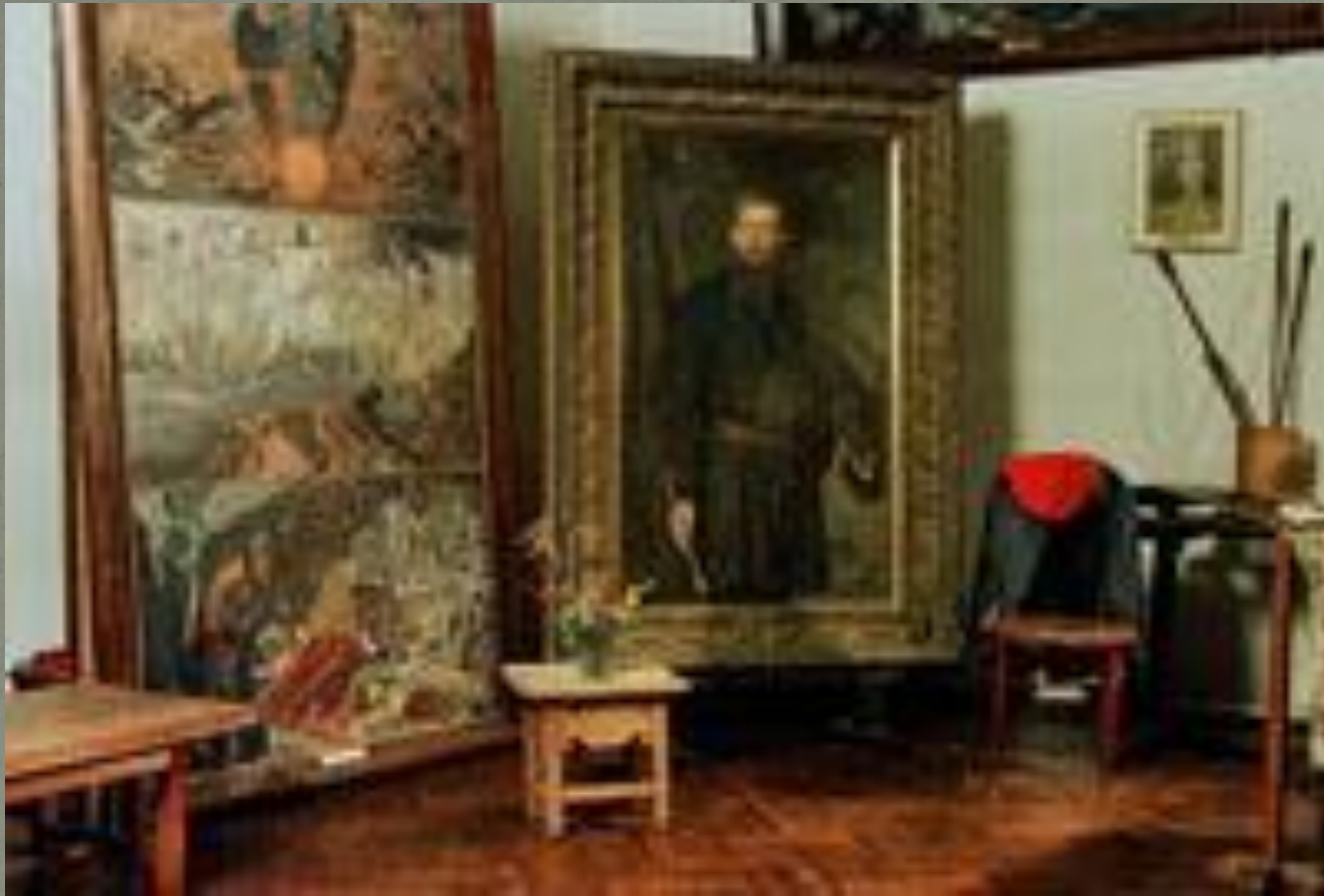
● Мастерская художника