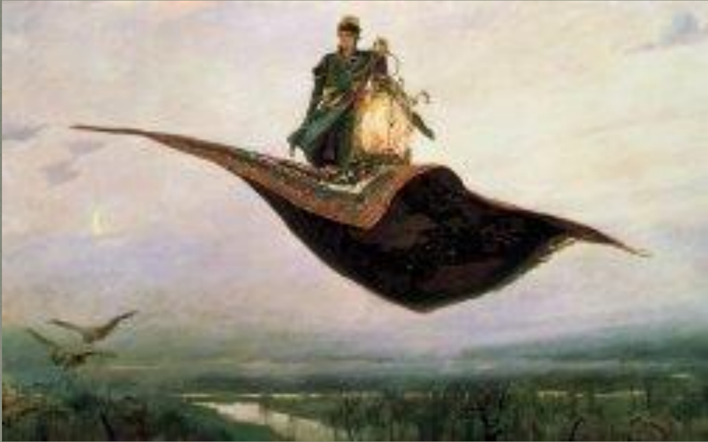
Ковёр- самолёт (1880)