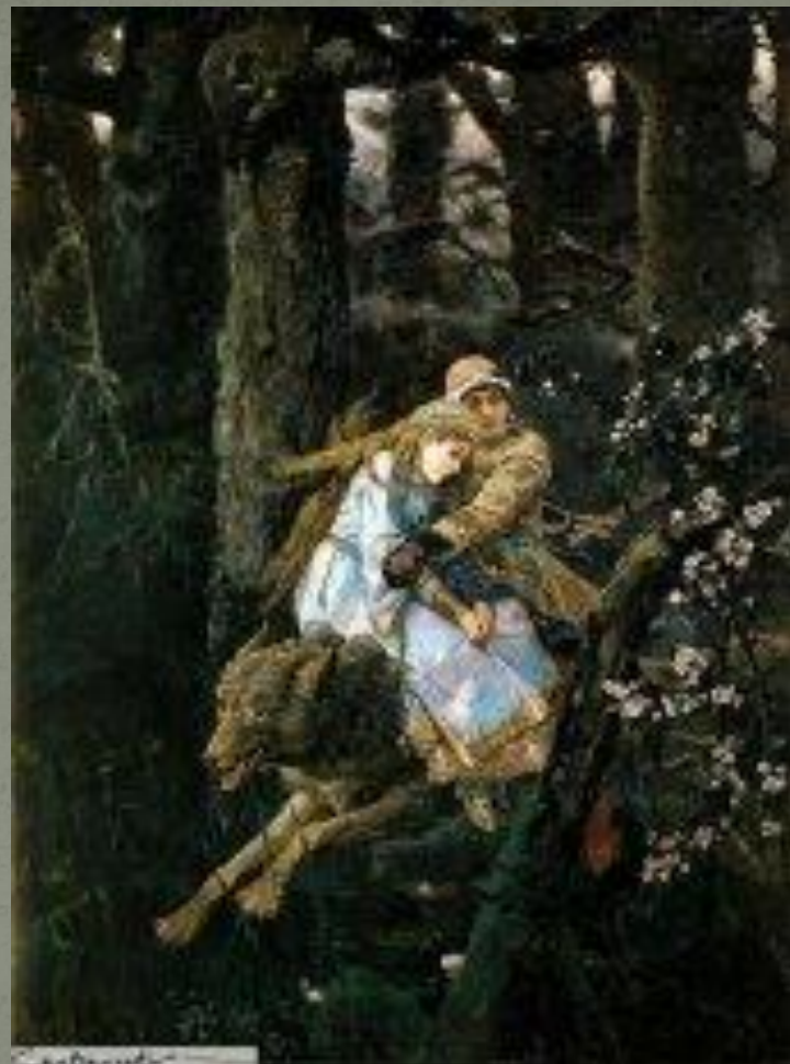
Иван-Царевич на Сером Волке (1889)