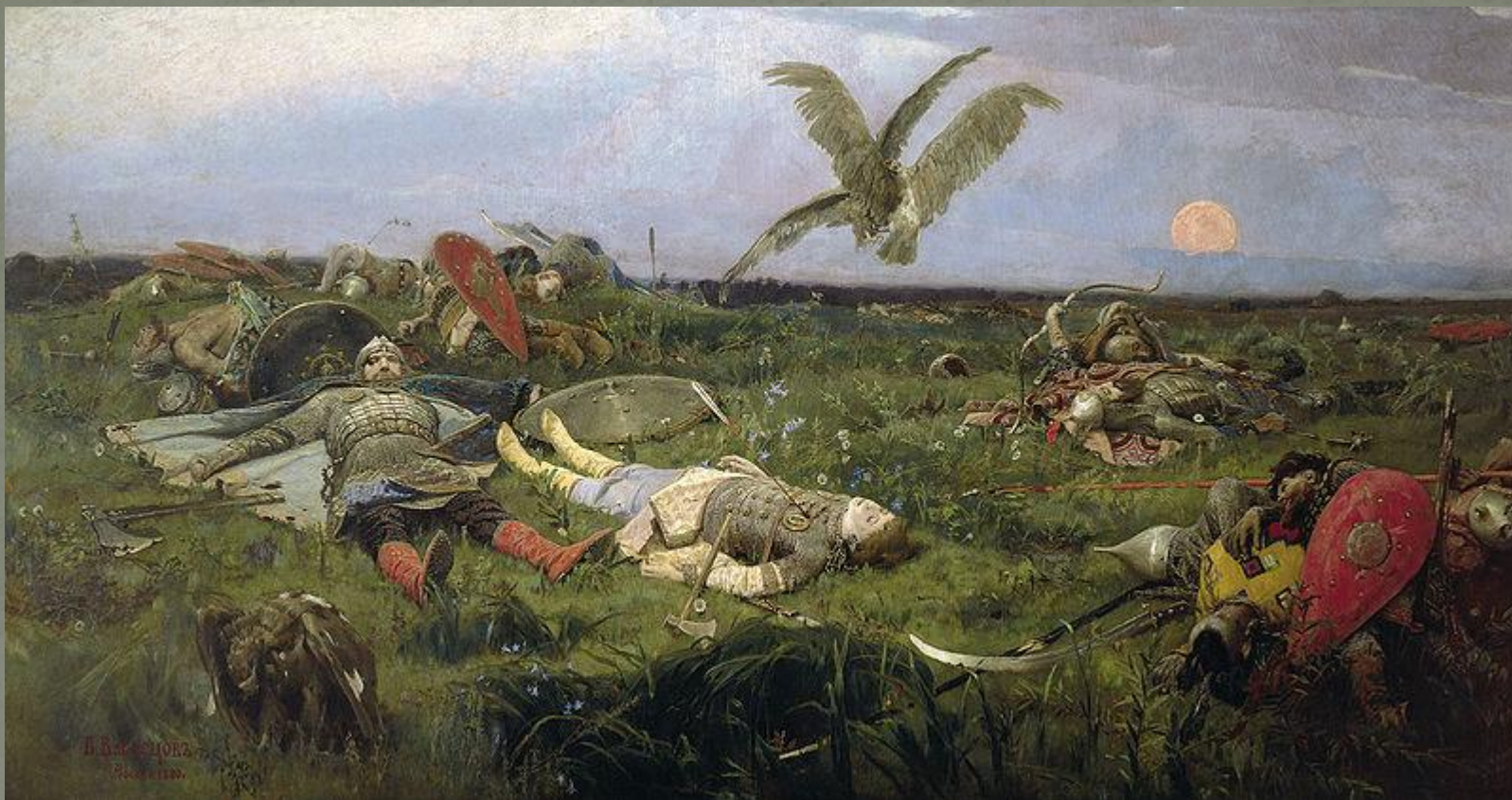
После побоища Игоря Святославовича с половцами (1880)