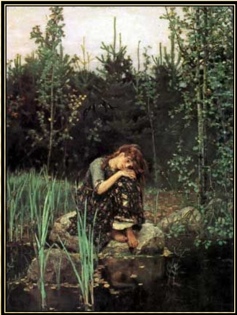
В. Васнецов «Аленушка»