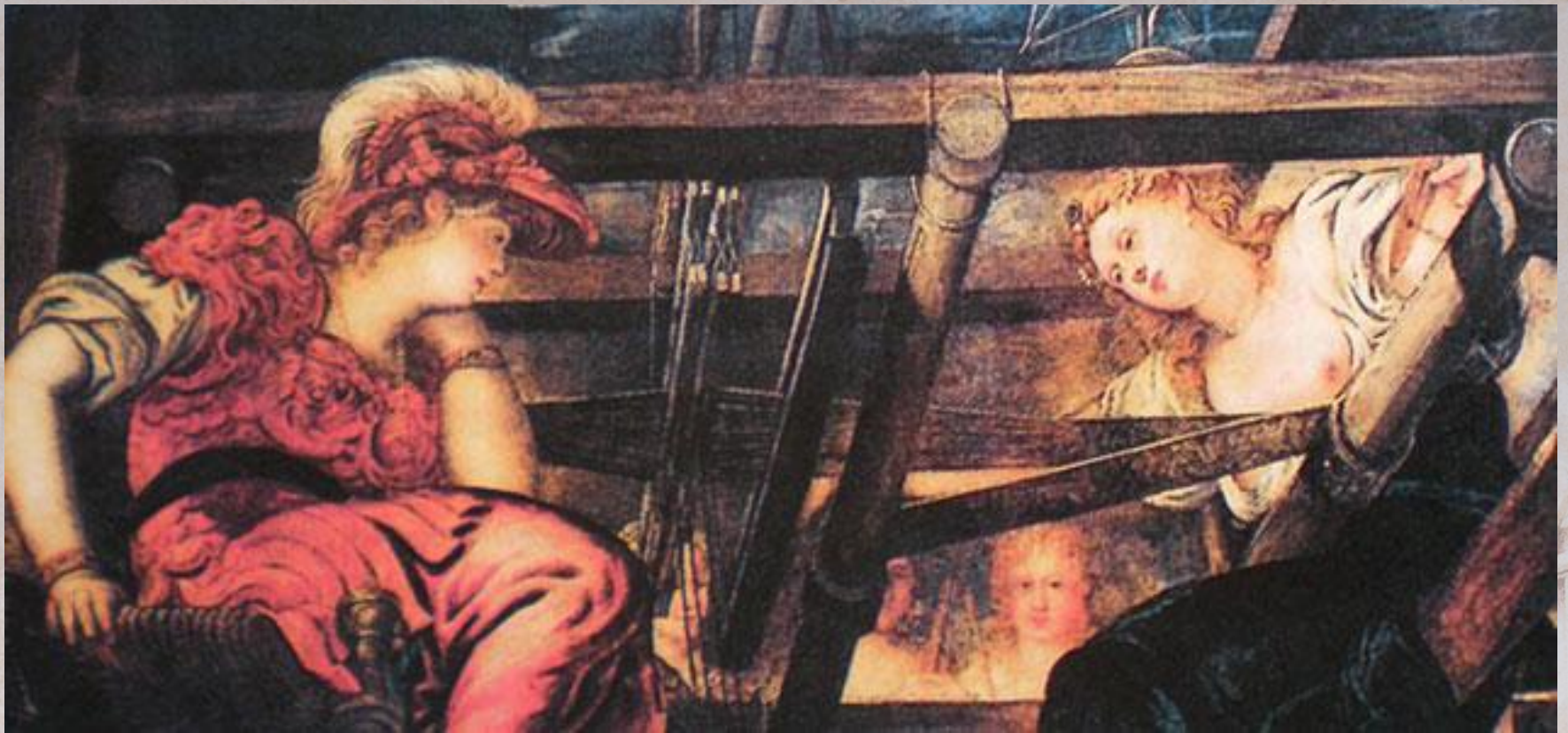
Якопо Тинторетто «Афина и Арахна» 1540 г.