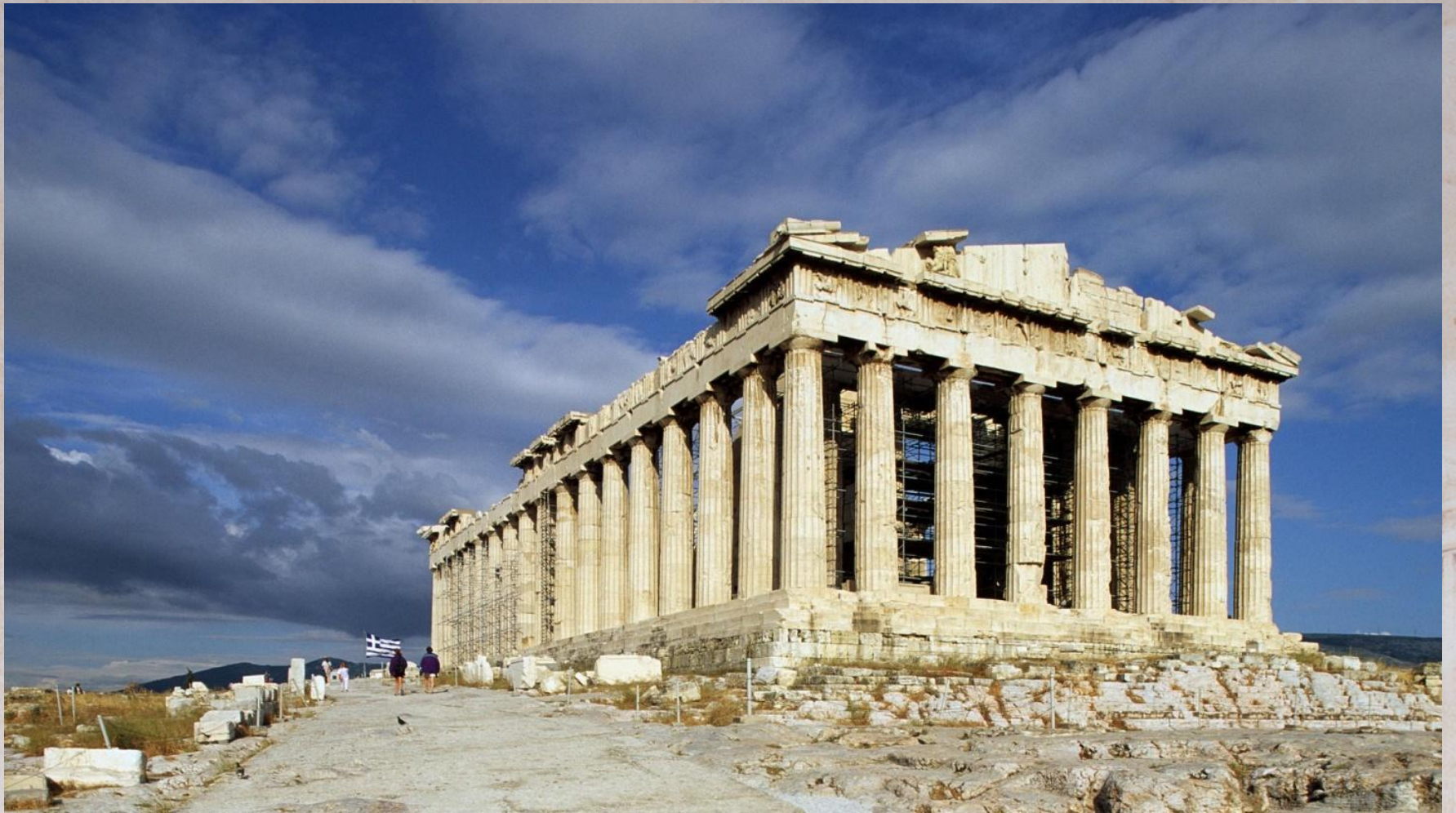
Парфенон. Акрополь. V в. до н.э.