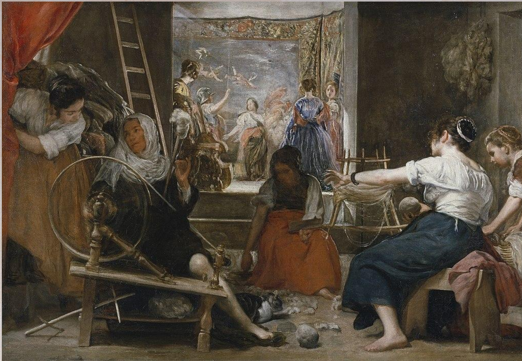
Диего Веласкес. Пряжи. ок. 1657