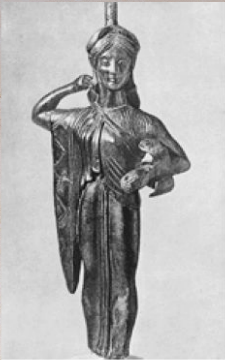
Афина Промахос. Статуэтка с афинского Акрополя. Бронза. Ок. 500 г. до н.э.