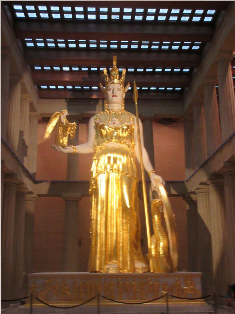
Фидий Афина Парфенос. 447–438 гг. до н. э.