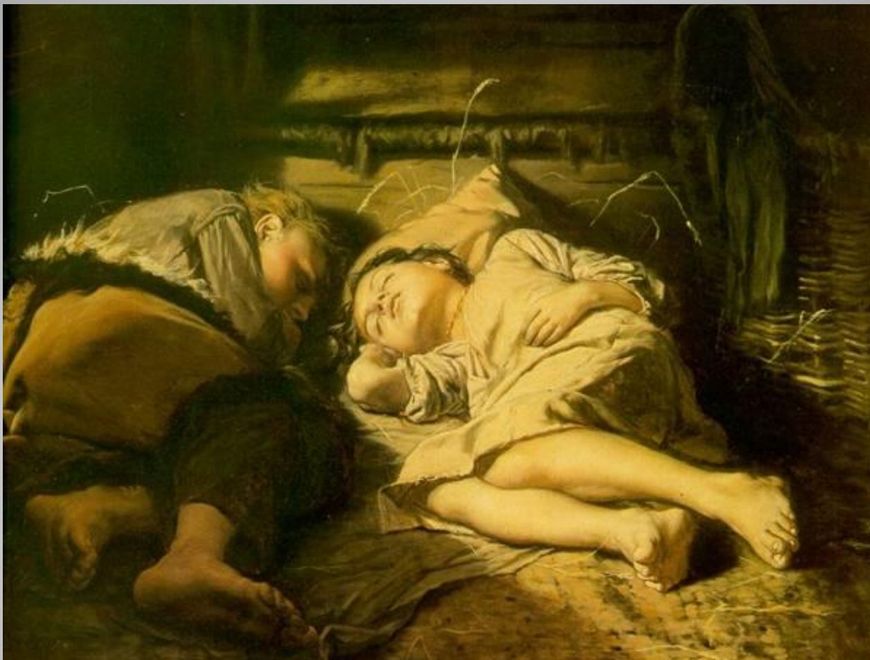
И.Перов «Чистый понедельник»