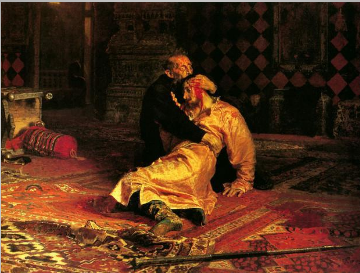
Репин И.Е. Иван грозный и его сын Иван