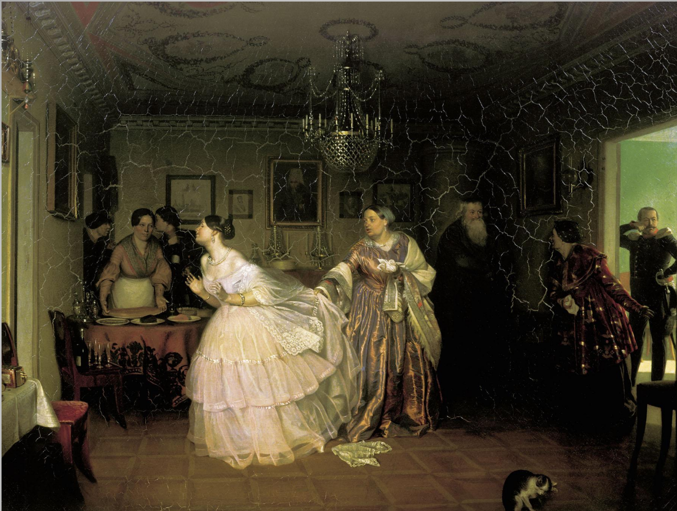
П.А.Федотов «Сватовство майора»