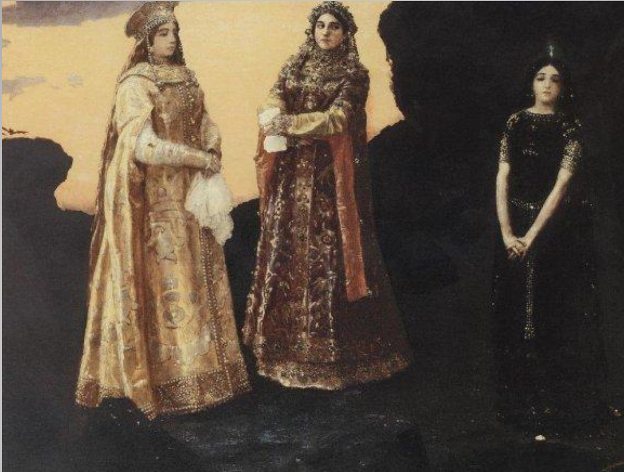
Васнецов Виктор Михайлович Три царевны.