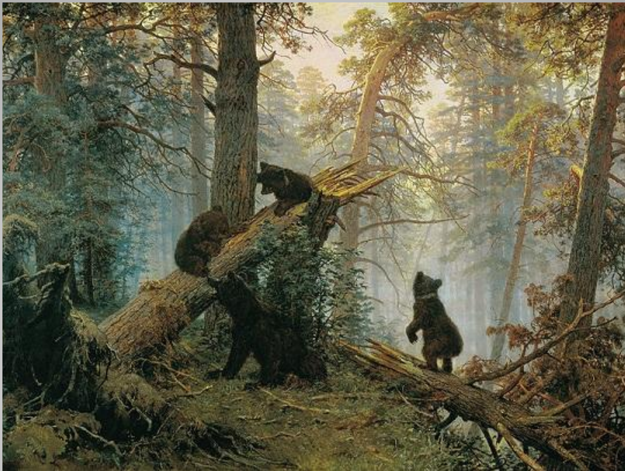
Иван Шишкин утро в сосновом лесу