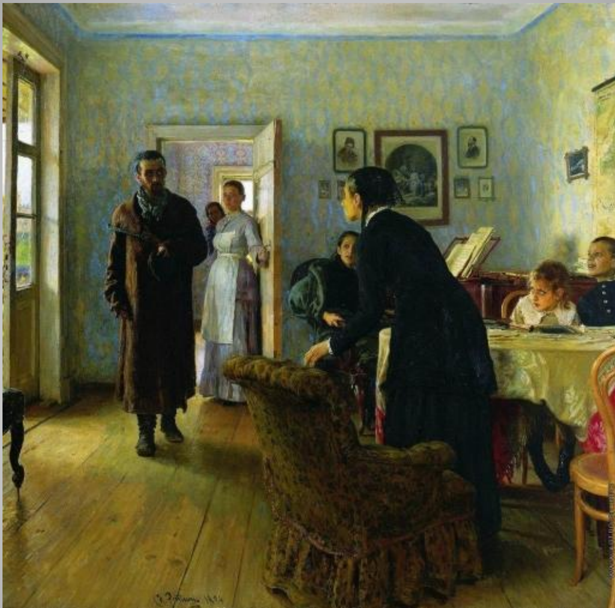
Репин И. Е. Не ждали