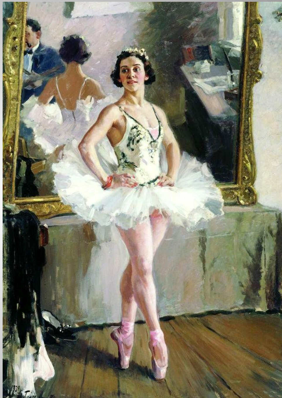
Герасимов А.М. Портрет балерины О.В. Лепешинской