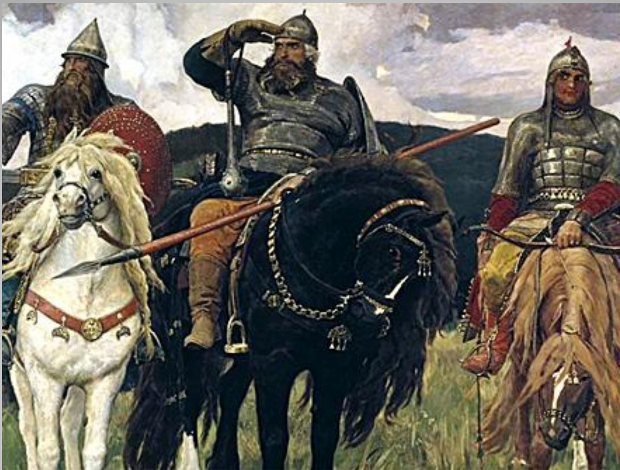
Всем известная картина Васнецова «Три богатыря»