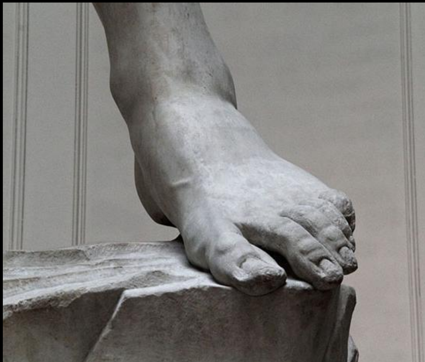
автор Комар Валерия Евгеньевна