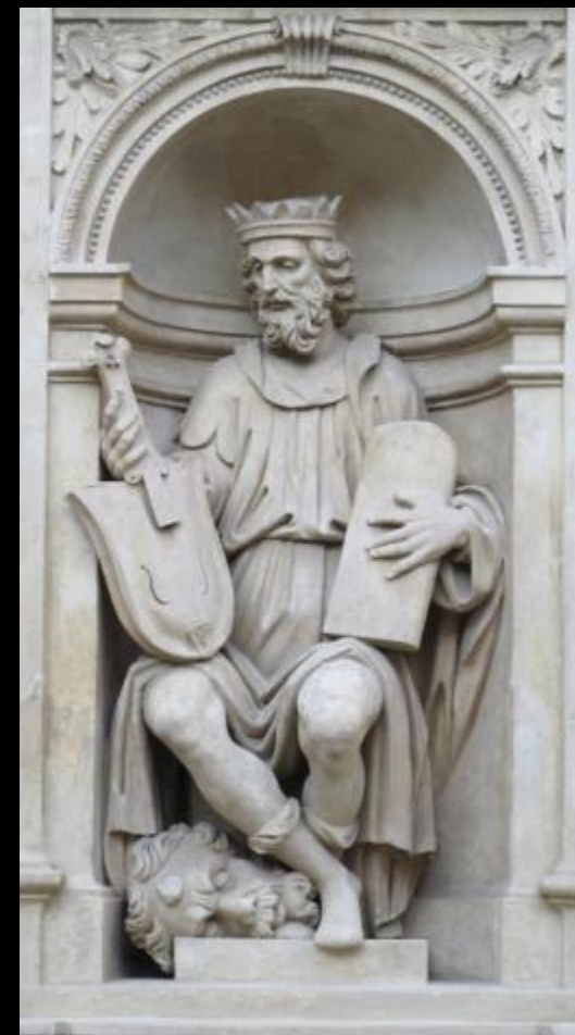
Фрагмент собора в

Париже Советаясь в прах ответьте на вопрос: Что за человек изображен на репродукциях? Каков он? Какие качества хотел подчеркнуть мастер в скульптурном портрете?