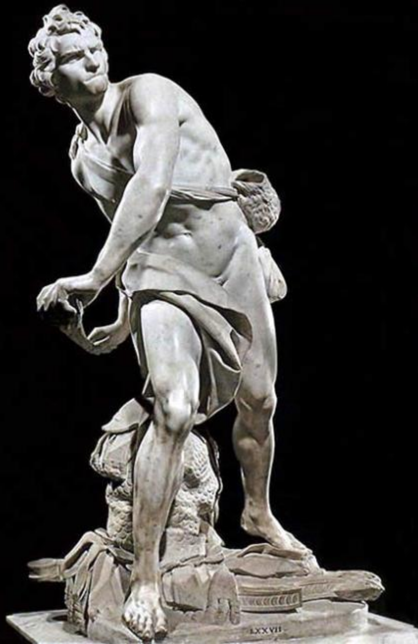
автор Комар Валерия Евгеньевна