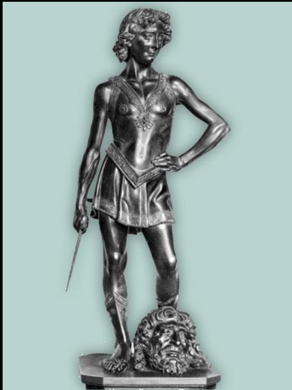
автор Комар Валерия Евгеньевна