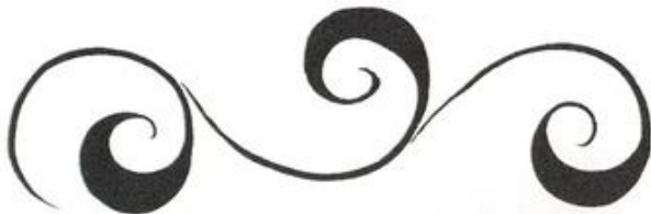
ВЕДУЩИЙ СТЕБЕЛЬ — «КРИУЛЬ»