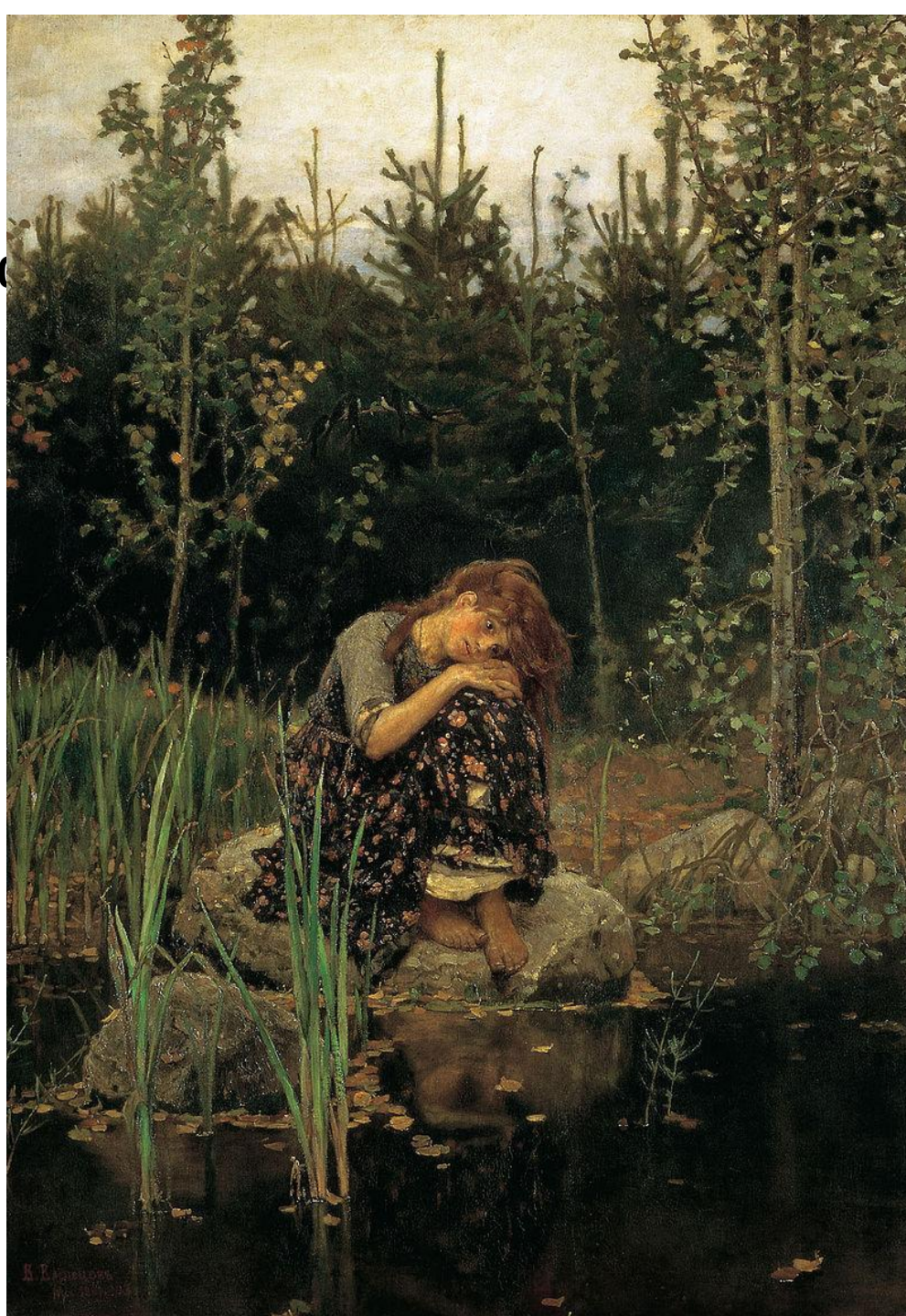
Аленушкин пруд 1880