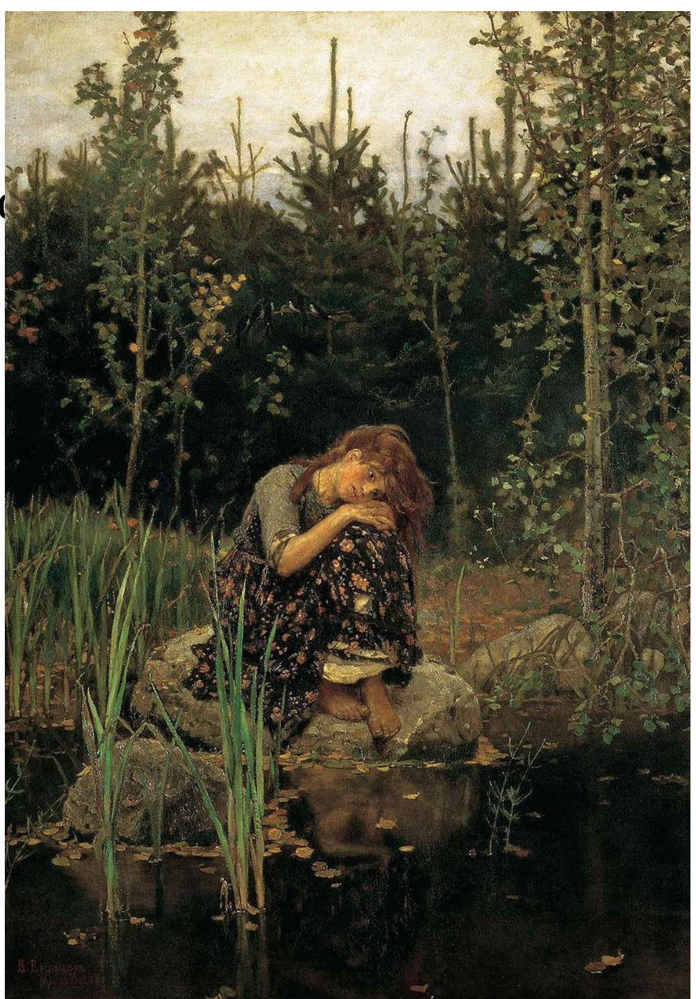
Аленушкин пруд 1880