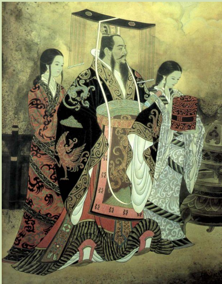
Император Цинь Шихуан