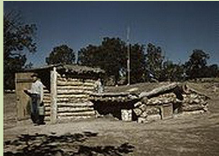
Землянки- первые жилища простых кимтайцев