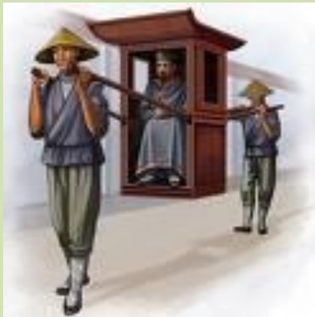
Чиновник в паланкинге