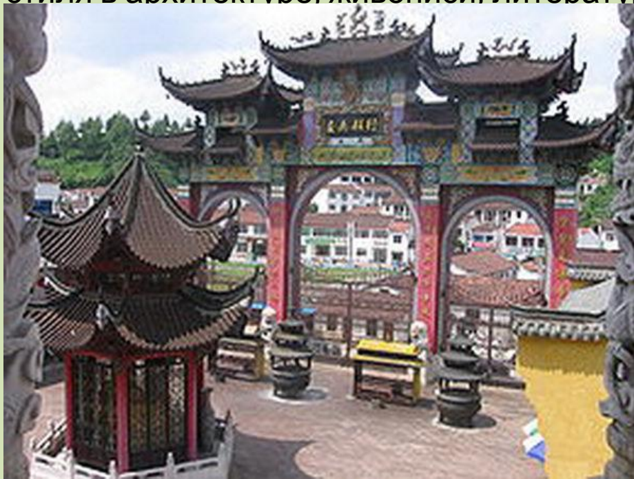
Ворота Буддийского храма

Буддизм проник в Китай на рубеже III - II до н. э. и воспринимался как часть даосизма . К VI веку он приобрёл статус государственной религии. Буддийские монастыри превратились в крупных земельных собственников и места сосредоточения богатств. Буддизм в Китае не вытеснил конфуцианство и даосизм , а составил комплекс «трех религий», где каждое учение как бы дополняло два других. Учение Будды выражало «внутреннюю» сторону наследия древних китайских мудрецов, в ведении буддистов оказались заупокойные обряды. Эти религии способствовали укреплению династий, которые проводили реформы по «воле Неба», монастыри всегда были центрами образования, науки. Религии способствовали формированию особого стиля в архитектуре, живописи, литературе и музыке.