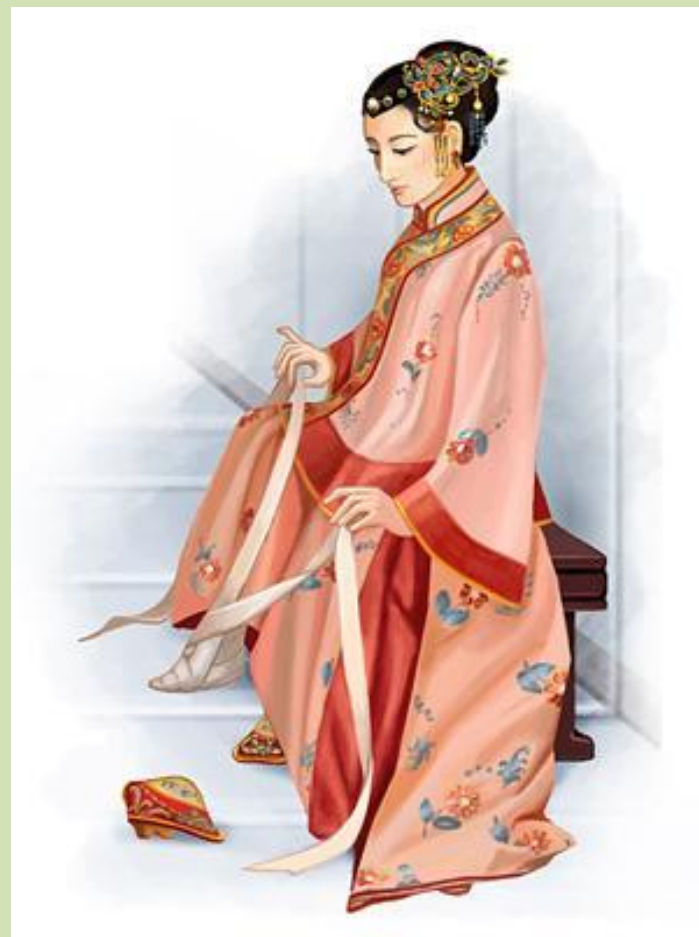
Девушка , бинтующая ножку