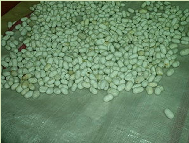
Коконь туюого шелкопряда

В середине I тыс. до н. э. Китай переживает бурный социально-экономический рост. Складываются новые центры торговли, численность населения многих городов приближается к полумиллиону. Высокого уровня достигают плавка железа. Успешно развиваются ремесла, строятся гидротехнические сооружения. В земледелии широко используются оросительные системы.