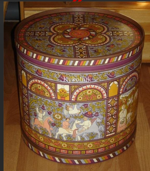
Короб для хлеба