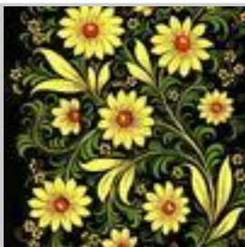
Хохлома. Фоновое письмо