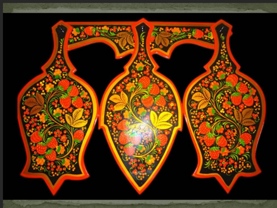
Набор разделочных досок Хоновая роспись