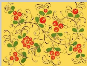
Хохлома. Верховой стиль.