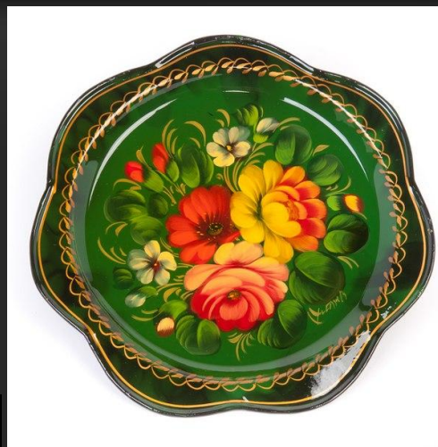
«Букет на зеленом»