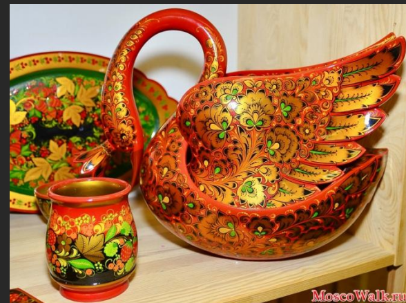
Ваза Лебедь кудрина