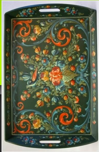
«Поднос» старая роспись