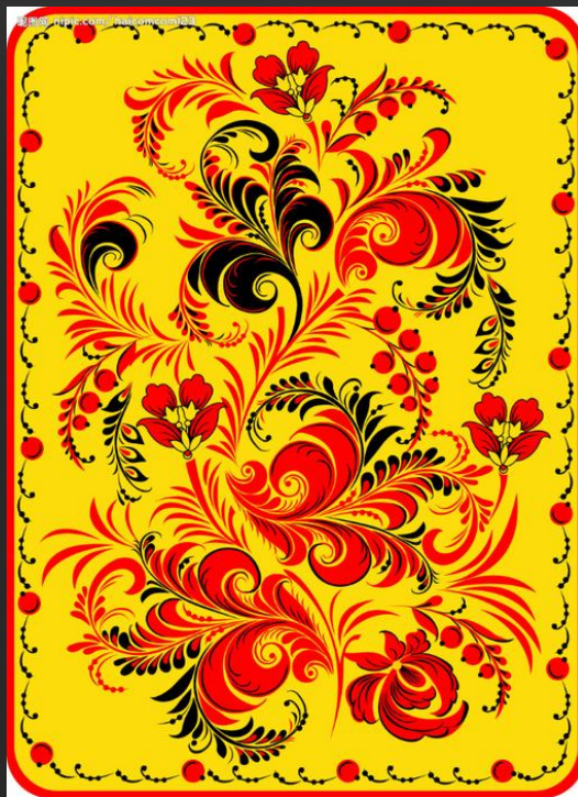
Доска для теста