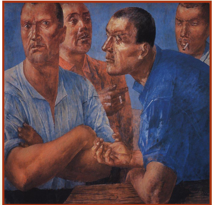
К.С. Петров-Водкин. Рабочие

Его искусство расцветает в послеоктябрьское время, но уже в девятисотые годы он заявляет о творческой самобытности прекрасными полотнами.