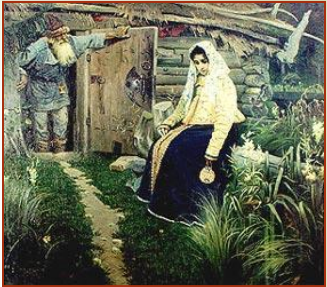
М. В. Нестеров. За приворотным зельем