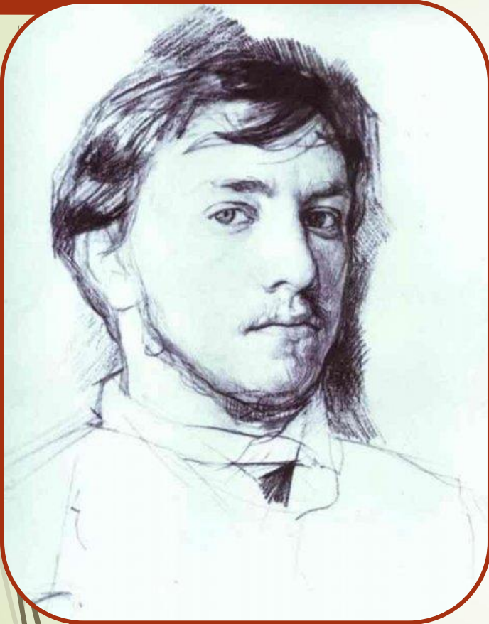
Валентин Серов. Автопортрет