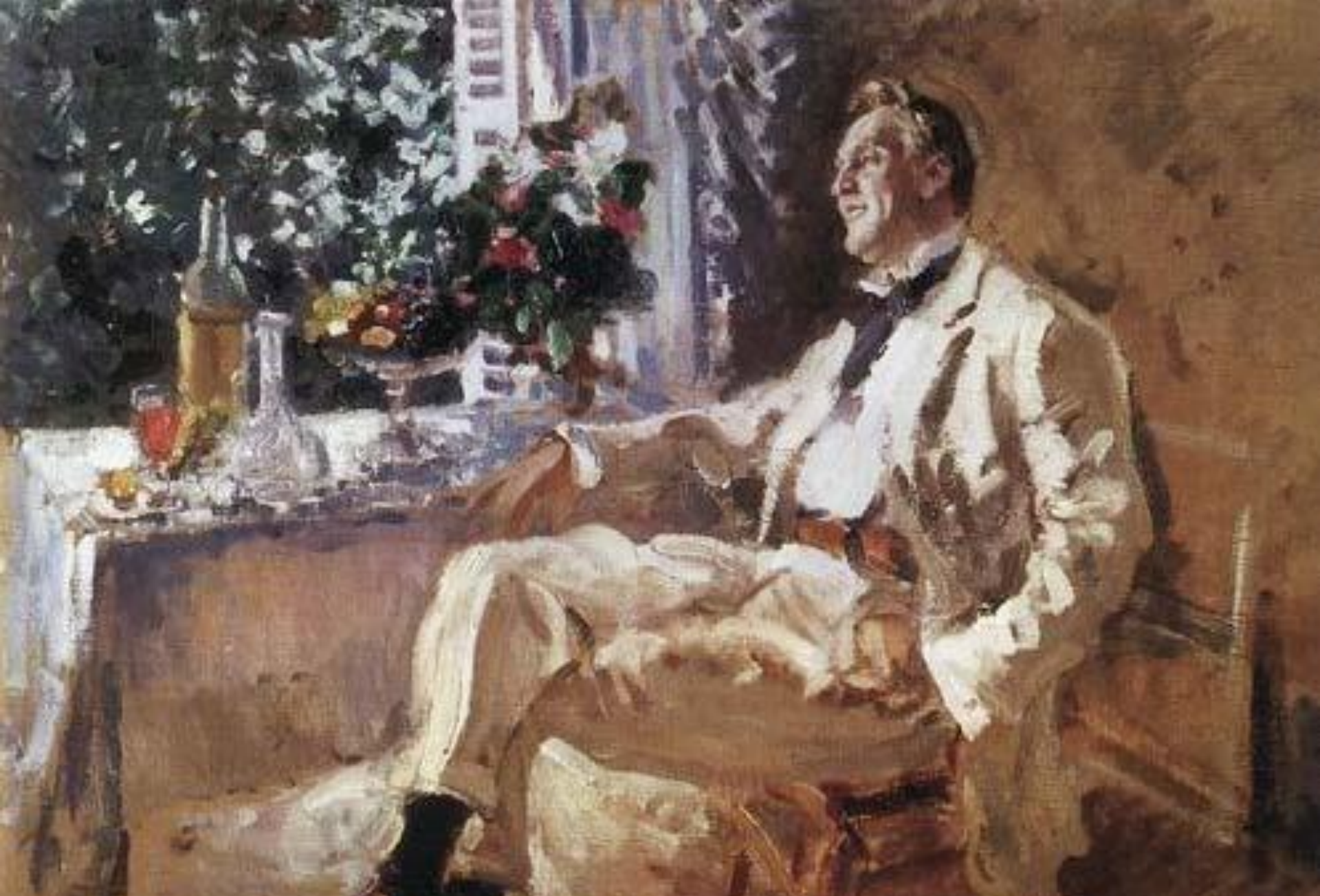
К.А. Коровин. Портрет Ф.И. Шаляпина