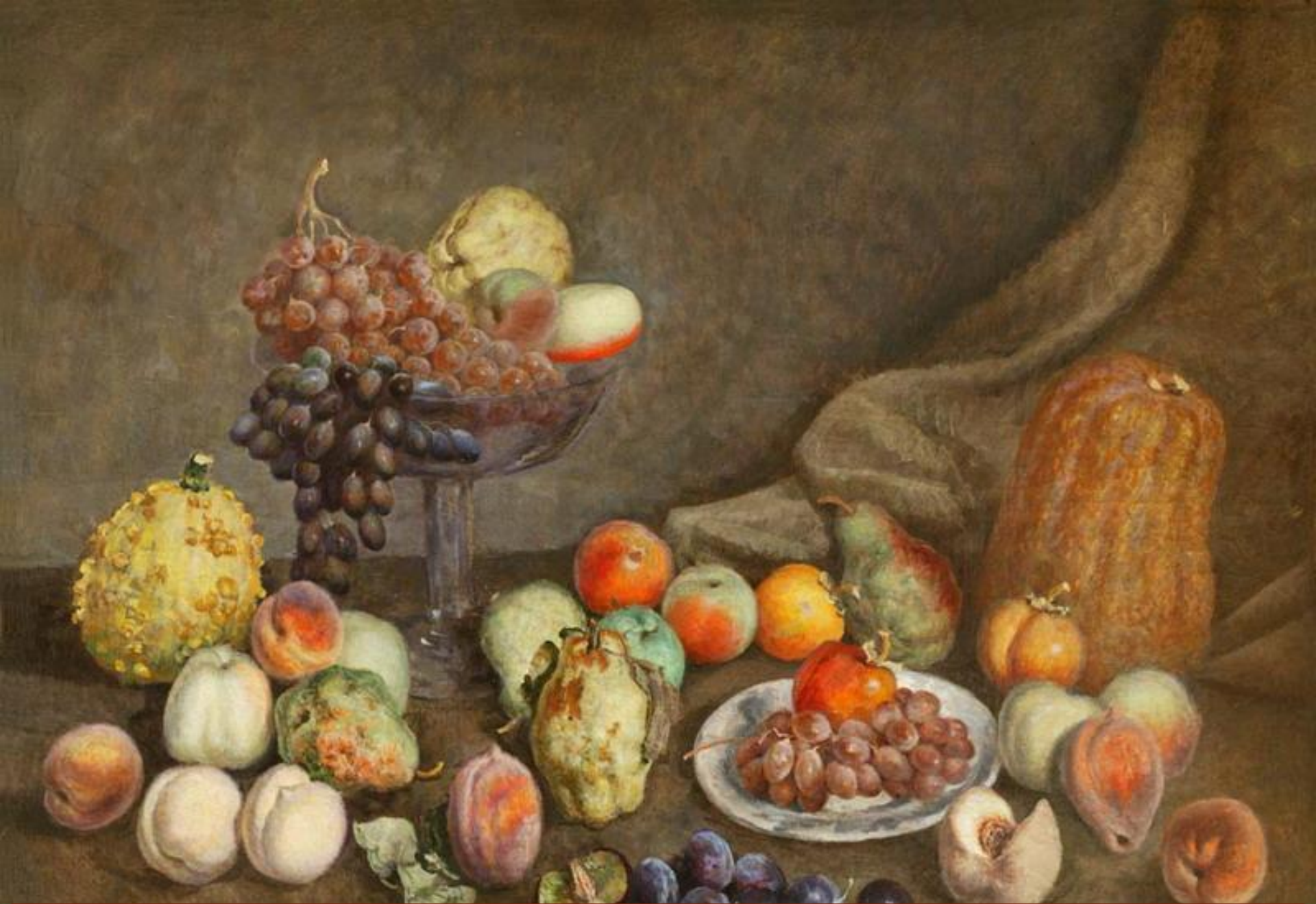
И. И. Машков. Фрукты