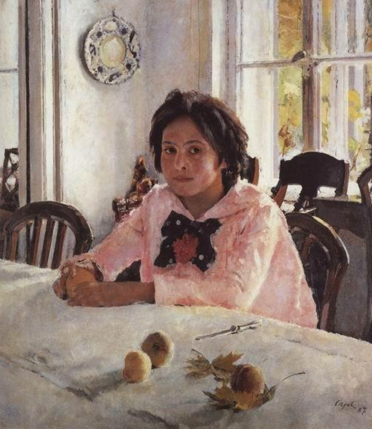
Валентин Серов «Девочка с персиками»