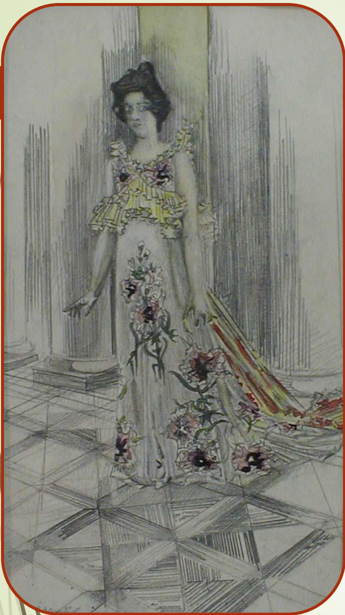
Портрет певицы Н. И. Забеллы-Врубель.