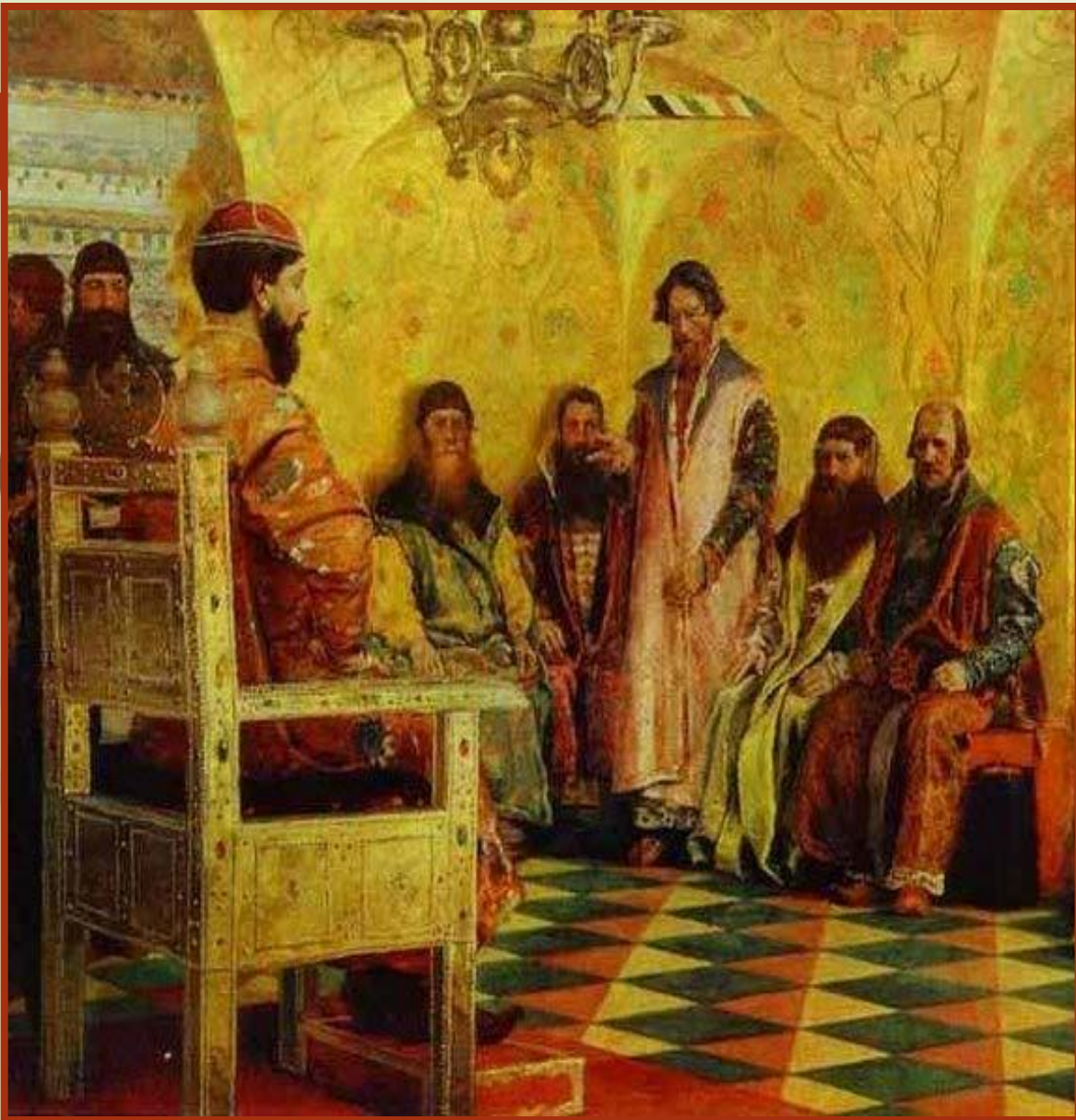
А. П. Рябушкин. Царь Михаил Федорович на собрании боярской думы