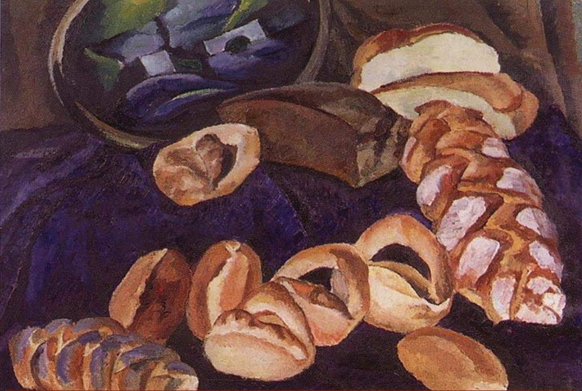
П. П. Кончаловский. Хлебы на синем