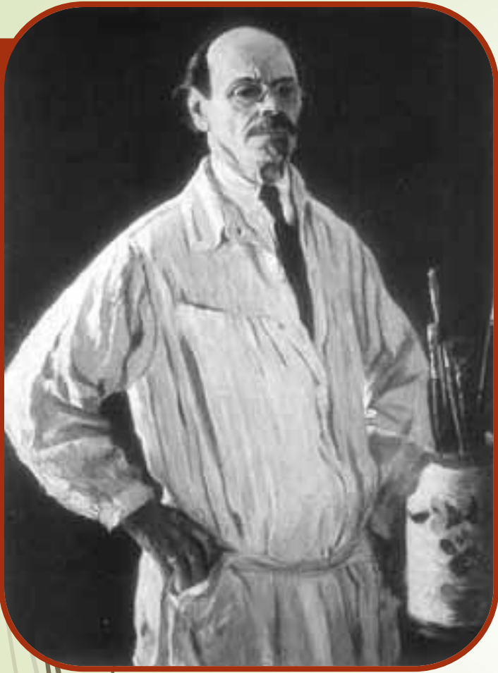
М. В. Нестеров. Автопортрет