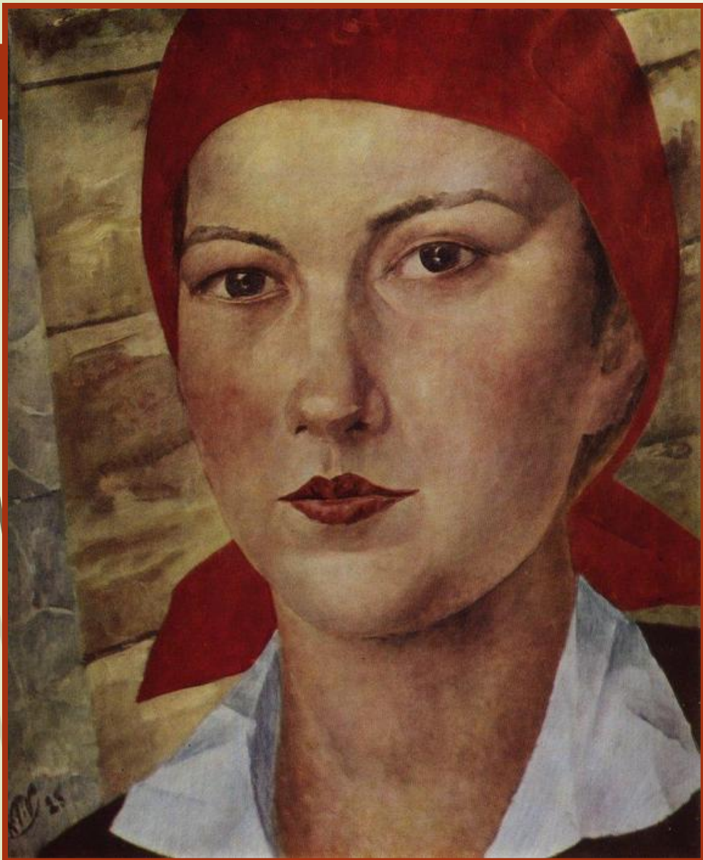
К.С. Петров-Водкин. Девушка в красной косынке