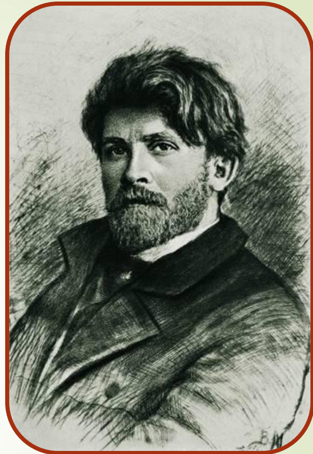
А. П. Рябушкин