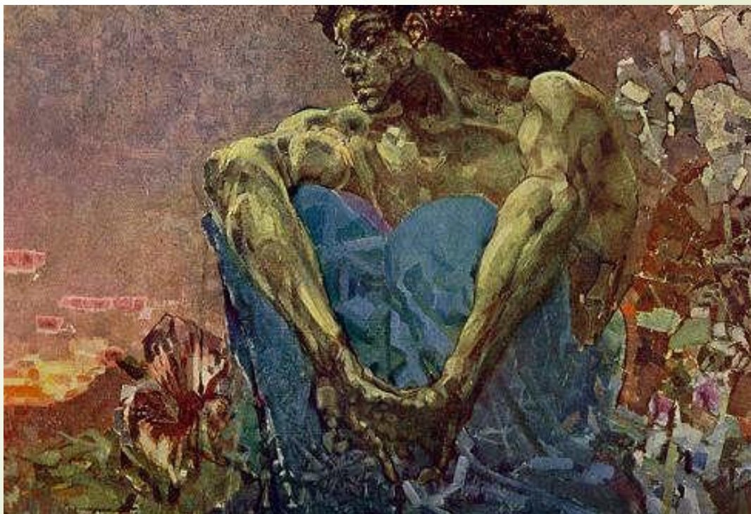
Михаил Врубель. Демон сидящий

В творчестве Врубеля фантазия соединилась с реальностью. Сюжеты некоторых его картин и панно откровенно фантастичны. Изображая Демона или сказочную Царевну Лебедь принцессу Грезу или Пана, он рисует своих героев в мире, словно созданном могучей силой мифа. Но даже тогда, когда предметом изображения оказывалась реальность, Врубель словно наделял природу способностью чувствовать и думать, а человеческие чувства безмерно усиливал в несколько раз. Художник добивался того, чтобы краски на его холстах сияли внутренним светом, светились, как драгоценные камни.