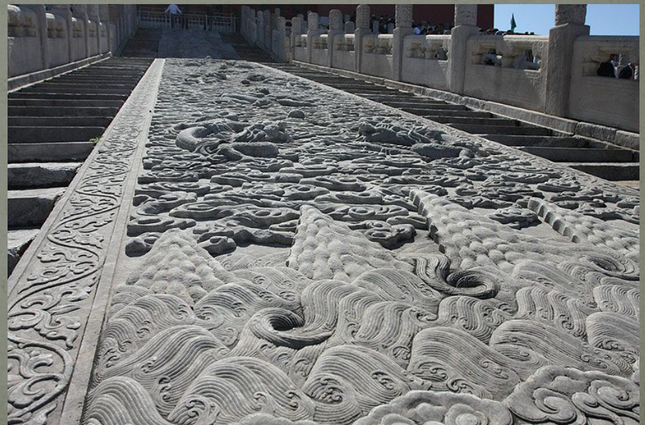
Большая Каменная Резьба