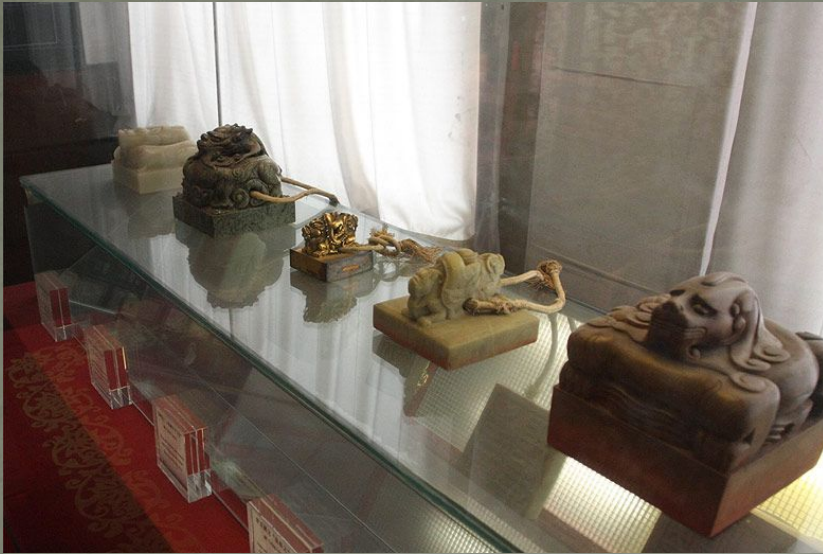
Выставка императорских печатей в Зале Воспитания Характера