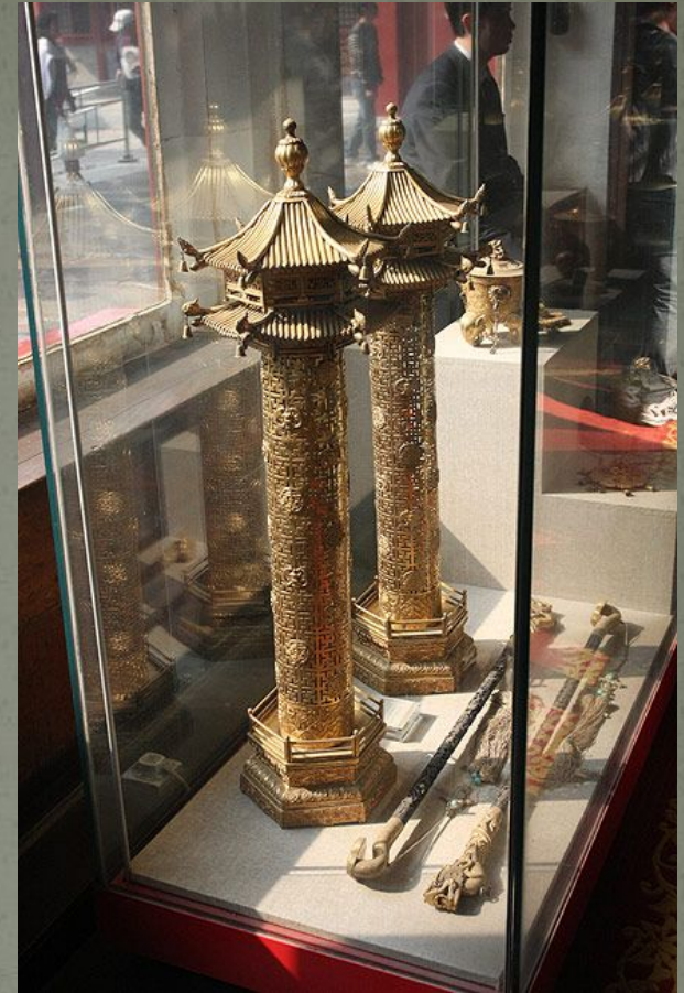
Экспонаты Выставки Сокровищ