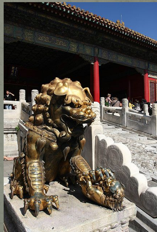
Львица и львенок перед Воротами Небесной Чистоты