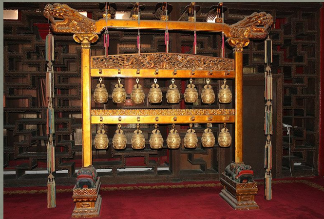
Золотые колокола в Зале Воспитания Характера