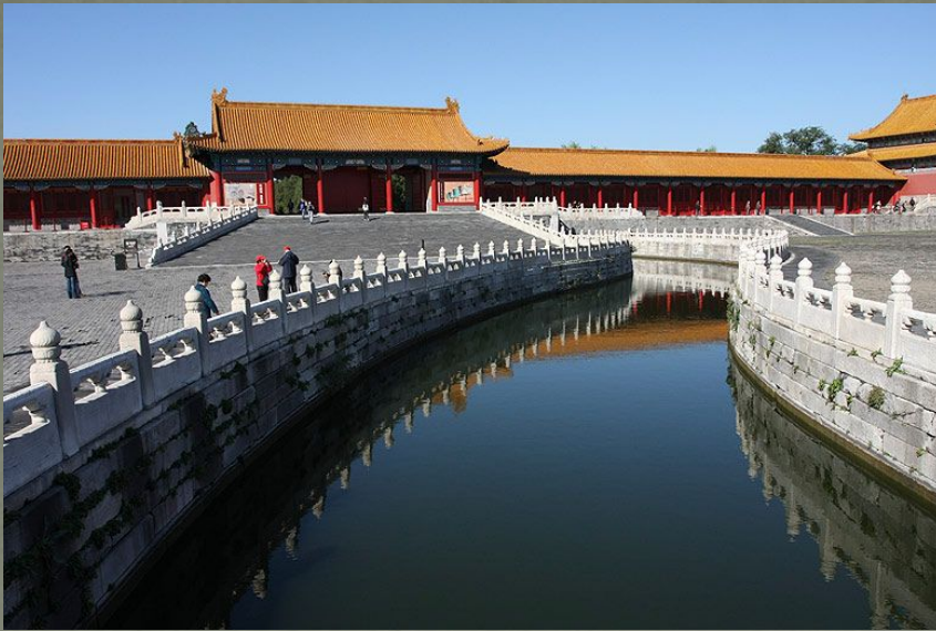
Внутренняя Золотая Вода