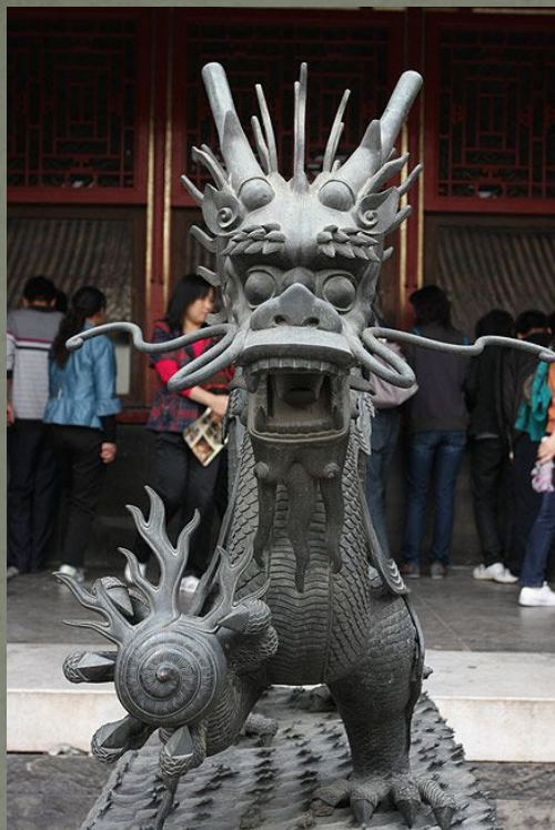
Дракон во дворе Дворца Собранных Превосходства