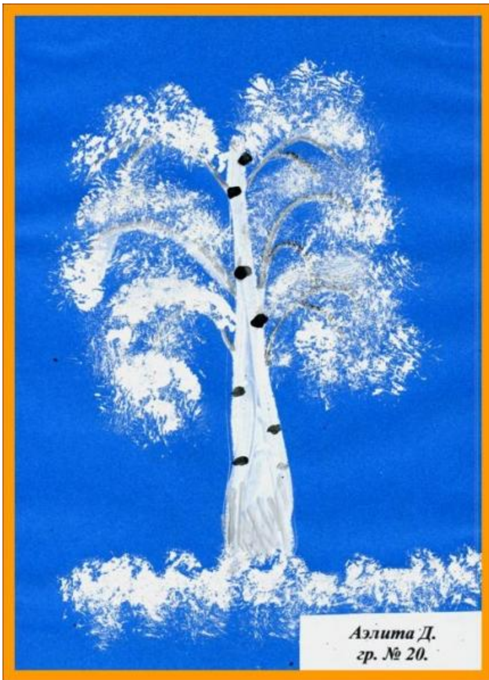
Аэлита Д. гр. № 20.