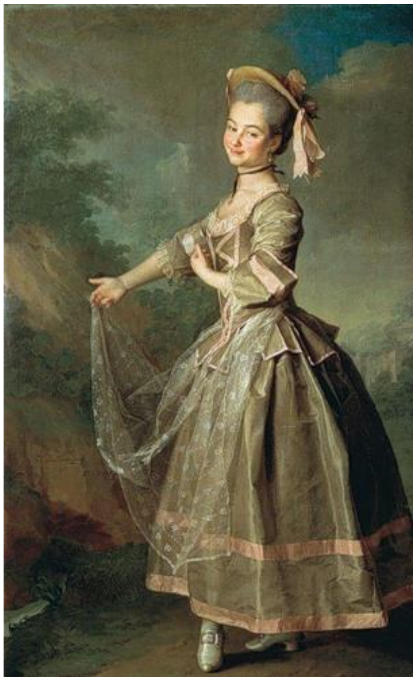
Екатерина Ивановна Нелидова, 1773г.