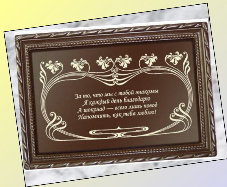
Открытки из шоколада