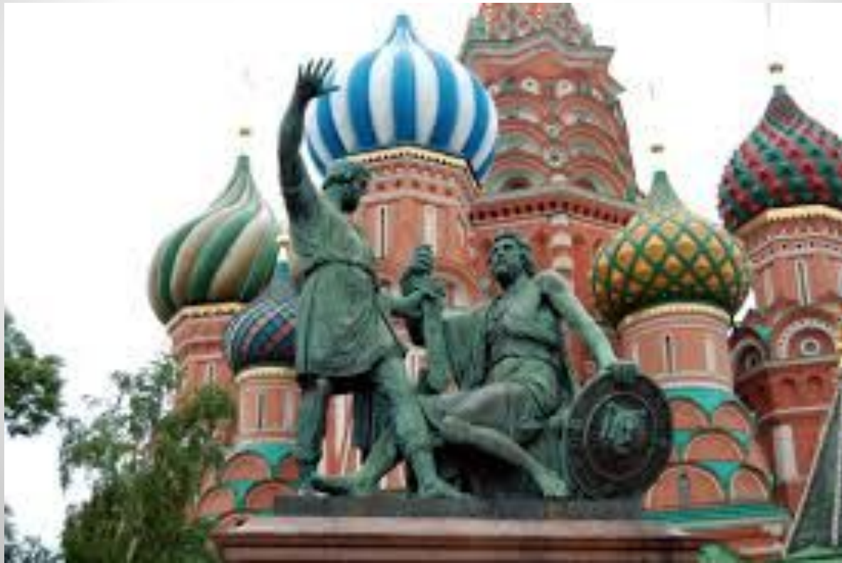
Памятник воеводе Козьме Минину и князю Дмитрию Пожарскому