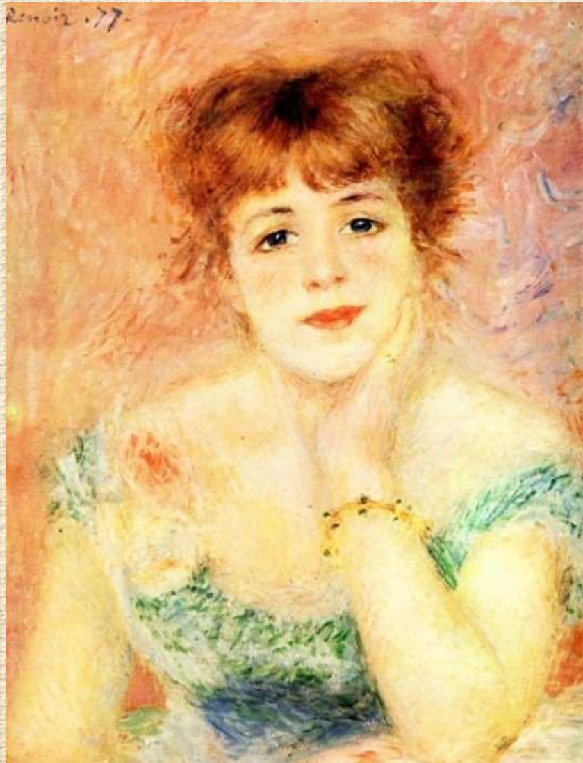
Огюст Ренуар «Жанна Самари»