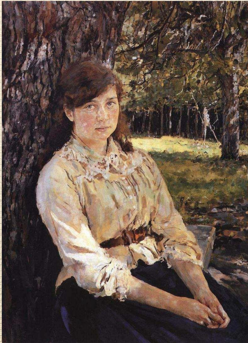
Серов «Девушка, освещенная солнцем»