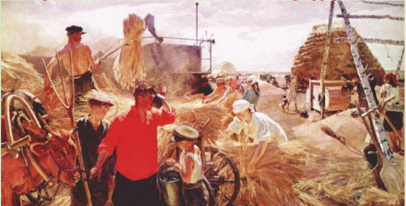
А.Пластов «На жатве».

Главной целью урока является формирование духовной культуры личности, приобщение к общечеловеческим ценностям, овладение национальным культурным наследием.