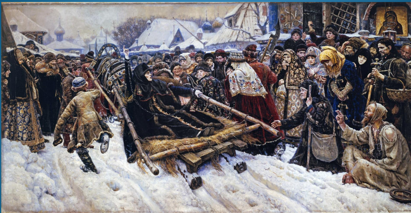
Исторический жанр «Боярыня Морозова» В. Суриков