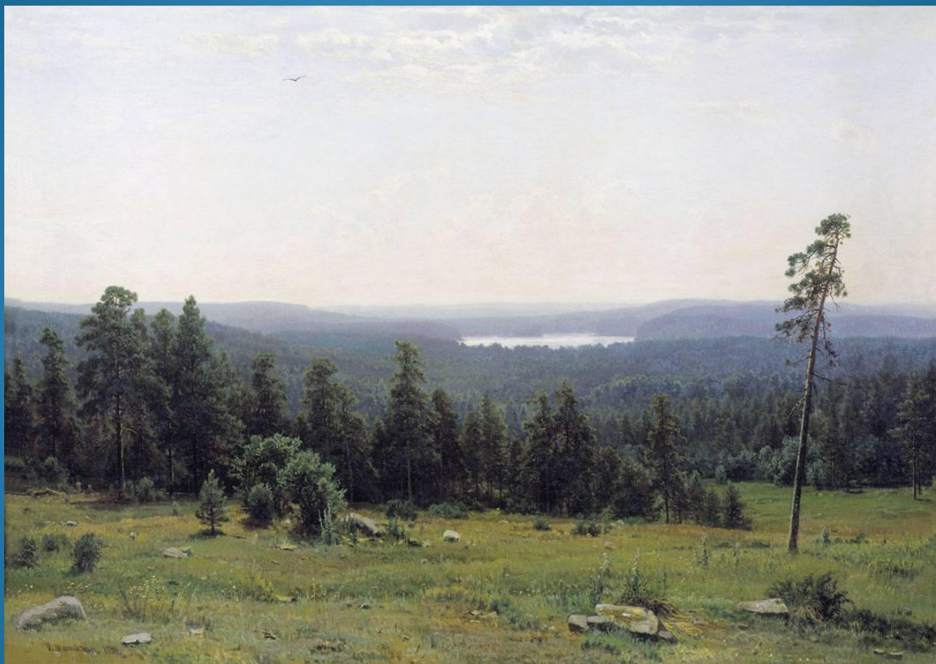
И. И. Шишкин «Лесные дали»