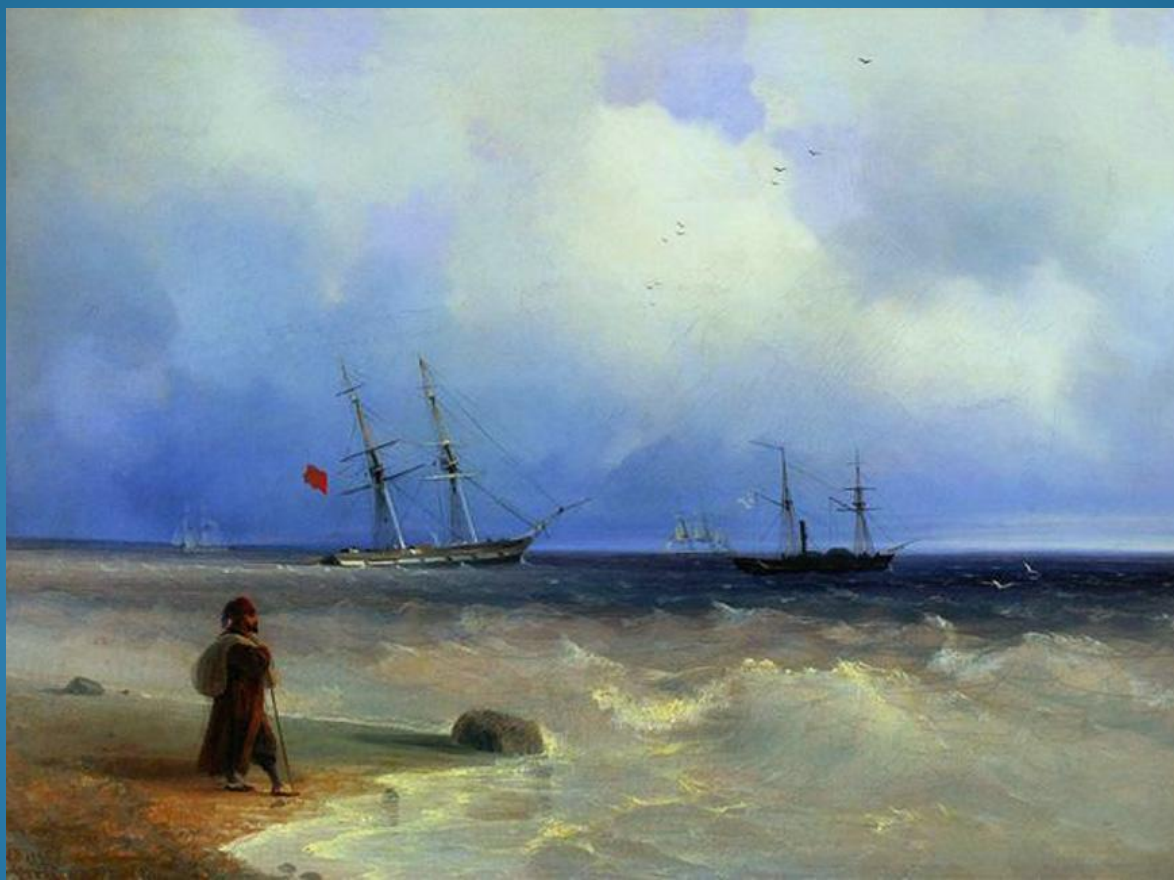
И. К. Айвазовский «Берег моря», 1840