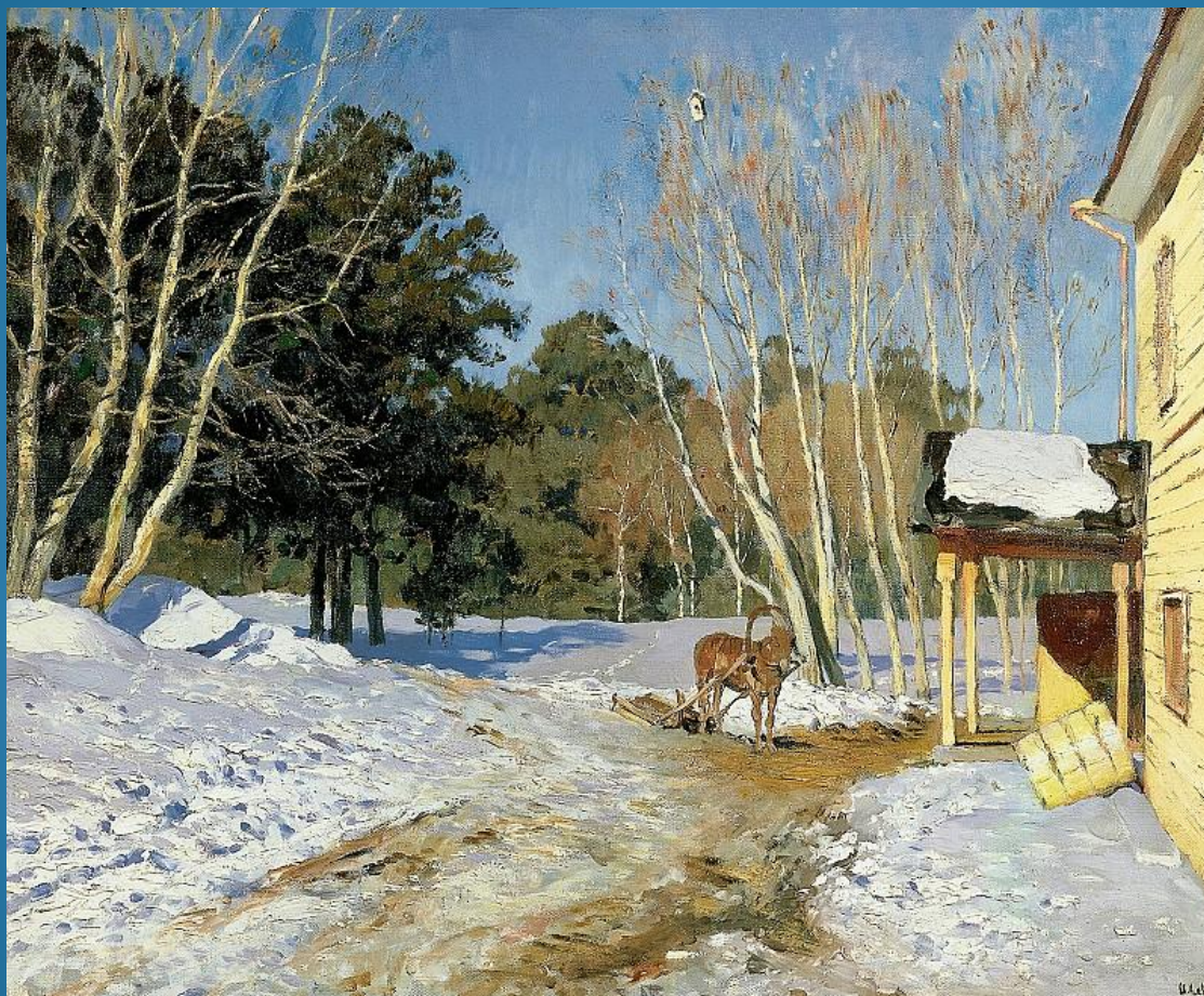
И. И. Левитан «Март», 1895