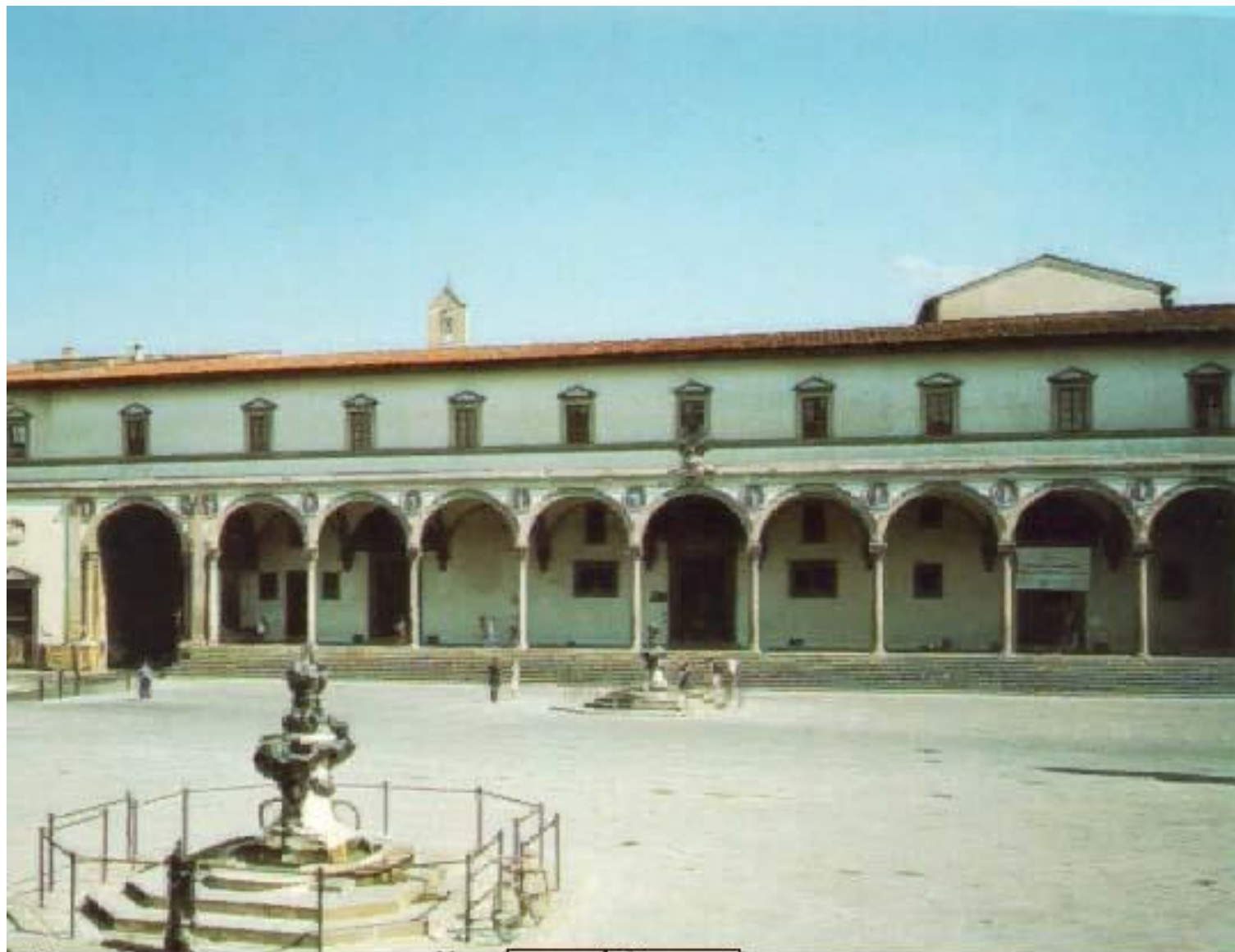
Воспитательный дом (Оспедале дельи Инноченти). Ф. Бруннелески. 1421- 1444 гг. Флоренция.