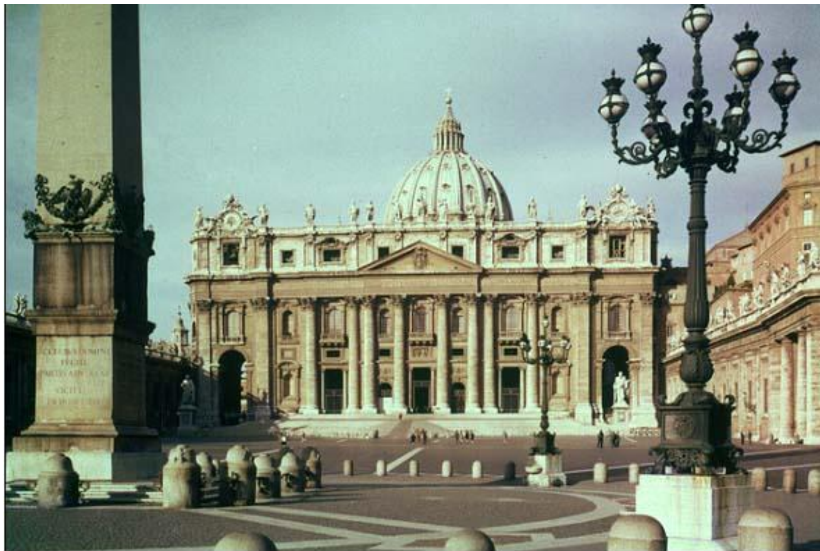
Собор Святого Петра в Риме. 1506-1614 гг. Вид со стороны колоннады Бернини, обрамляющей площадь перед собором.