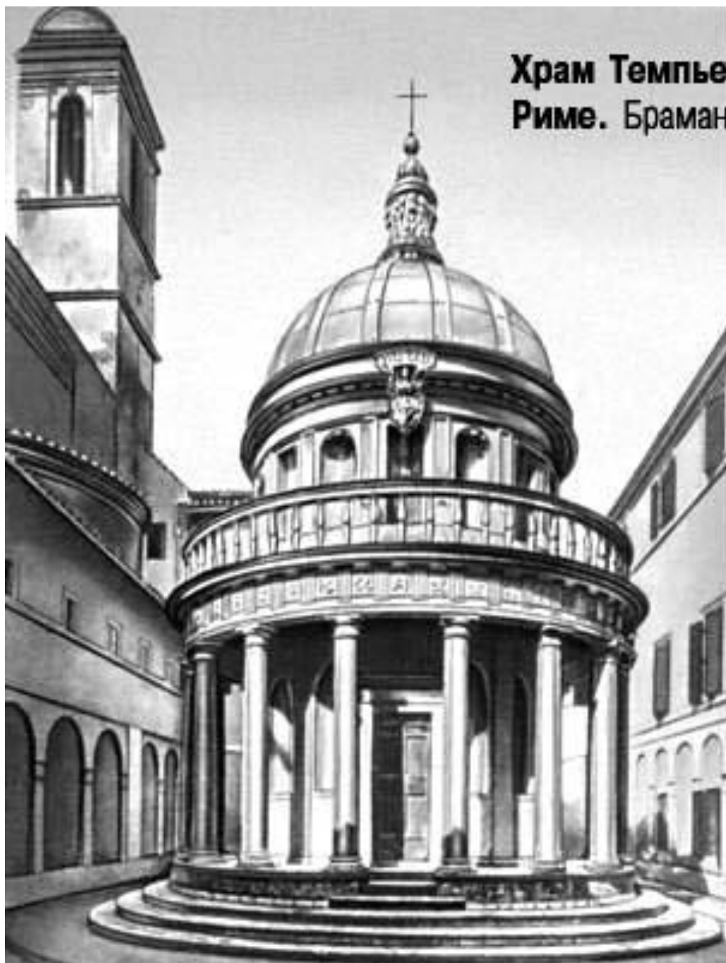
Храм Темплето в Риме. Браманте. 1502 г.