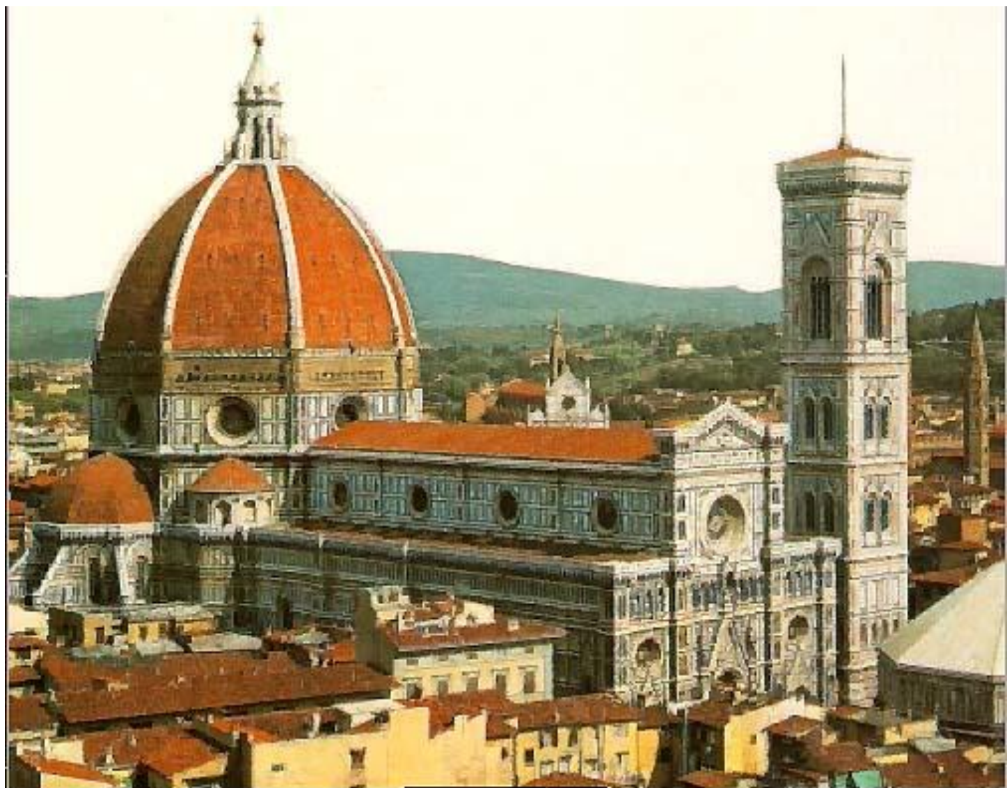
Собор Санта-Мария дель Фьоре. Строительство начато в 1296 г. Архитектор Арнольфо ди Камбио; купол собора - Филиппо Брунеллески (1420-1436 гг.)