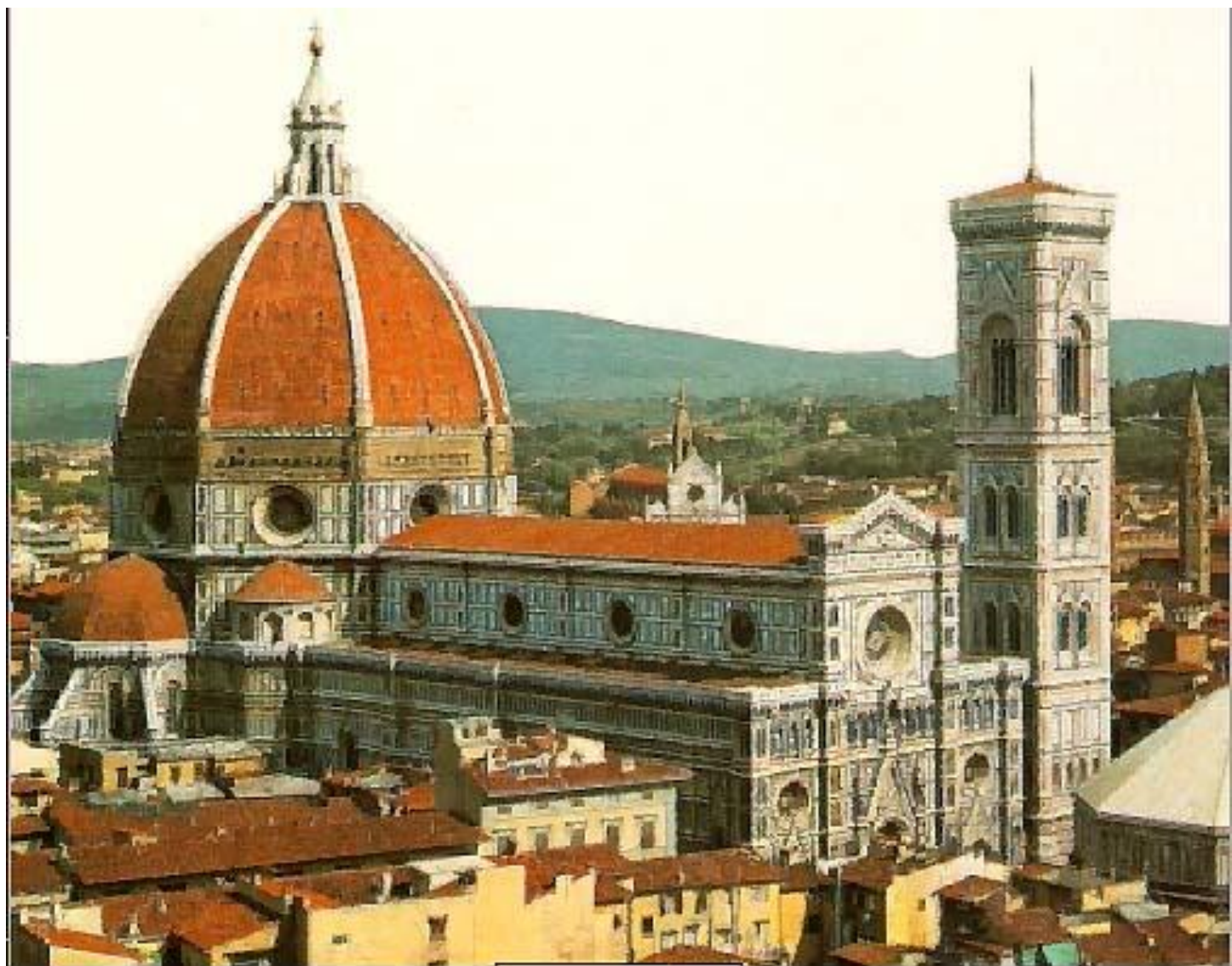
Собор Санта-Мария дель Фьоре. Строительство начато в 1296 г. Архитектор Арнольфо ди Камбио; купол собора - Филиппо Брунеллески (1420-1436 гг.)