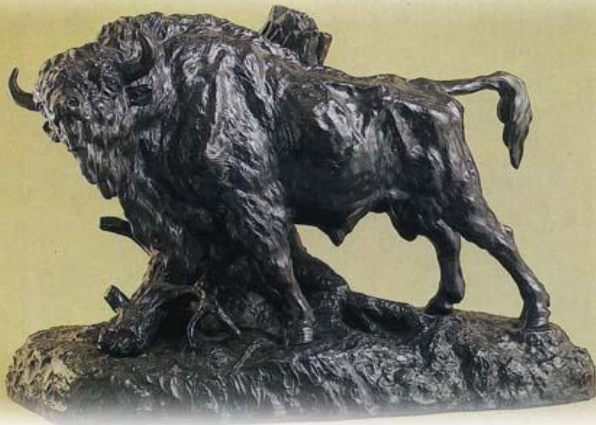
Скульптор Р. Бах "Зубр." ( 1908 г.)