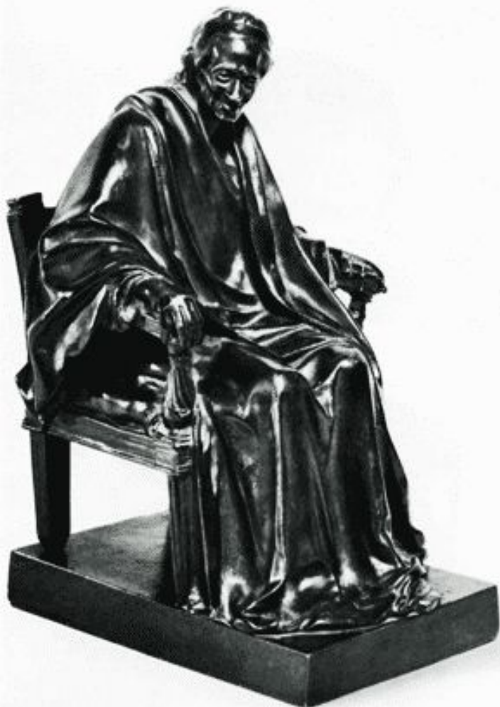
Ж.Гудон "Вольтер" (1905 г.)