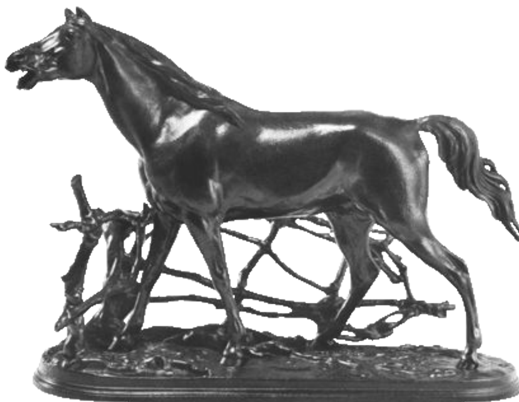
Лошадь у изгороди. По модели П. Клодта, Каслинский завод. Чугун, литье.