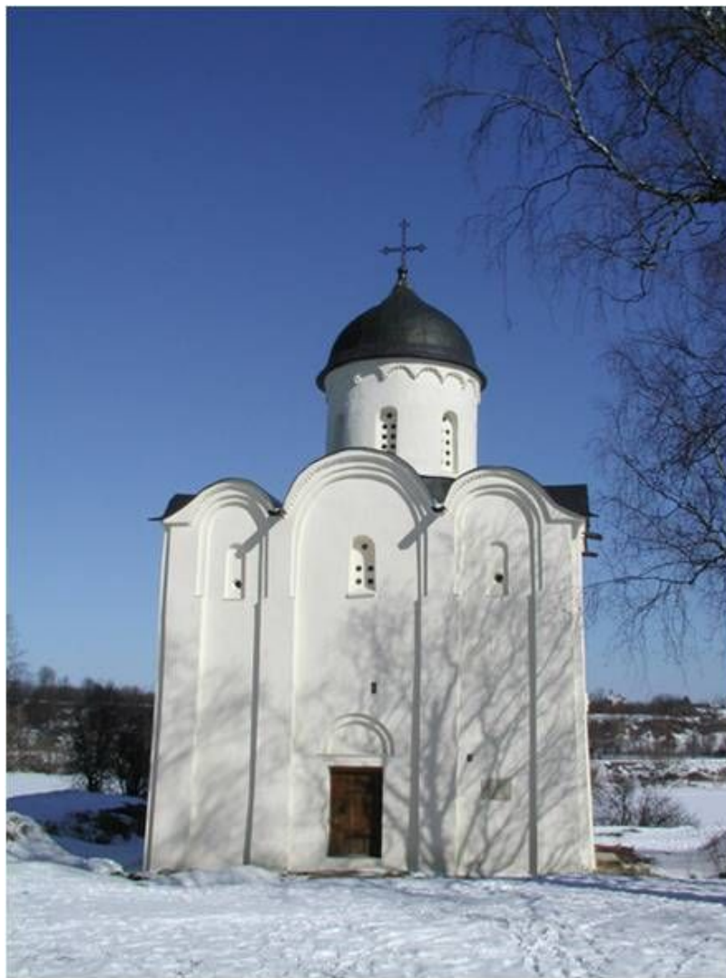
Георгиевская церковь в Старой Ладоге . 1165. Западный фасад. Форма купола – шлемовидная