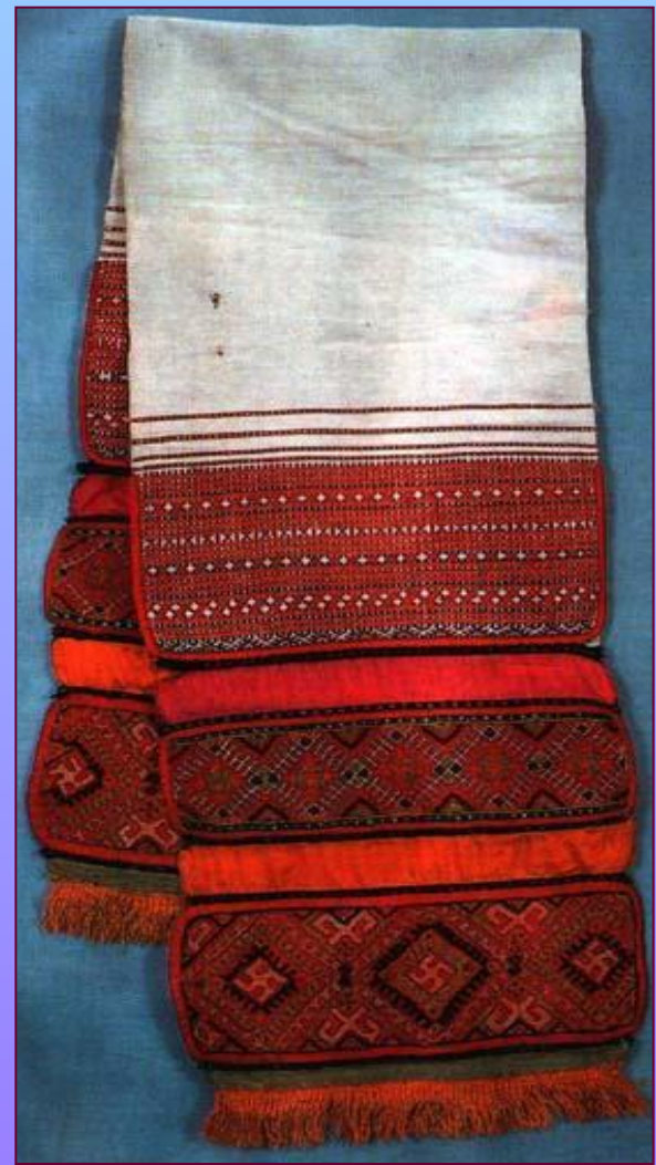
Полотенце. XIX в. Калужская губерния. Жиздринский уезд, Плохинская вол., д. Никитское