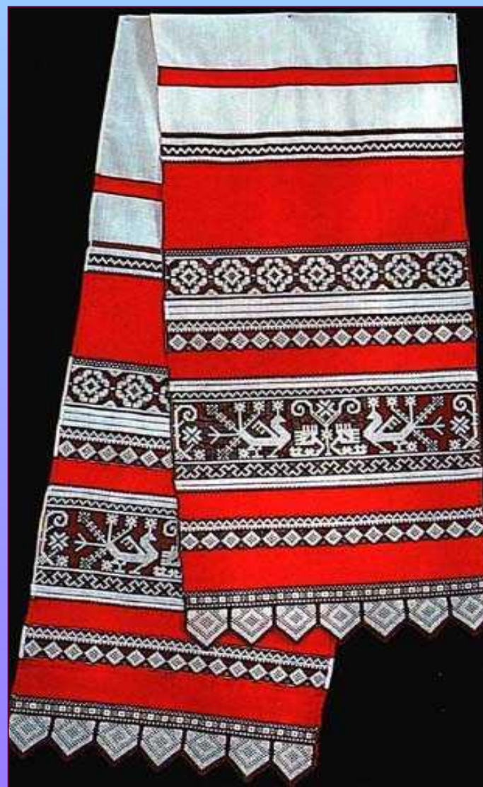
Полотенце. 1971 г. Калужская фабрика художественной вышивки.