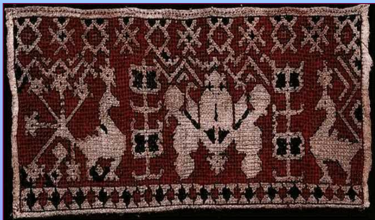
Конец полотенца. XIX в. Калужская губерния.