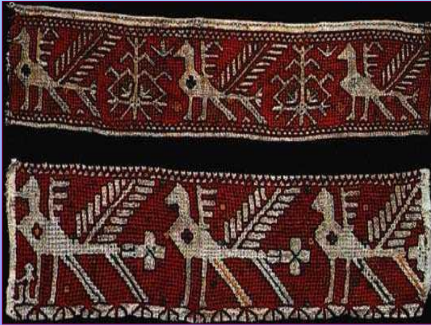
Конец полотенца. XIX в. Калужская губерния. Перемышльский уезд, Андреевская вол., с. Корекозово.