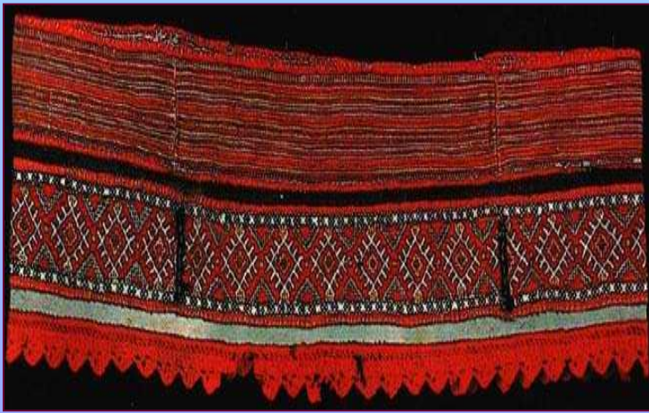
Деталь подола рубахи. Кон. XIX в. Калужская губерния. Козельский уезд, с. Волосово-Дудино.