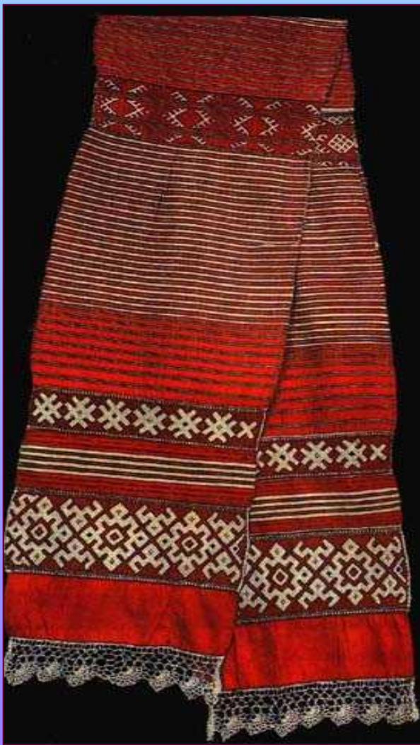
Полотенце. XIX в. Калужская губерния. Калужский уезд, Покровская вол., д. Квань