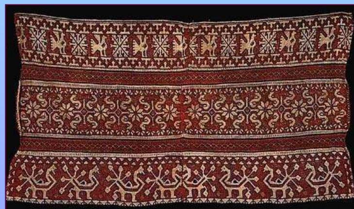
Деталь передника. Сер. XIX в. Калужская губерния. Перемышльский уезд, Андреевская вол., с. Ромоданово.