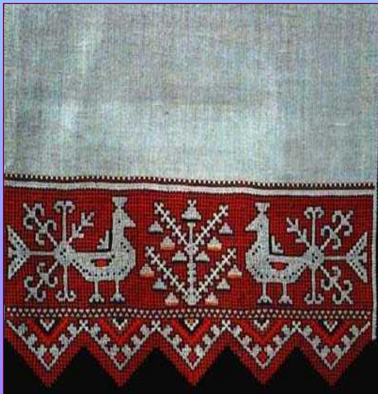
Деталь полотенца. 1975 г. Тарусская фабрика художественной вышивки.