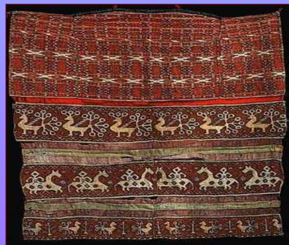
Передник. Сер. XIX в. Калужская губерния. Перемышльский уезд.