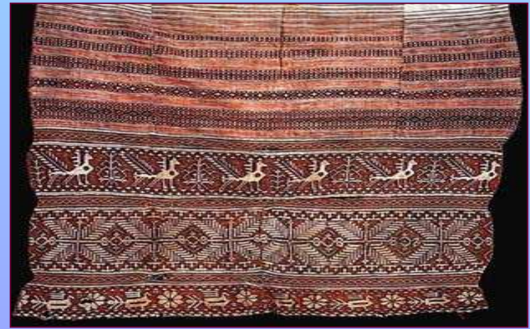
Передник. Сер. XIX в. Калужская губерния. Козельский уезд, с. Волосово-Дудино.