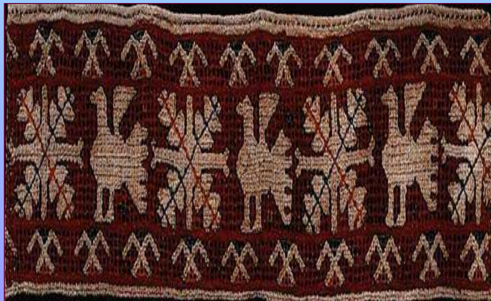
Конец полотенца. XIX в. Калужская губерния. Перемышльский уезд, Андреевская вол., с. Корекозово