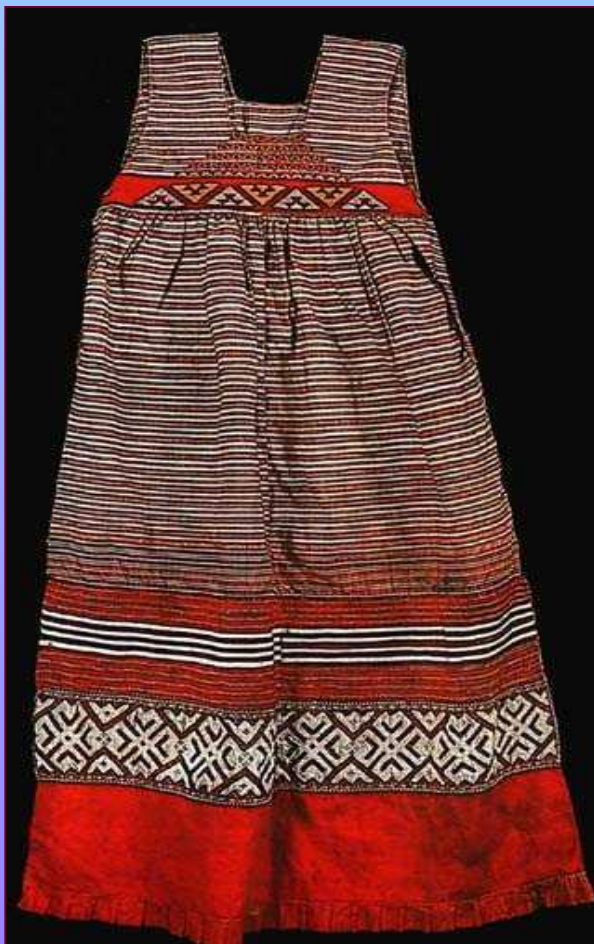
Передник. Кон. XIX в. Калужская губерния. Перемышльский уезд, Андреевская вол., д. Животинки.