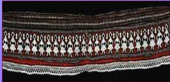
Деталь подола рубахи. Нач. XX в. Калужская губерния. Жиздринский уезд, Лосинская вол., с. Бережки.