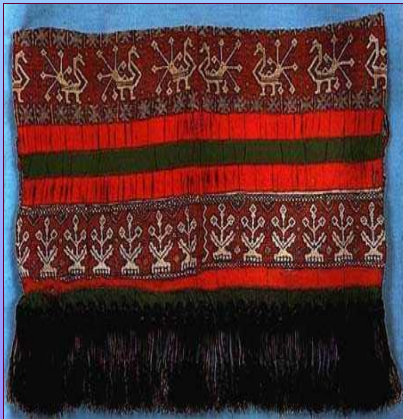
Деталь передника. Сер. XIX в. Калужская губерния. Перемышльский уезд, Пятницкая вол., с. Варваренки.