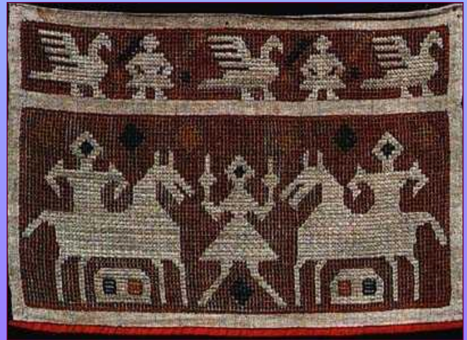
Конец полотенца. Нач. XX в. Калужская губерния. Тарусский уезд.