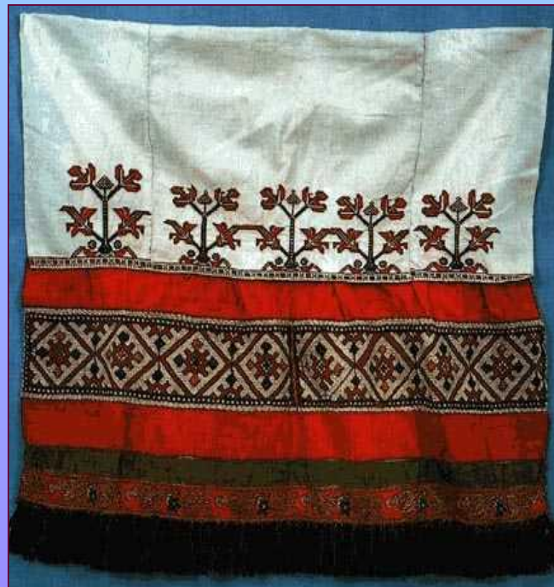
Деталь передника. Нач. XX в. Калужская губерния. Мосальский уезд, Милотичская вол., д. Труфаново.