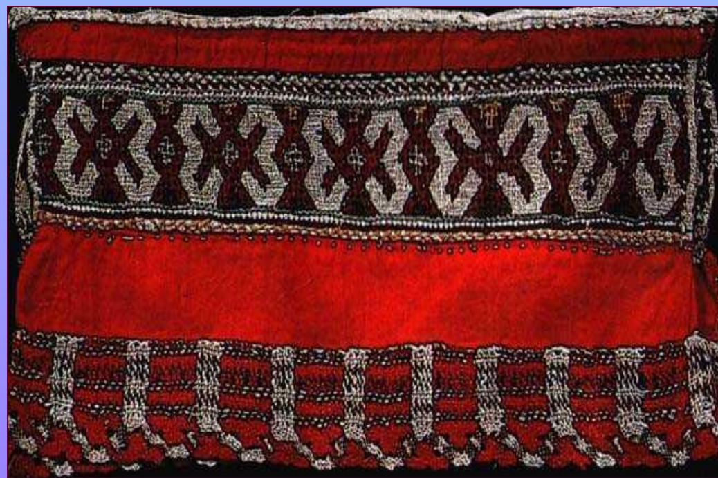
Конец полотенца. Нач. XX в. Калужская губерния. Калужский уезд, "Гамаюнщина".