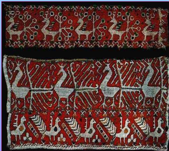
Концы полотенца. XIX в. Калужская губерния. Калужский уезд, «Гамаюнщина»