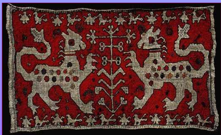
Конец полотенца. XIX в. Калужская губерния. Перемышльский уезд, Андреевская вол., д. Горки.