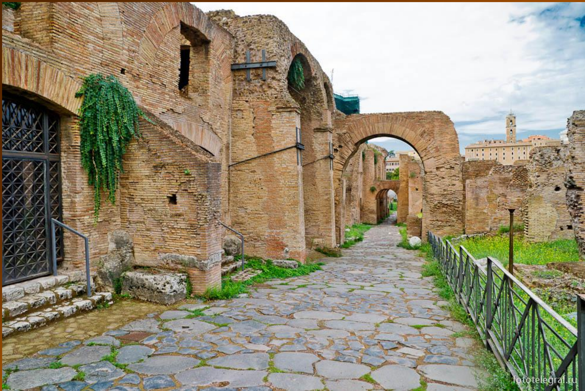
Строения Форума на склоне Палатина. По преданию, на Палатинском холме возник древний Рим.