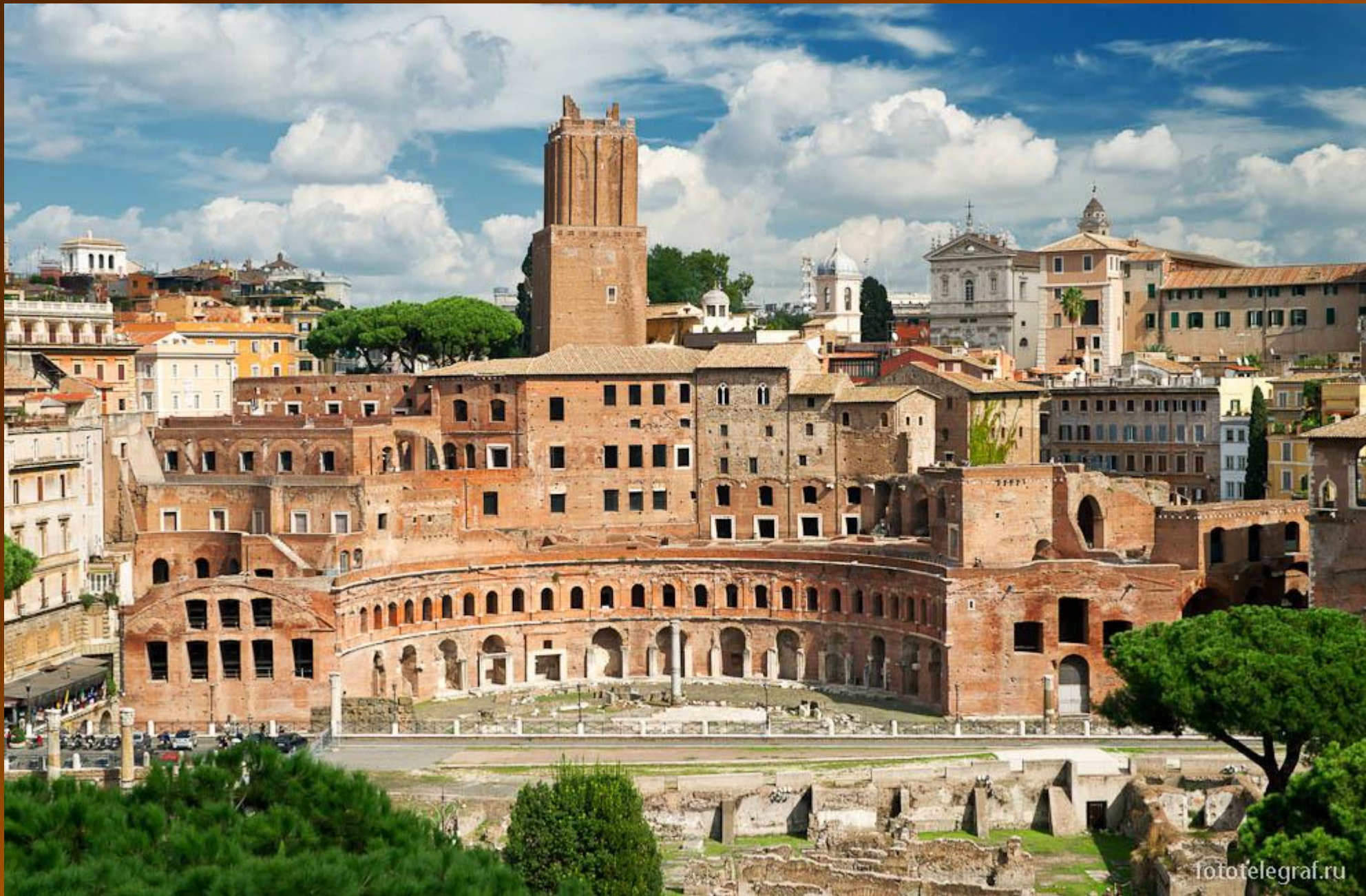
Рынок Траяна на его форуме.