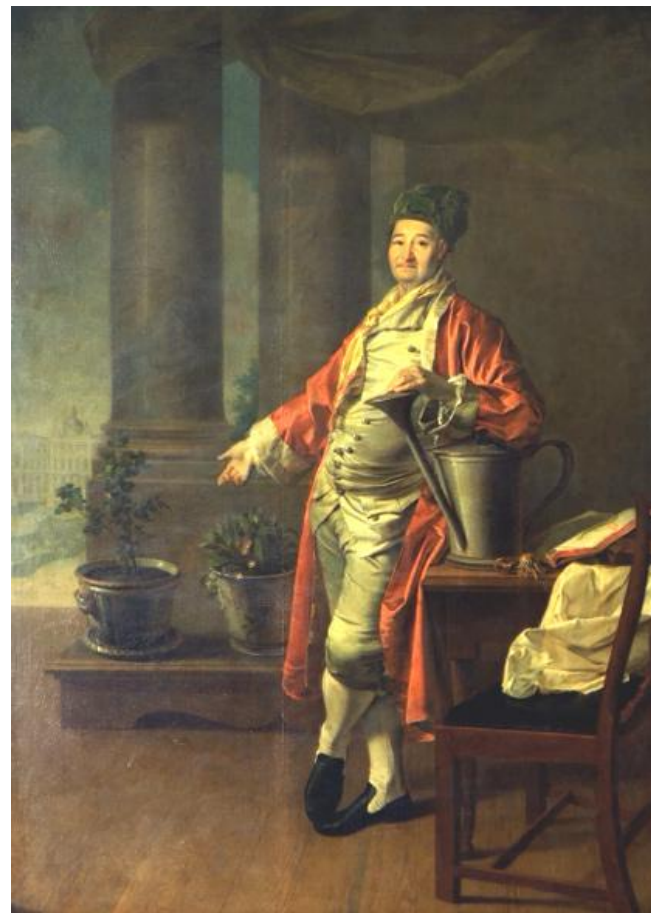
Портрет П.А.Демидова. 1773 г.