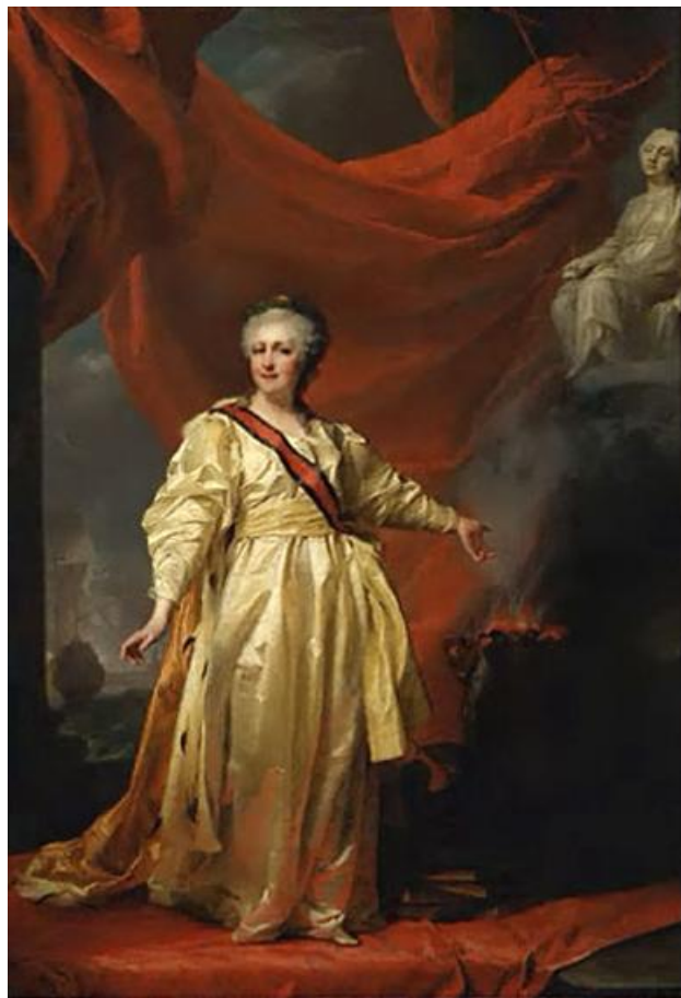
Портрет Екатерины II. 1783 г.

Определите, к какому типу относятся эти портреты кисти Дмитрия Григорьевича Левицкого (1735-1822). Имеют ли скрытый смысл предметы интерьера?