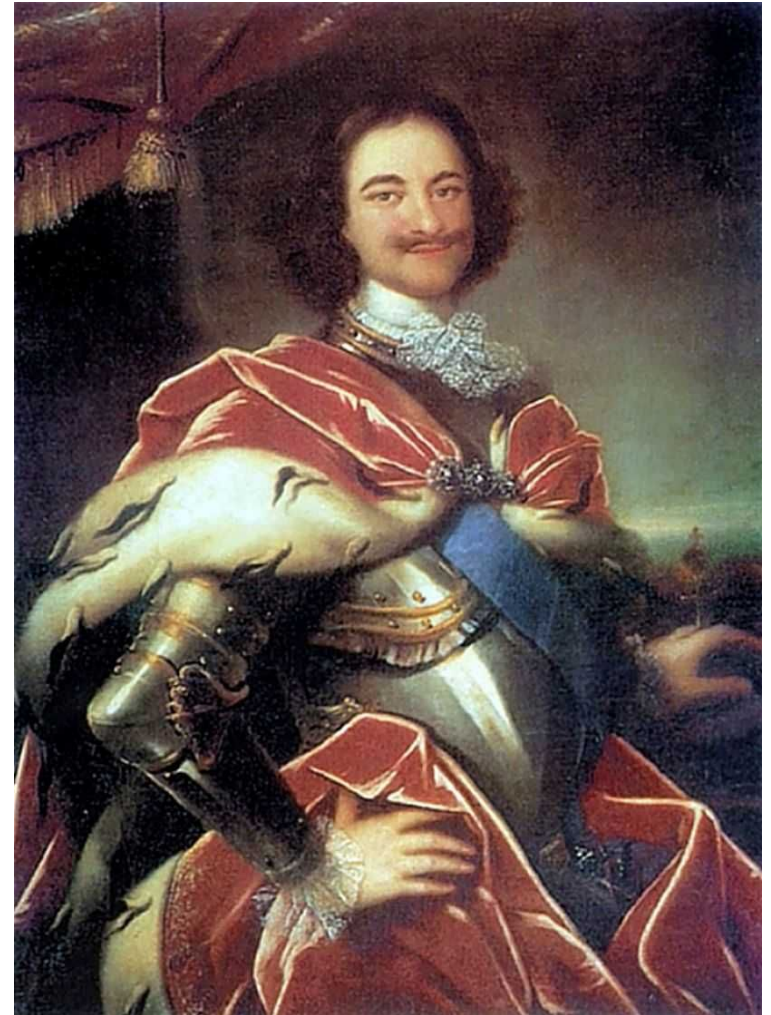
«Портрет Петра I»

Вместо парсуны получает широкое распространение портрет.