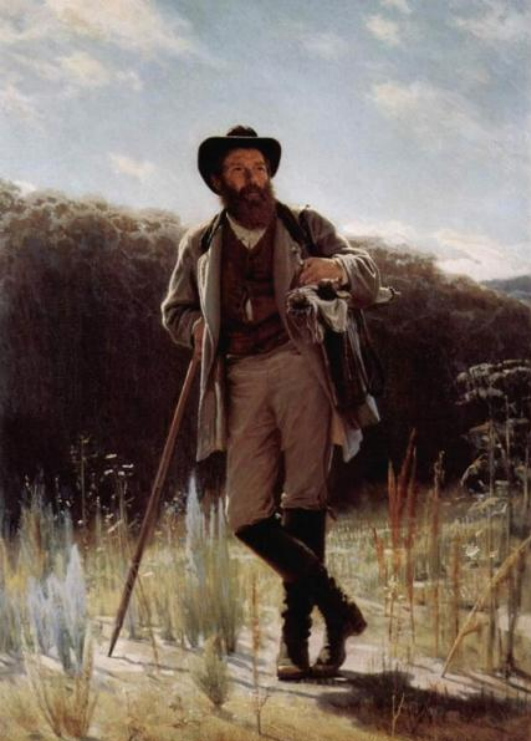
И.Крамской. Портрет И.И. Шишкина