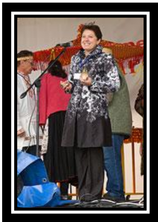
«Праздник со светлой пасхой»