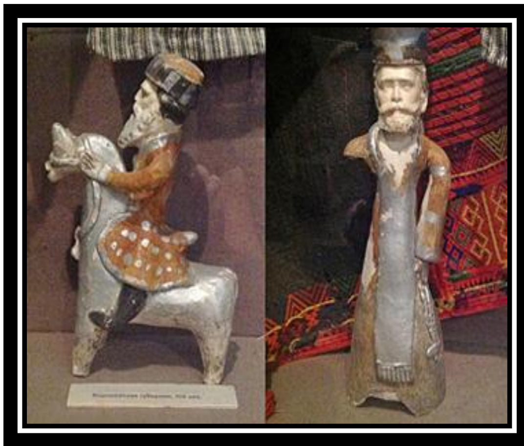
Глиняные игрушки Воронежской области дореволюционного времени. Краеведческий музей

Глиняные игрушки в прошлом были широко распространены на территории нынешней Воронежской области.