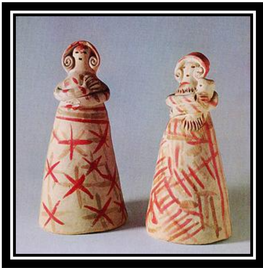
Воронежские барыни. Нач. XX в. Воронежская губеония. Белая глина, роспись Альбом И.Я. Богуславской "Русская глиняная игрушка"

К настоящему времени по всей территории Воронежской области найдены 43 игрушки и их фрагменты.