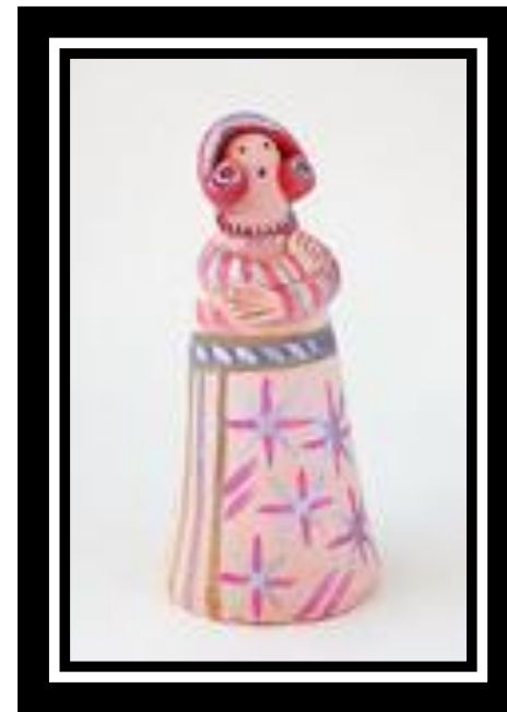
Колокольчик "Воронежская барыня"