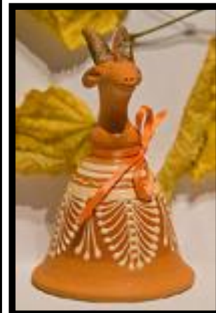
«Коза золотые рожка»