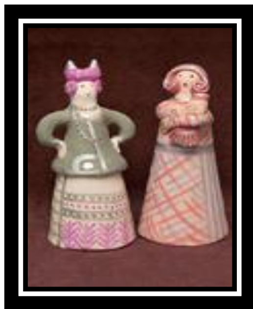
Колокольчики "Воронежские барыни" Коллекция Ю.Чуриловой

Роспись костюма повторяет узор на старинных игрушках нач. XX века.