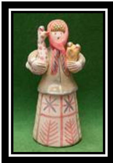
Колокольчик "Барыня с гусем"