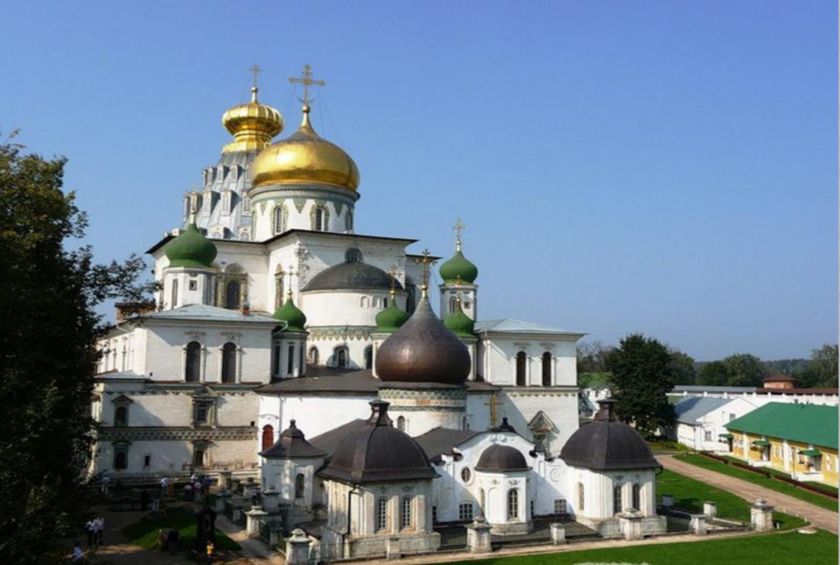
Воскресенский собор Новоиерусалимского монастыря