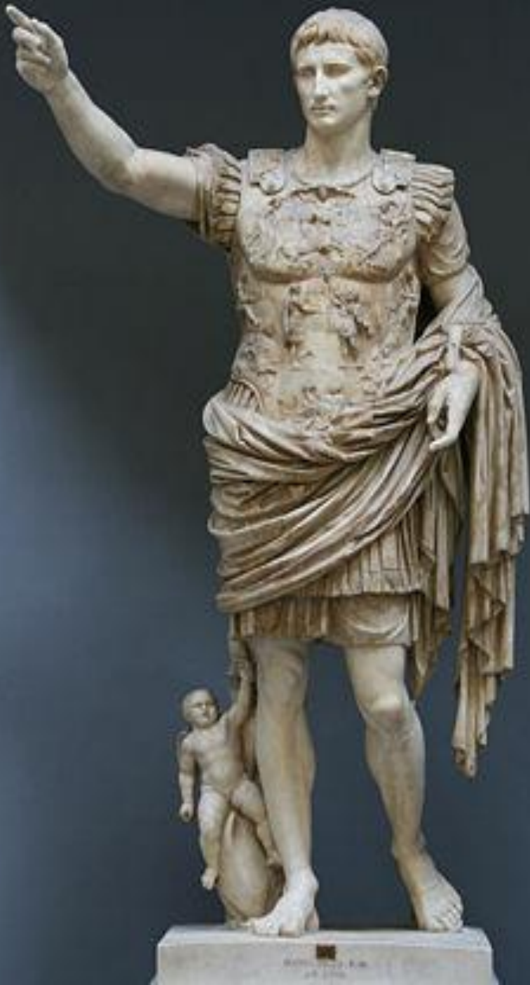
◎ Август из Прима Порто. Римская статуя