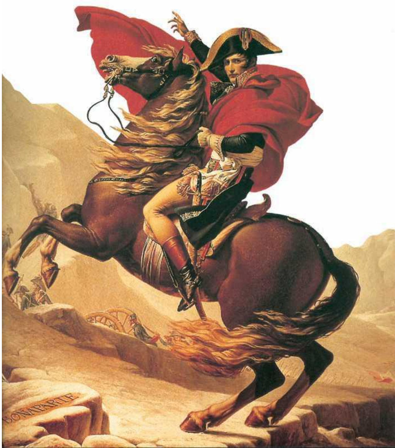
⦿ Давид. "Наполеон при переходе через Сен- Бернар"