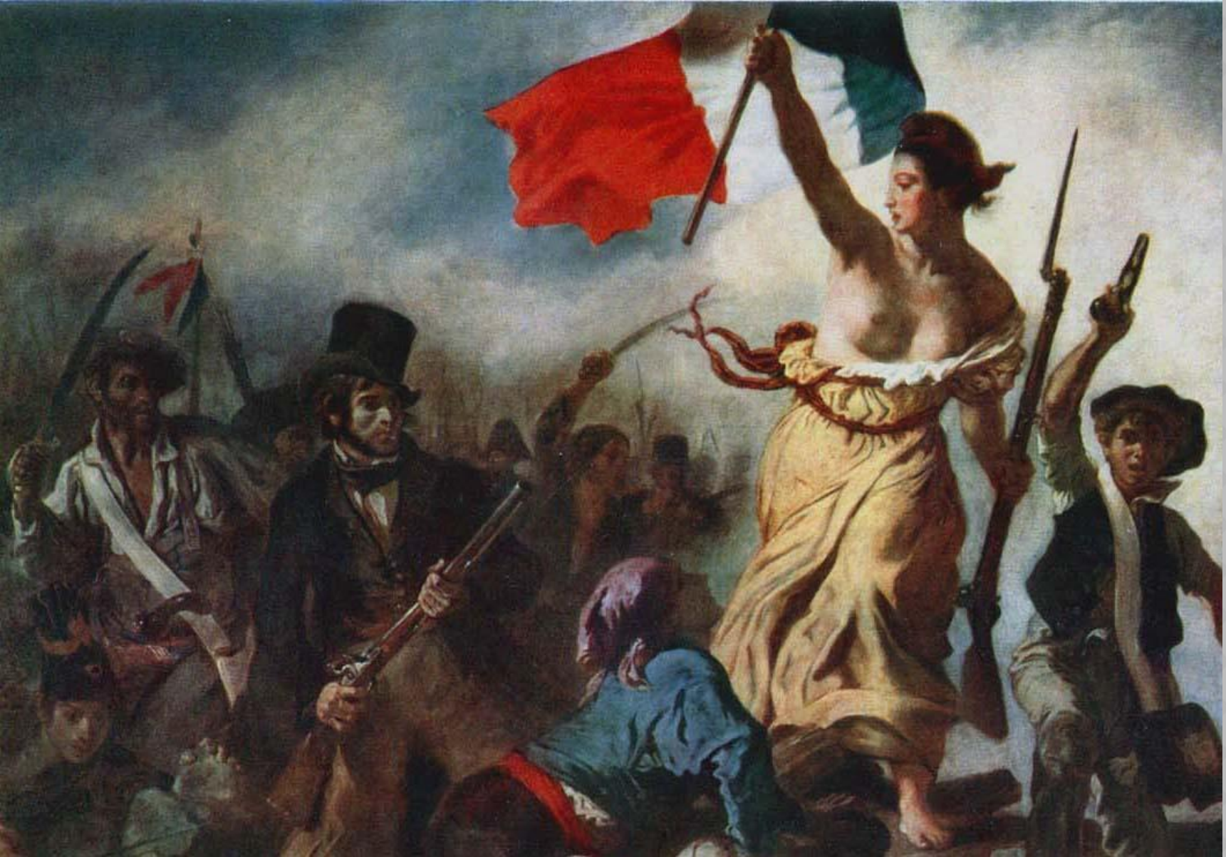
Свобода, ведущая народ на баррикады Э.Делакруа