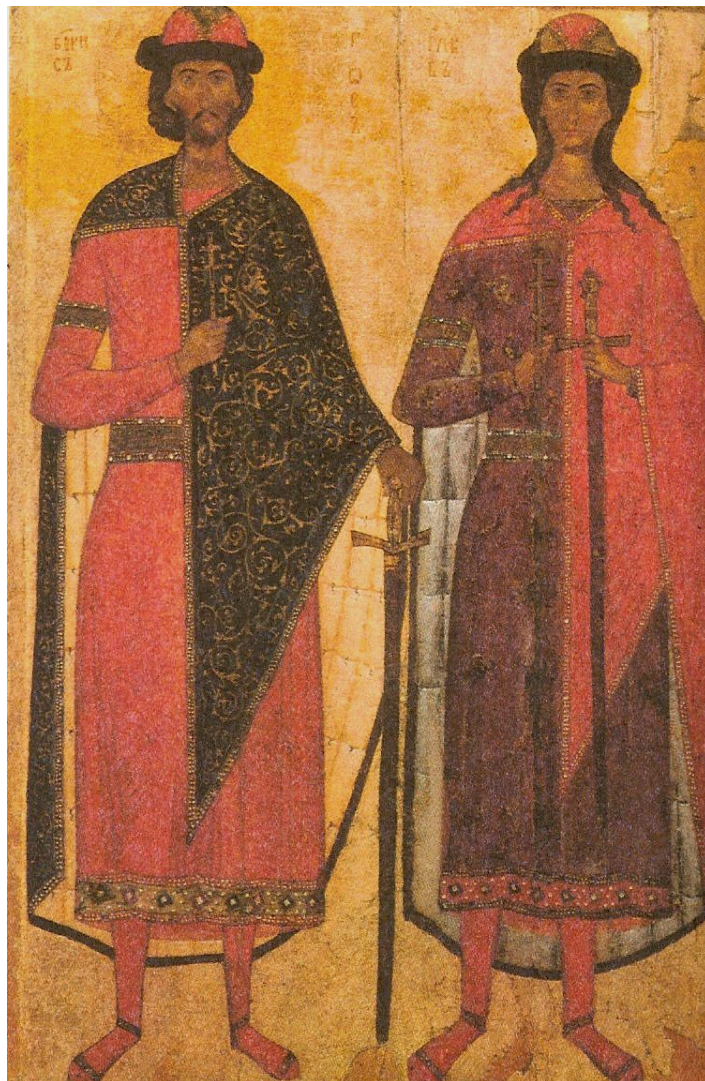
Борис и Глеб