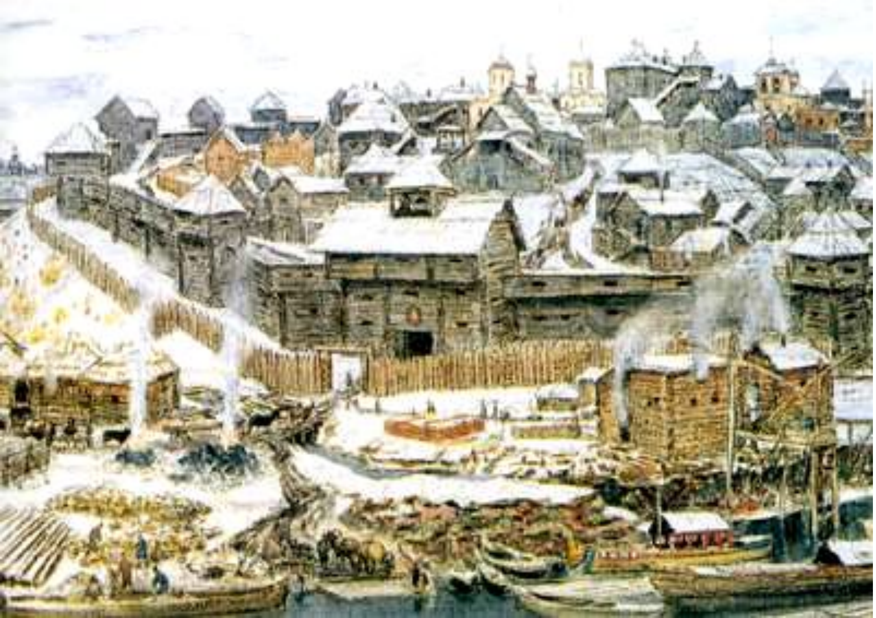
⦿ Московский Кремль при Иване Калите