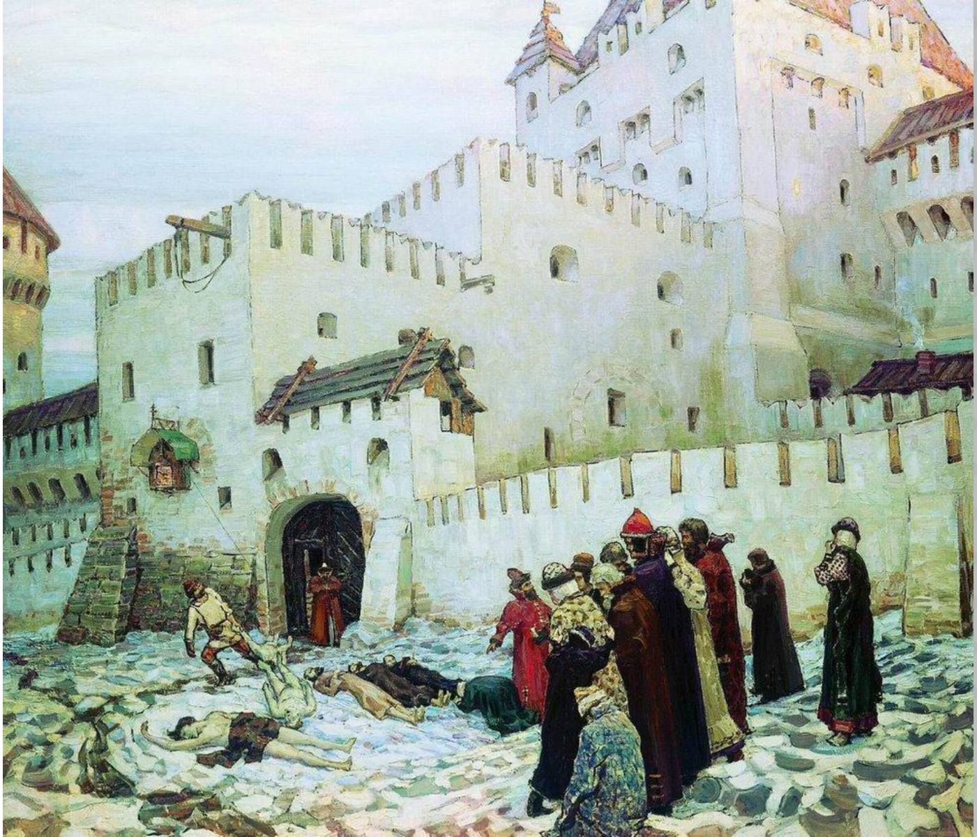
⦿ Московский застенок. Конец XVI века. Васнецов Аполлинарий Михайлович