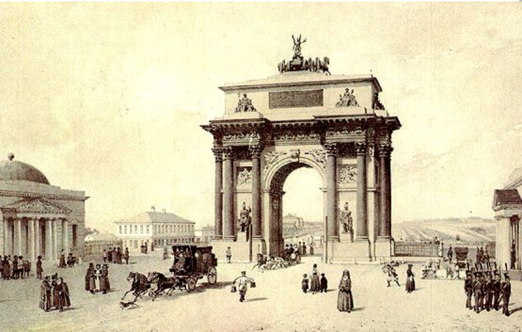
○ Триумфальная арка на Кутузовском проспекте в Москве