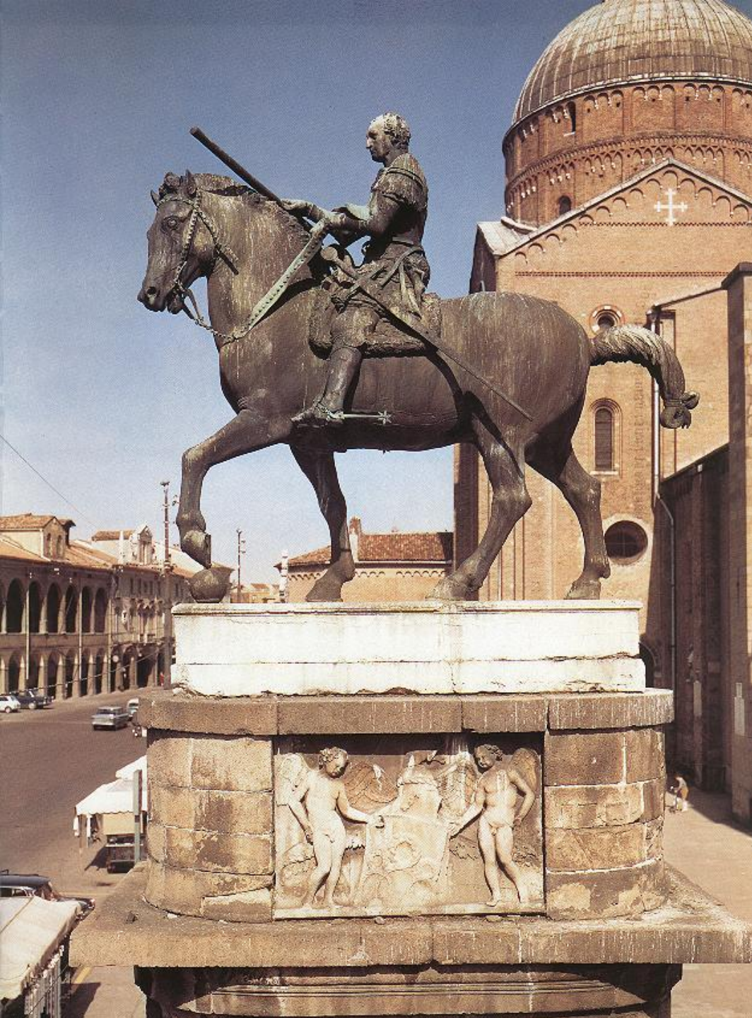
◎ Донателло. Статуя кондотьера Гаттамелаты. Падуа