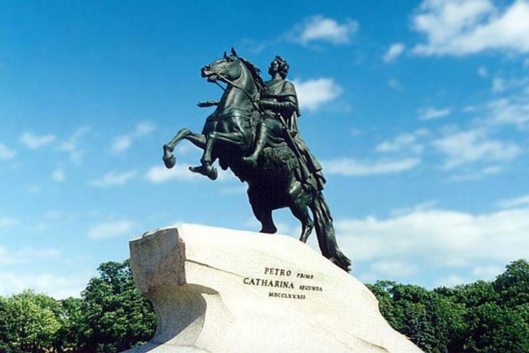
Конная статуя Петра З.Фальконе