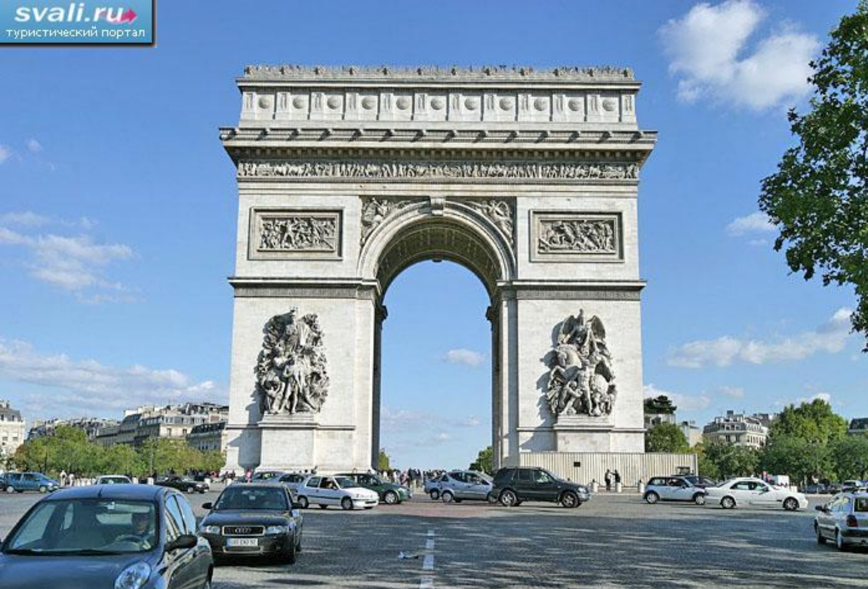
◎ Триумфальная арка на Елисейских полях в Париже