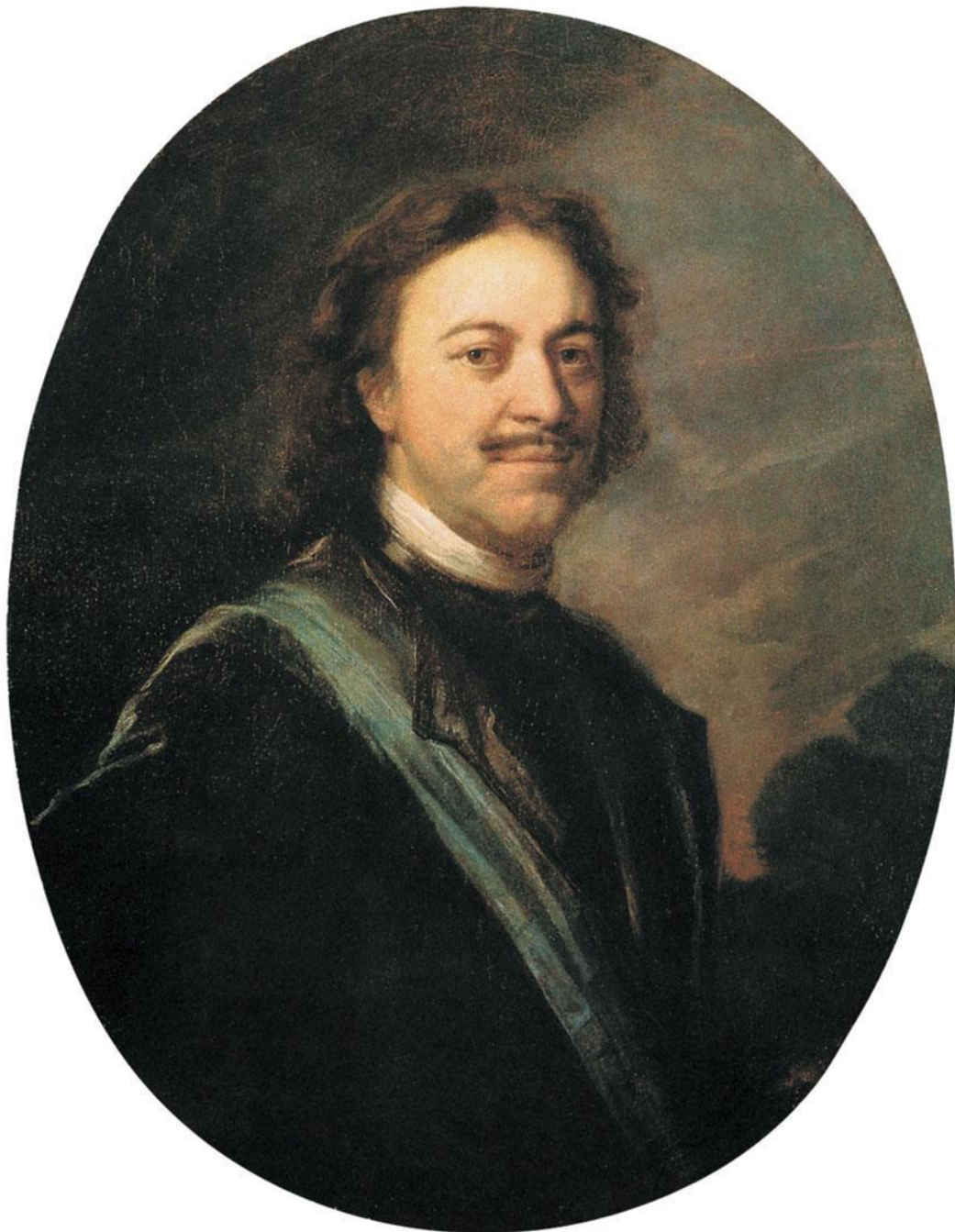
» Портрет Петра I Матвеев А.