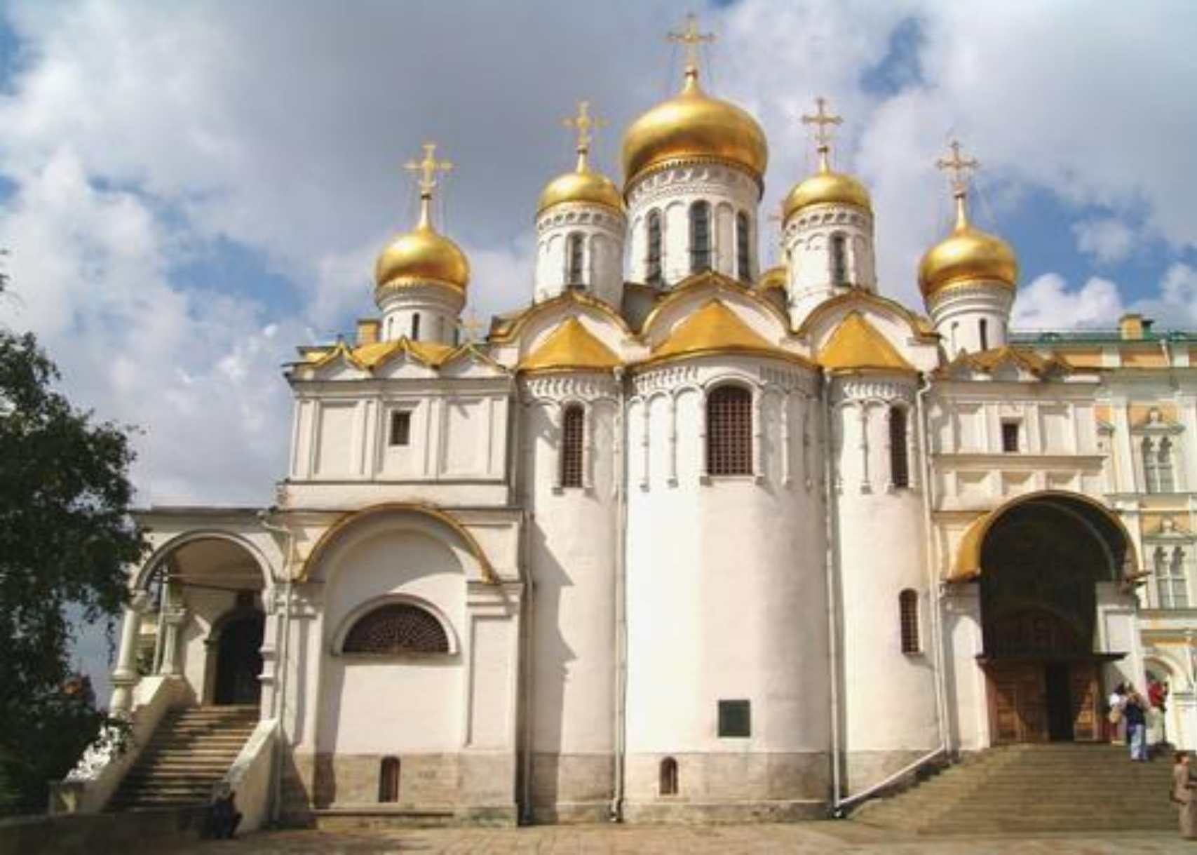
⦿ Благовещенский Собор - царская часовня.