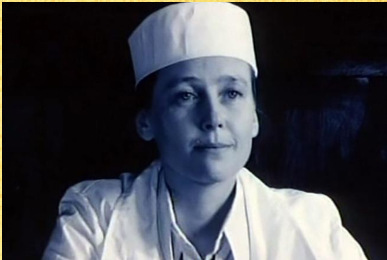
Ия Саввина в фильме «Каждый день доктора Калиниковой»