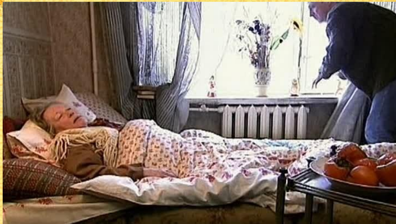
Авангардная драма Кирилла Серебренникова «Постельные сцены»