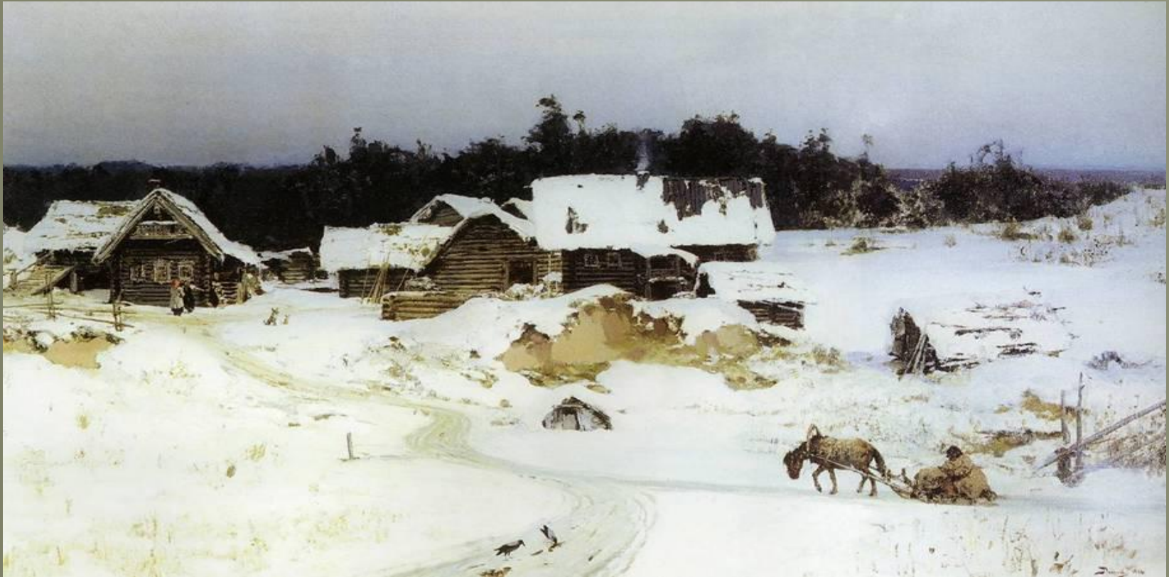
Зима. Имоченцы. 1880