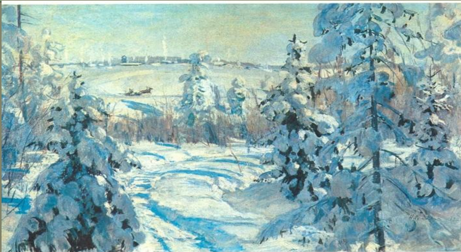
Н. Ромадин. Род. 1903. ЗИМА. Из серии «Времена года». 1952.

Московский государственный университет имени М. В. Ломоносова.