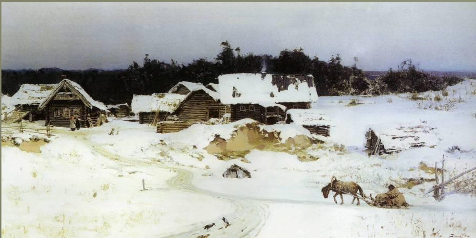
Зима. Имоченцы. 1880