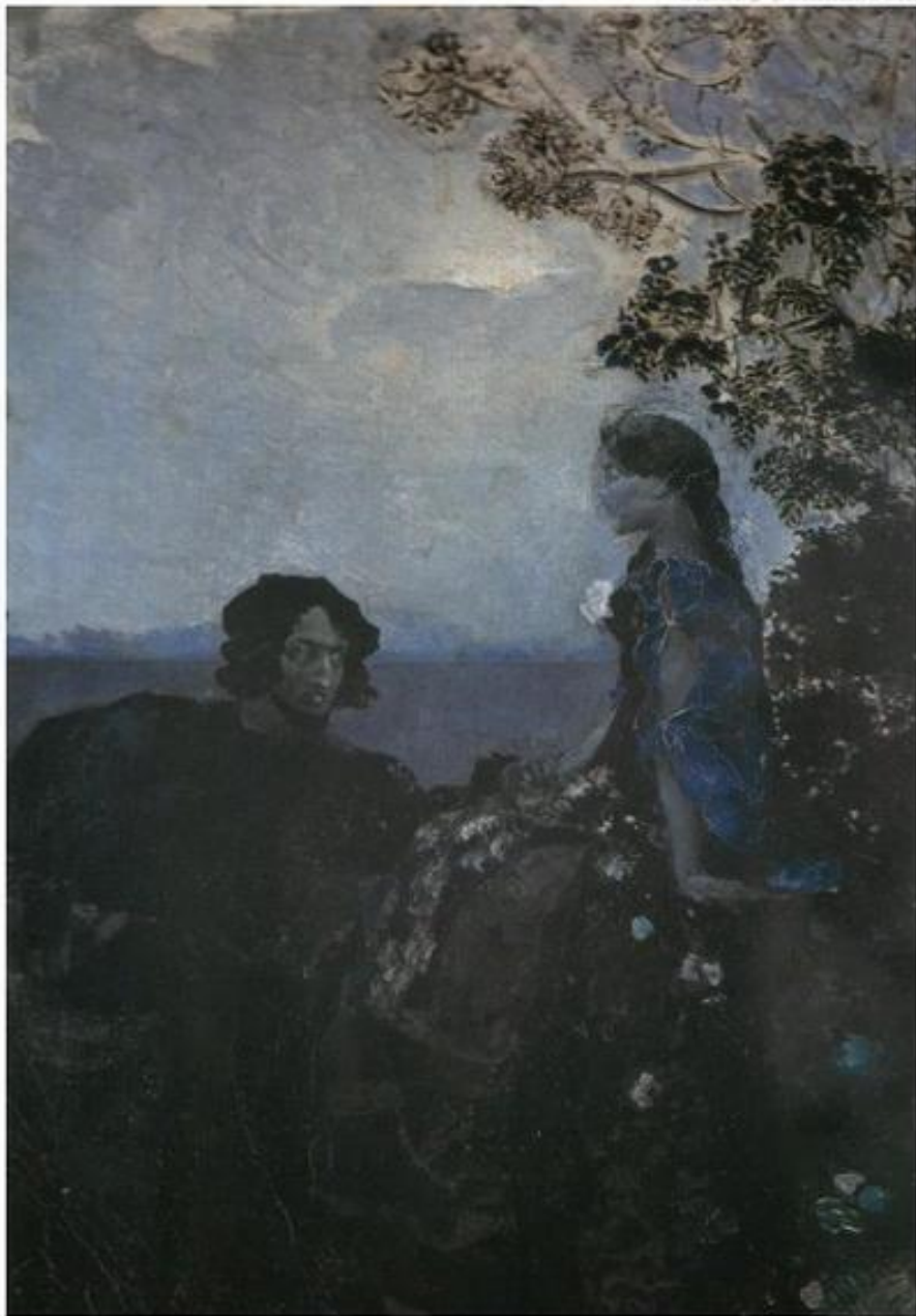
Гамлет и Офелия