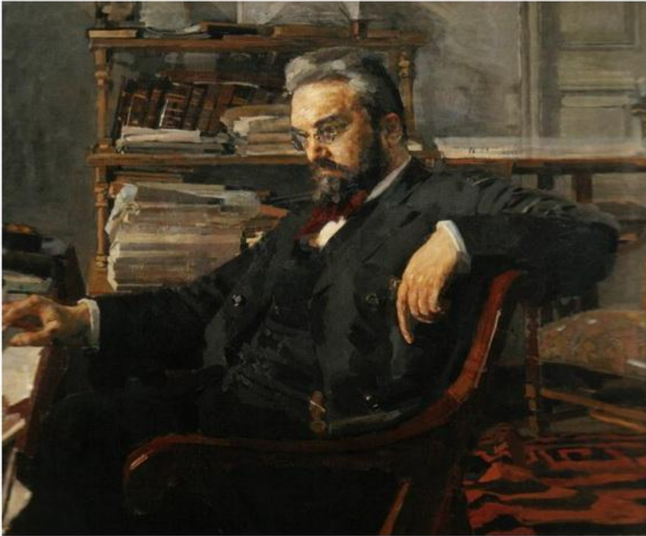
"Портрет К. Д. Арцыбушева