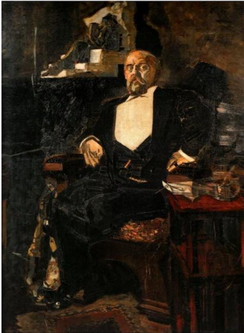
Портрет Саввы Мамонтова (1897)