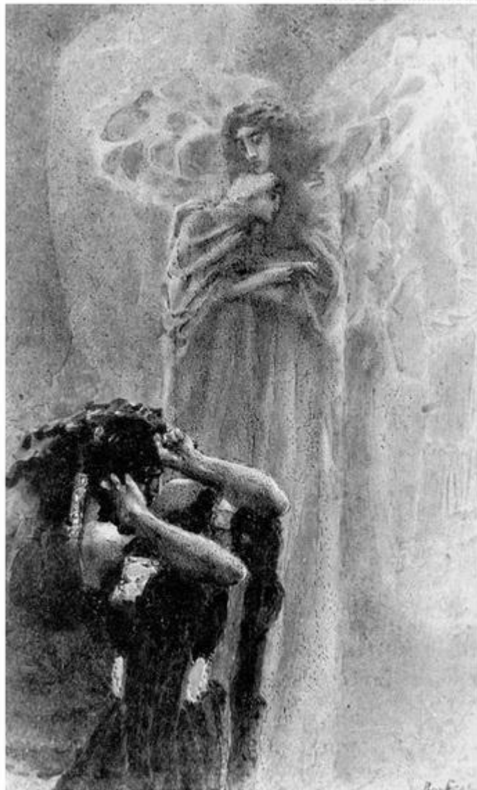
Демон и ангел с душой Тамары