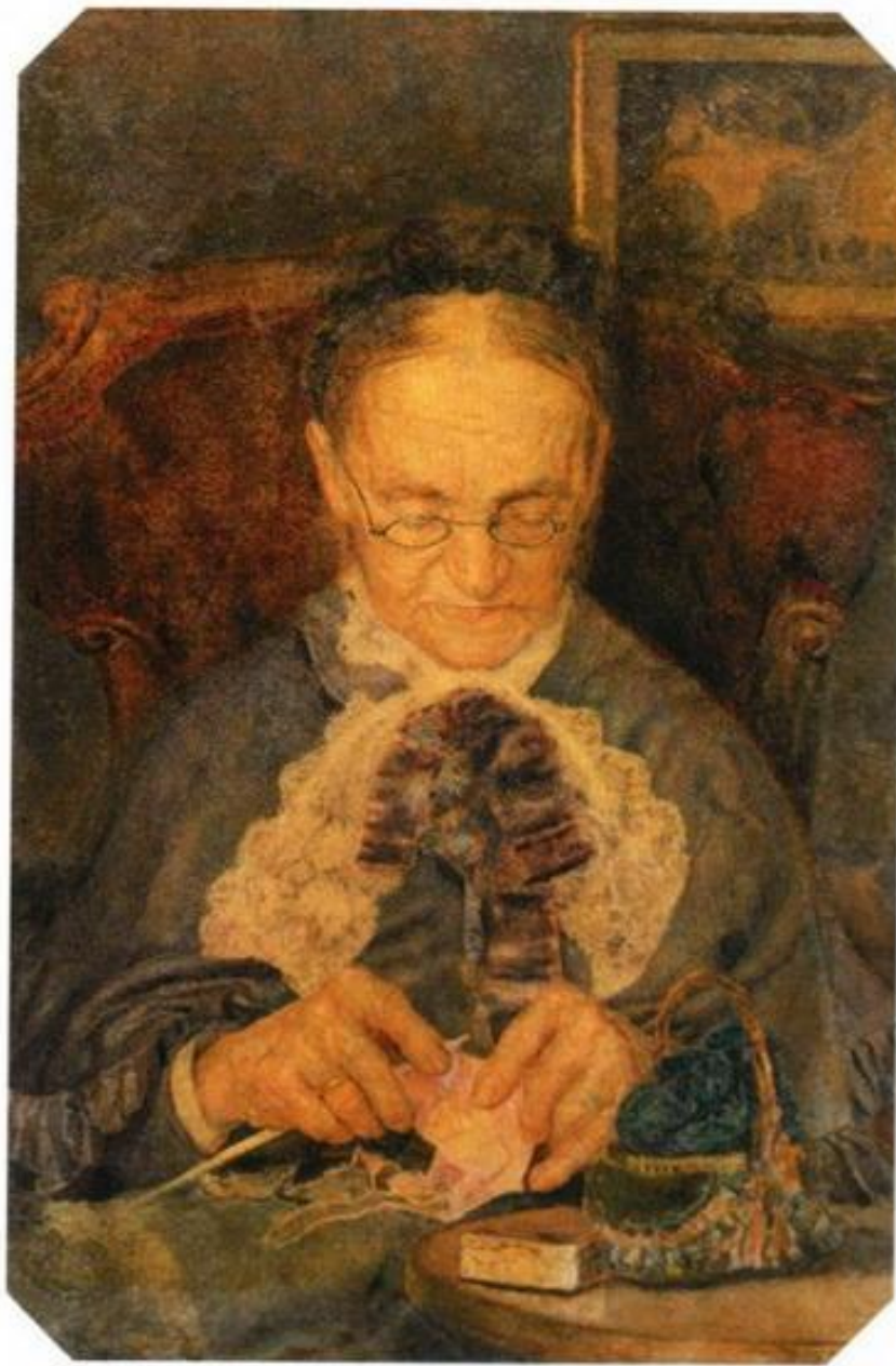
Портрет старушки Кнорре за вязанием