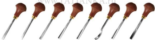
B 8er A