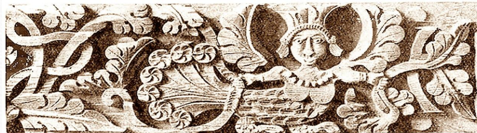
7. Подзоры резные. Детали. Мотивы сирены и птицы-сирин (варианты). Средне-волжский район.