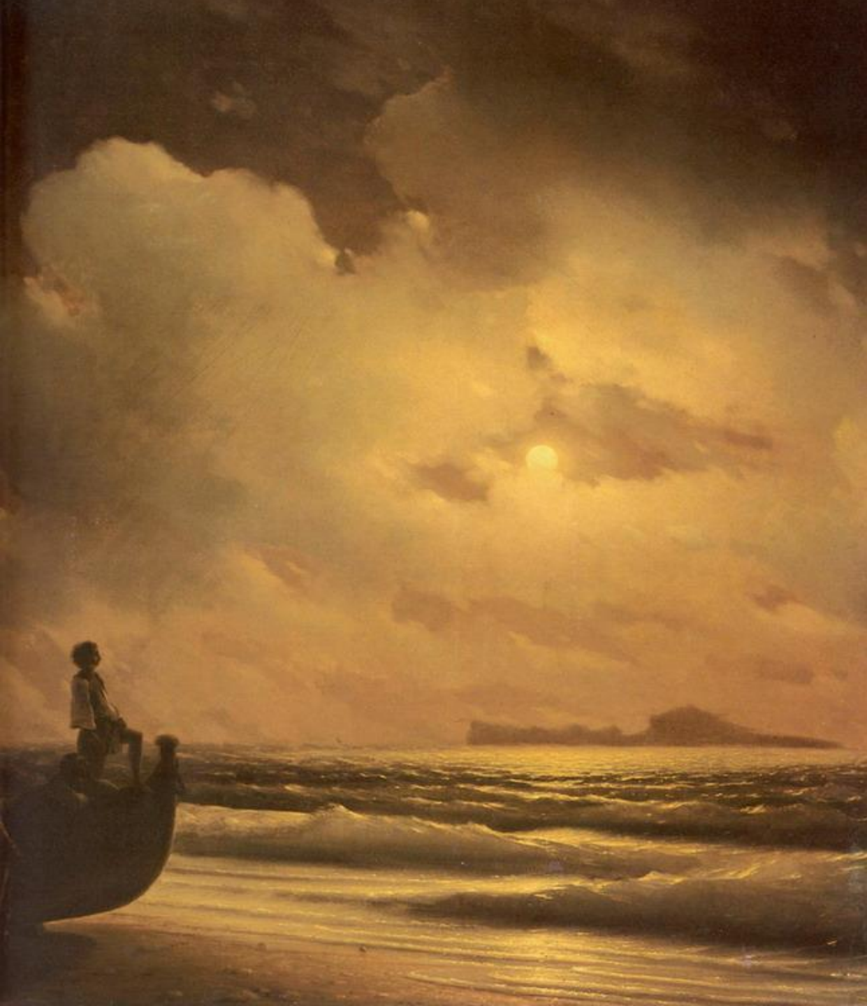
Лунная ночь на Кипре