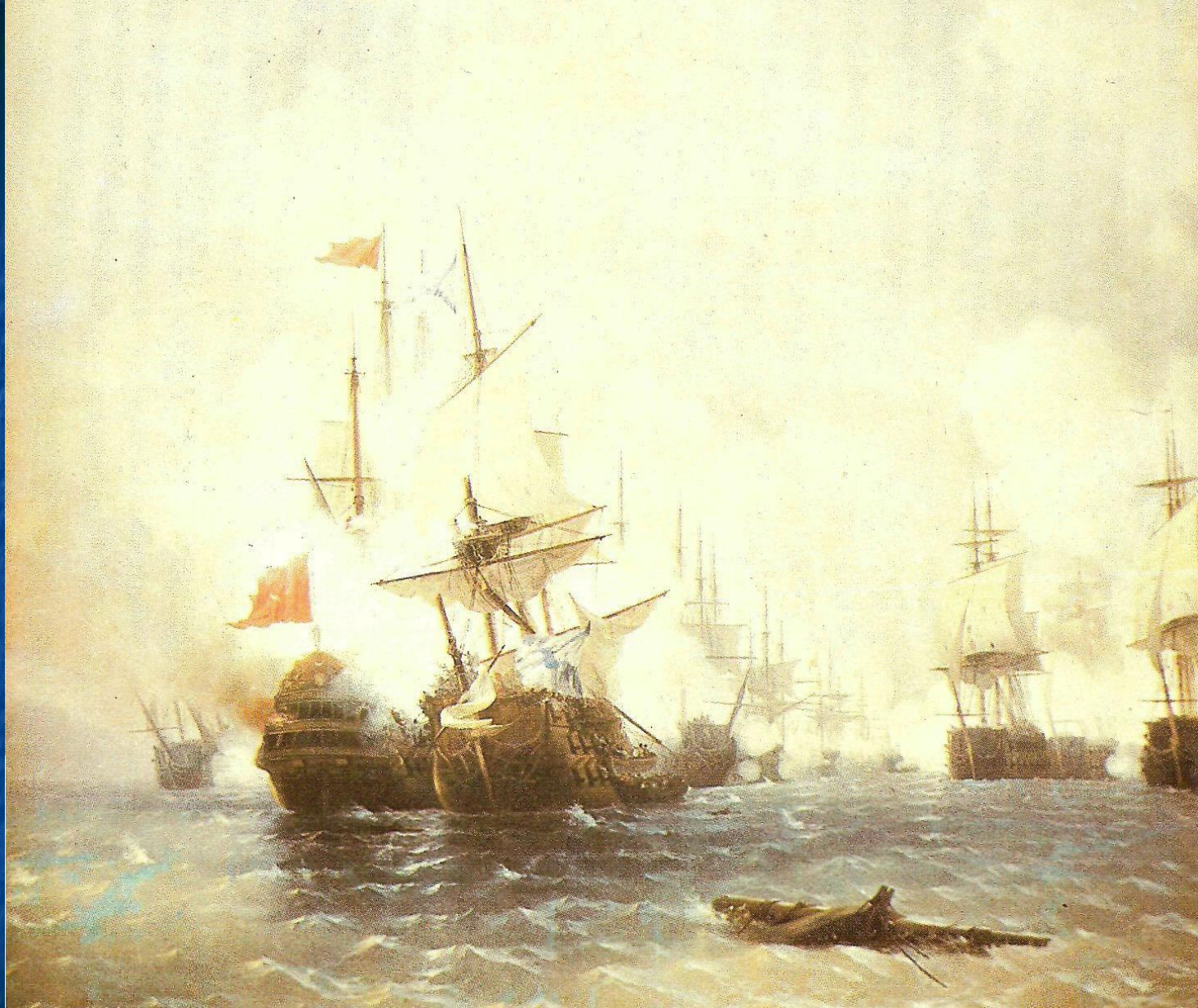
Морськой бой в Хиосском проливе