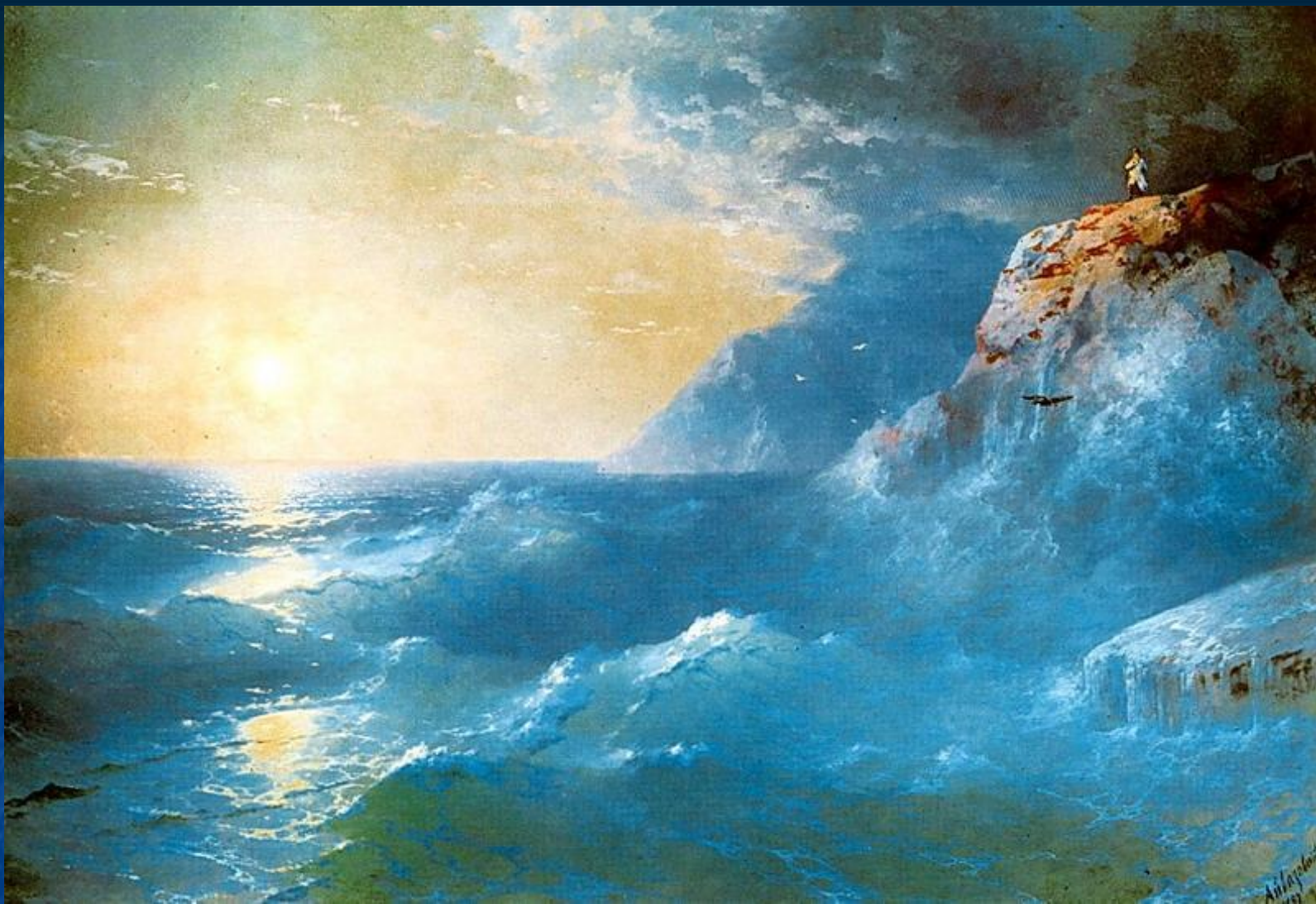
Наполеон на острове св. Елены