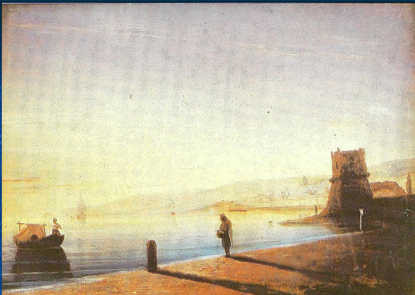
Пристань в Феодосии

Айвазовский пишет марины по памяти и представлению, объясняя это тем, что “Движение живых стихий неуловимы для кисти: писать молнию, порыв ветра, всплеск волны- немислимо с натуры”