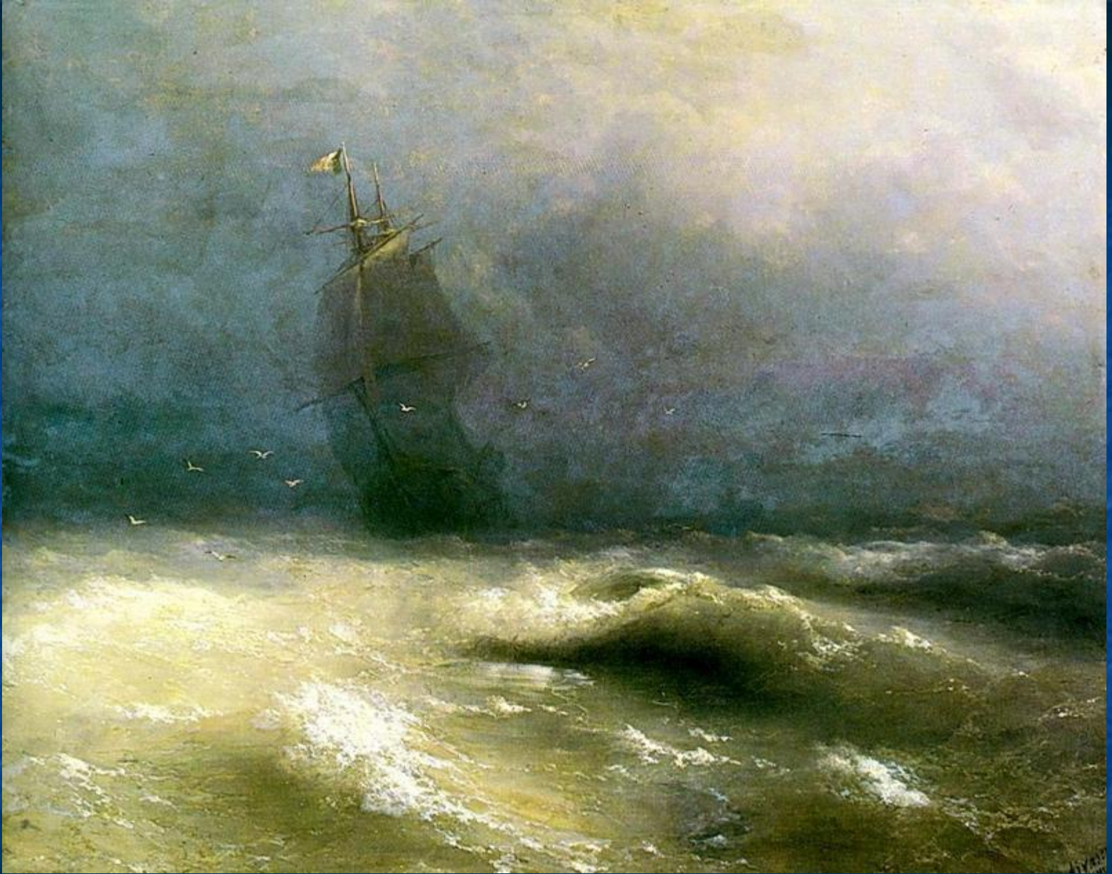
Бура у берегов Ниццы