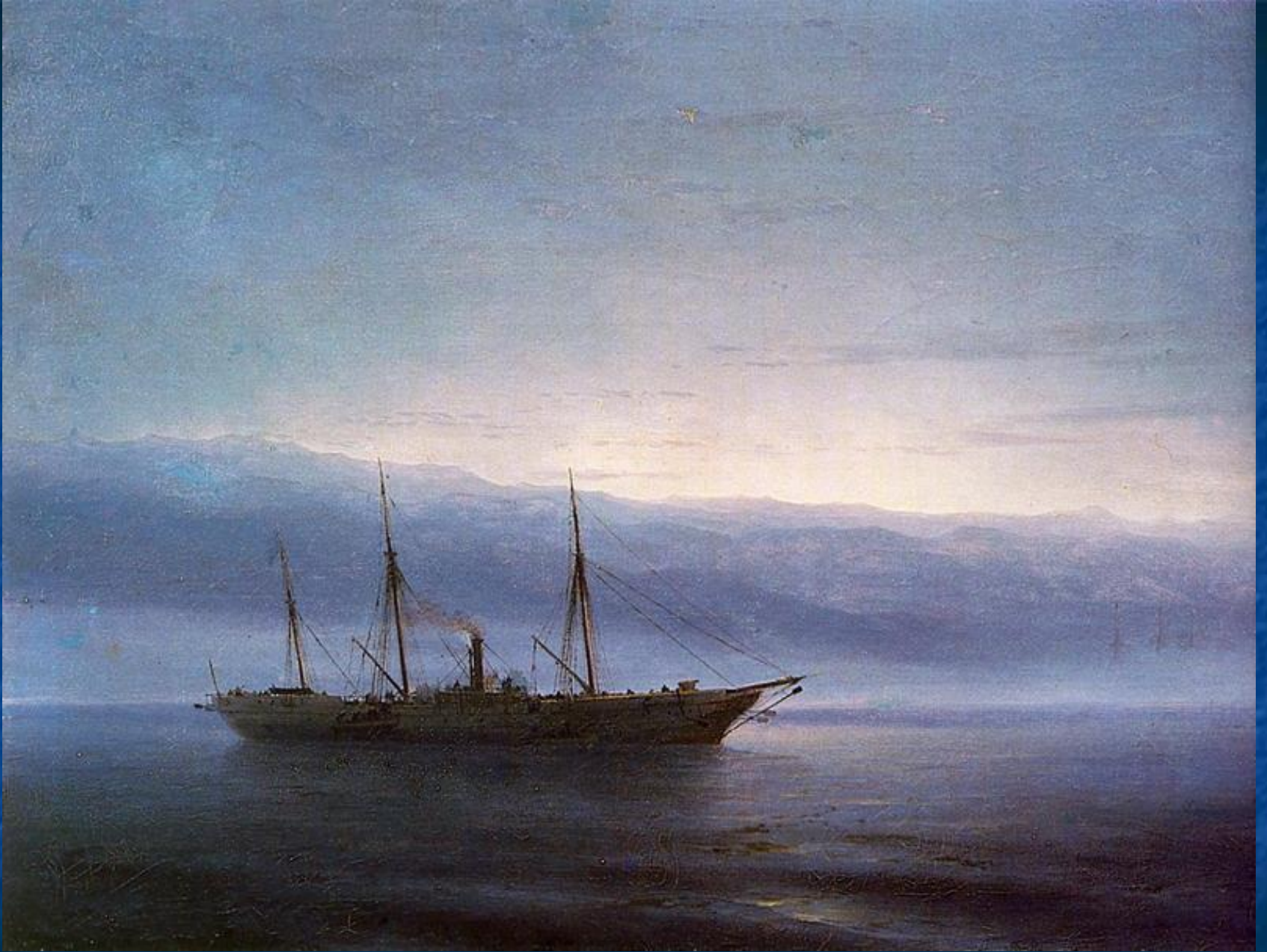
Перед боем. Корабль Константинополь