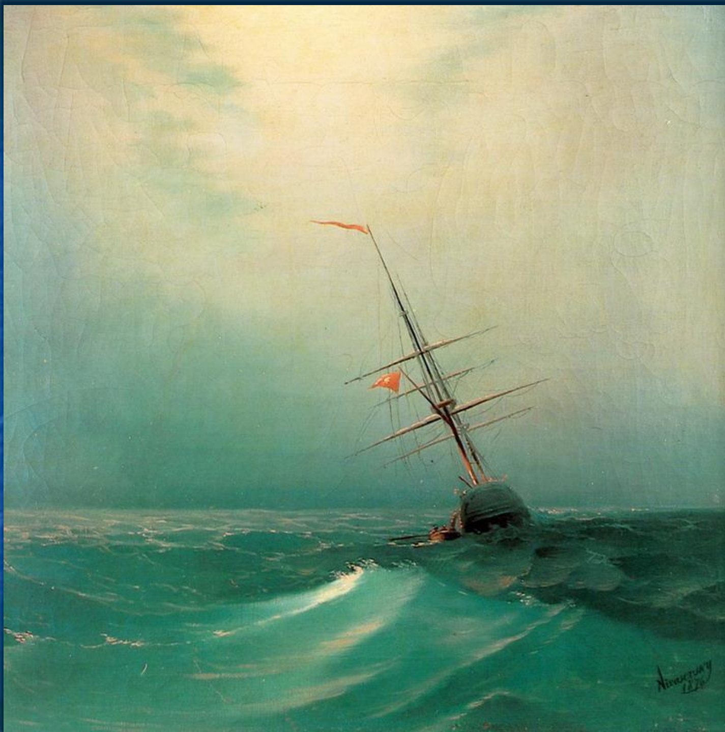
Ночь. Голубая волна