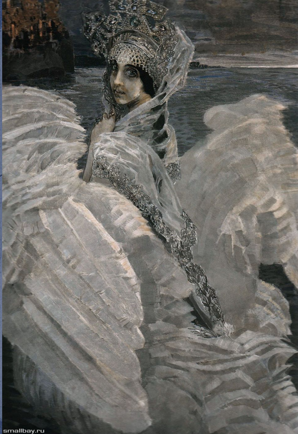
Царевна- Лебедь 1900