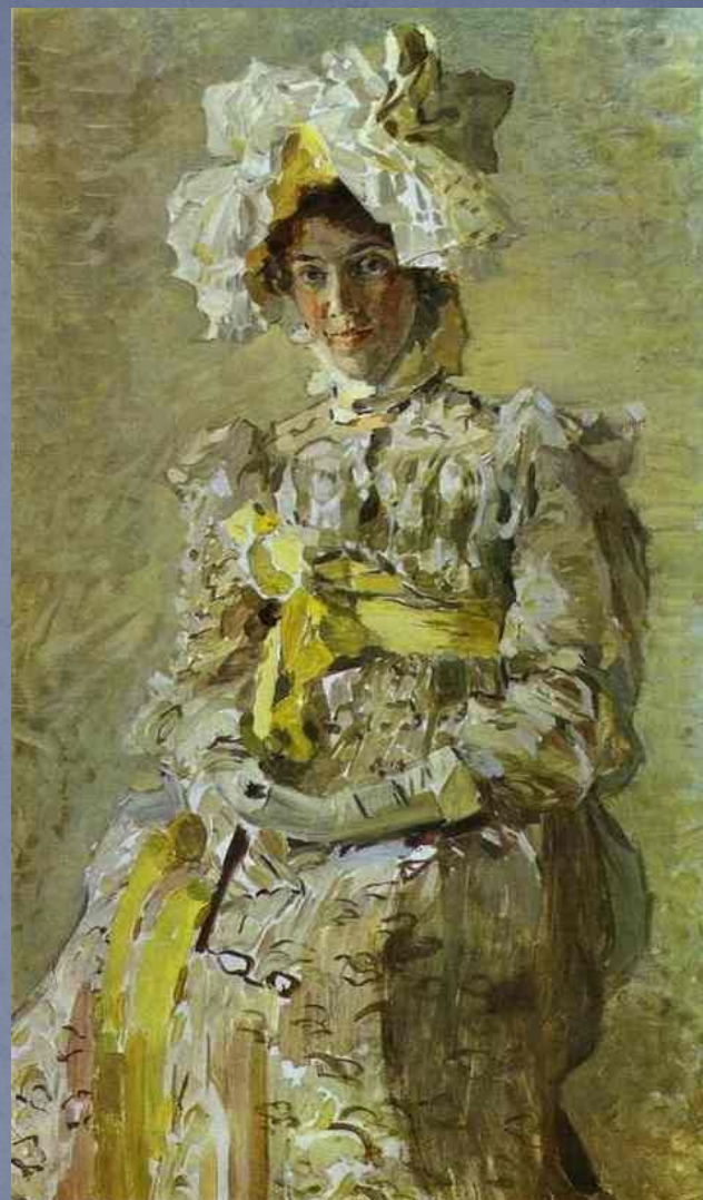
Жена художника, (1898)

• Михаи́л Алекса́ндрович Вру́бель (5 [17] марта 1856, город Омск, Область Сибирских Киргизов, Российская Империя — 1 [14] апреля 1910, Санкт- Петербург) — русский художник рубежа XIX—XX веков, прославивший своё имя практически во всех видах и жанрах изобразительного искусства: живописи, графике, декоративной скульптуре и театральном искусстве. Он был известен как автор живописных полотен, декоративных панно, фресок и книжных иллюстраций.