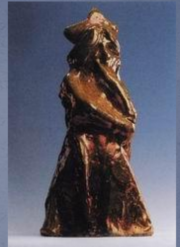
Морская царевна (Волхова), 1899-1900. Майолика

Важную роль в творческих поисках Врубеля сыграл художественный кружок в Абрамцево. Здесь мастер пишет лучшие свои картины, занимается майоликой и декоративным дизайном). Тонкое декоративное чутье Врубеля проявилось также в его сценографических работах для частной оперы С. И. Мамонтова. Тяга художника к монументальному искусству, выходящему за рамки станковой картины, с годами усиливается; мощным выплеском этой тяги явились гигантские панно «Микула Селянинович» и «Принцесса Греза» (1896),