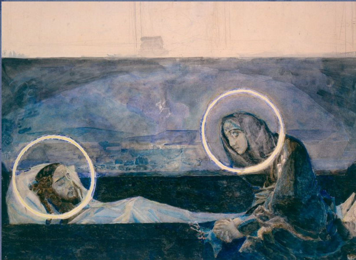
Надгробный плач (эскиз) 1887

Кульминация киевского периода — эскизы росписей Владимирского собора (1887, акварель и графитный карандаш, преимущественно Киевский музей русского искусства); со времен древней иконописи русская живопись не знала цветовых гамм такой силы обобщения и воздействия. Не только вера и озарение, но и мучительные сомнения проступили тут с исповедальной искренностью, — неудивительно, что эскизы смутили официальную церковь и остались неосуществленными в большом масштабе, на стене.