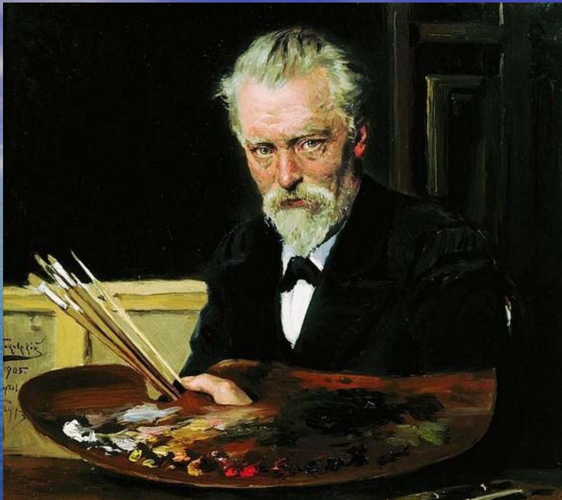
Маковский Владимир Егорович