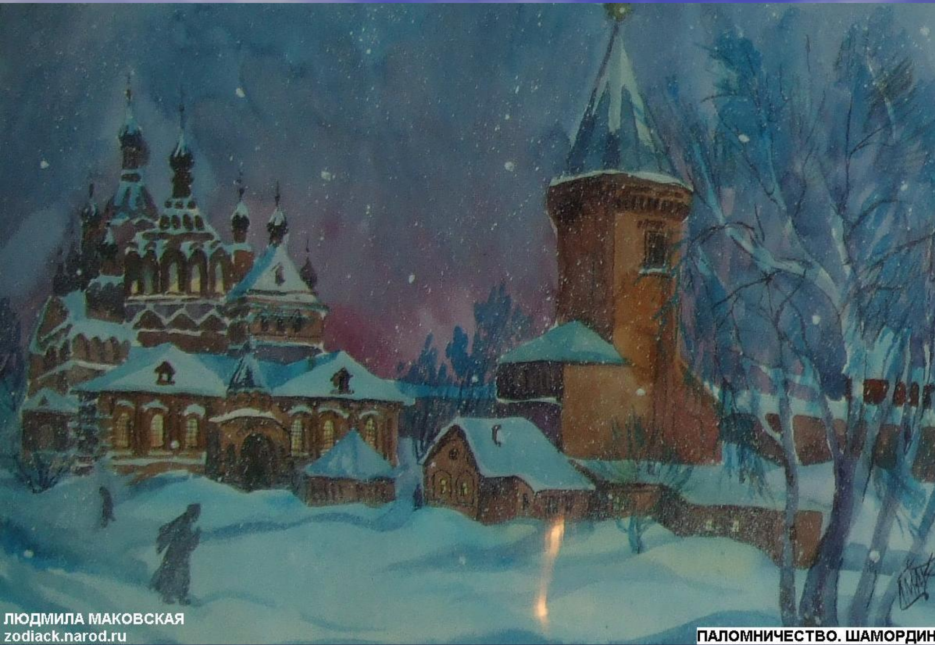
ЛЮДМИЛА МАКОВСКАЯ zodiack.narod.ru