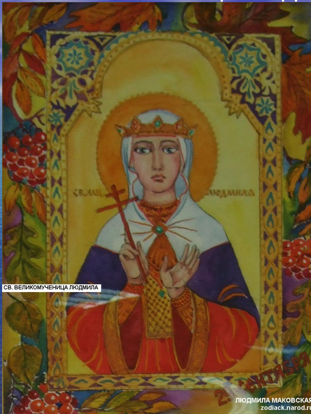
СВ. ВЕЛИКОМУЧЕНИЦА ЛЮДМИЛА