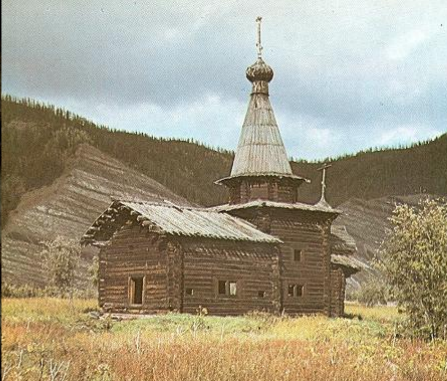
Неизвестная церковь 17 века