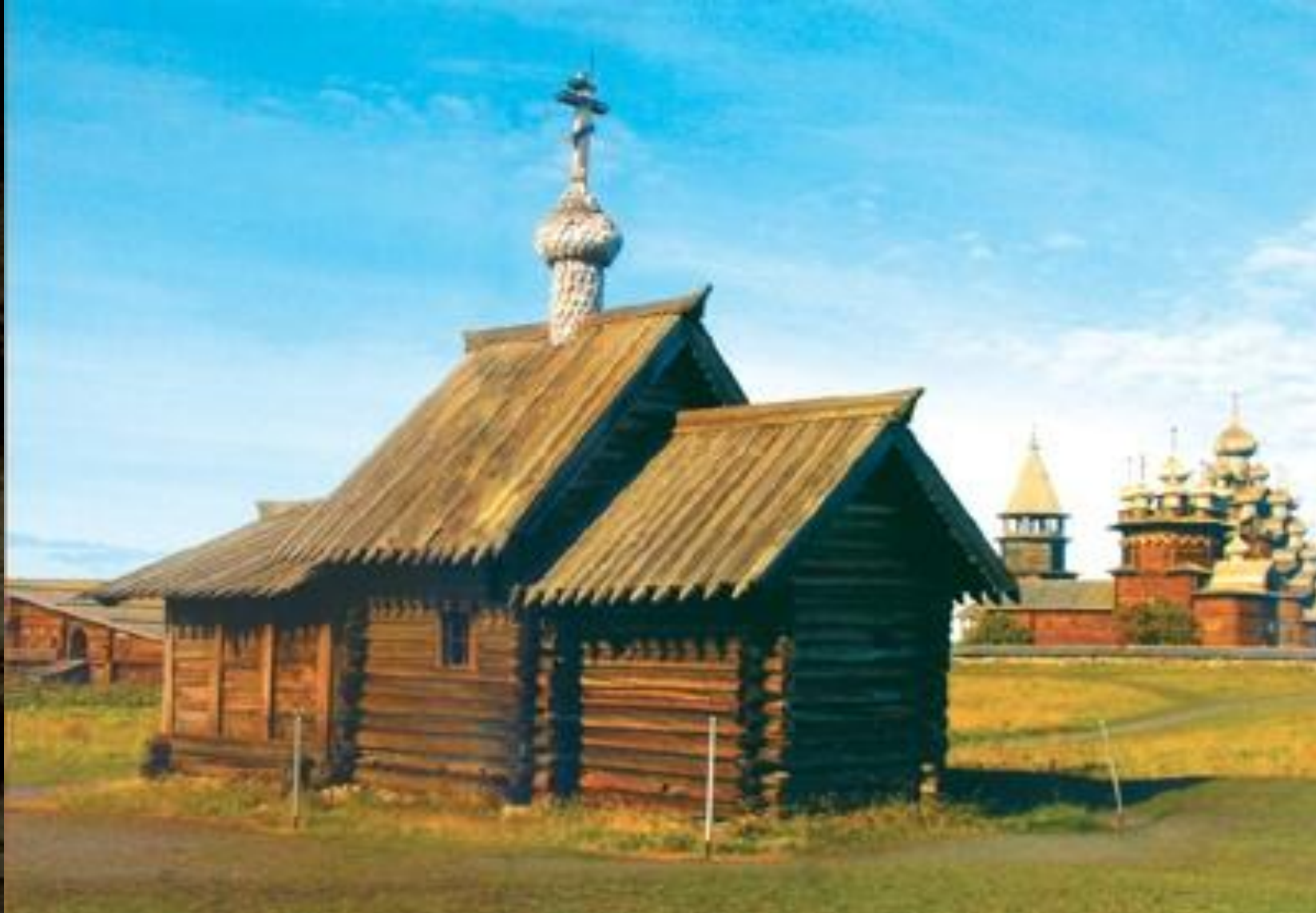
«Воскрешения Св. Лазаря» 14 век. 1391 год.