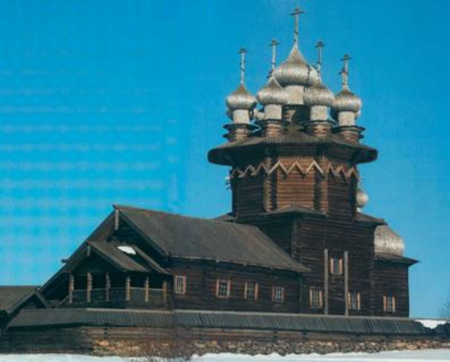
Церковь « Покрова Божией Матери ». 1764 ГОД