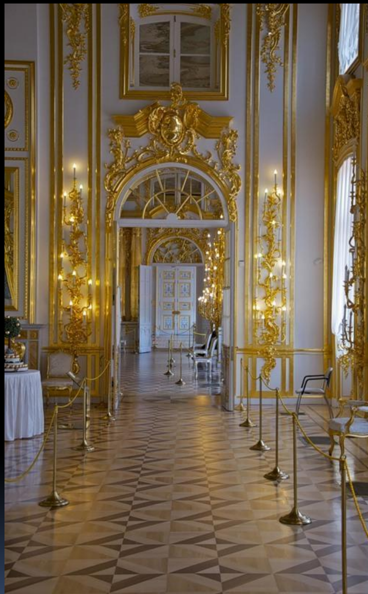
Б.Ф. Растрелли. Анфилада парадных залов Екатерининского дворца.