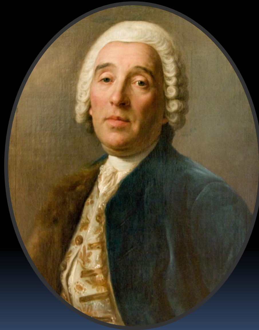
■ Франческо Бартоломео Растрелли

В монархиях, как правило, архитектурные пристрастия определяются вкусами и желаниями властелина. Так при Петре I в архитектуре ценилась основательность и почти пуританская простота, а женщины у власти позволили развиваться барокко пышному, как оборки и рюши их платьев. Наступило время гения ликующего барокко — Бартоломео Растрелли.