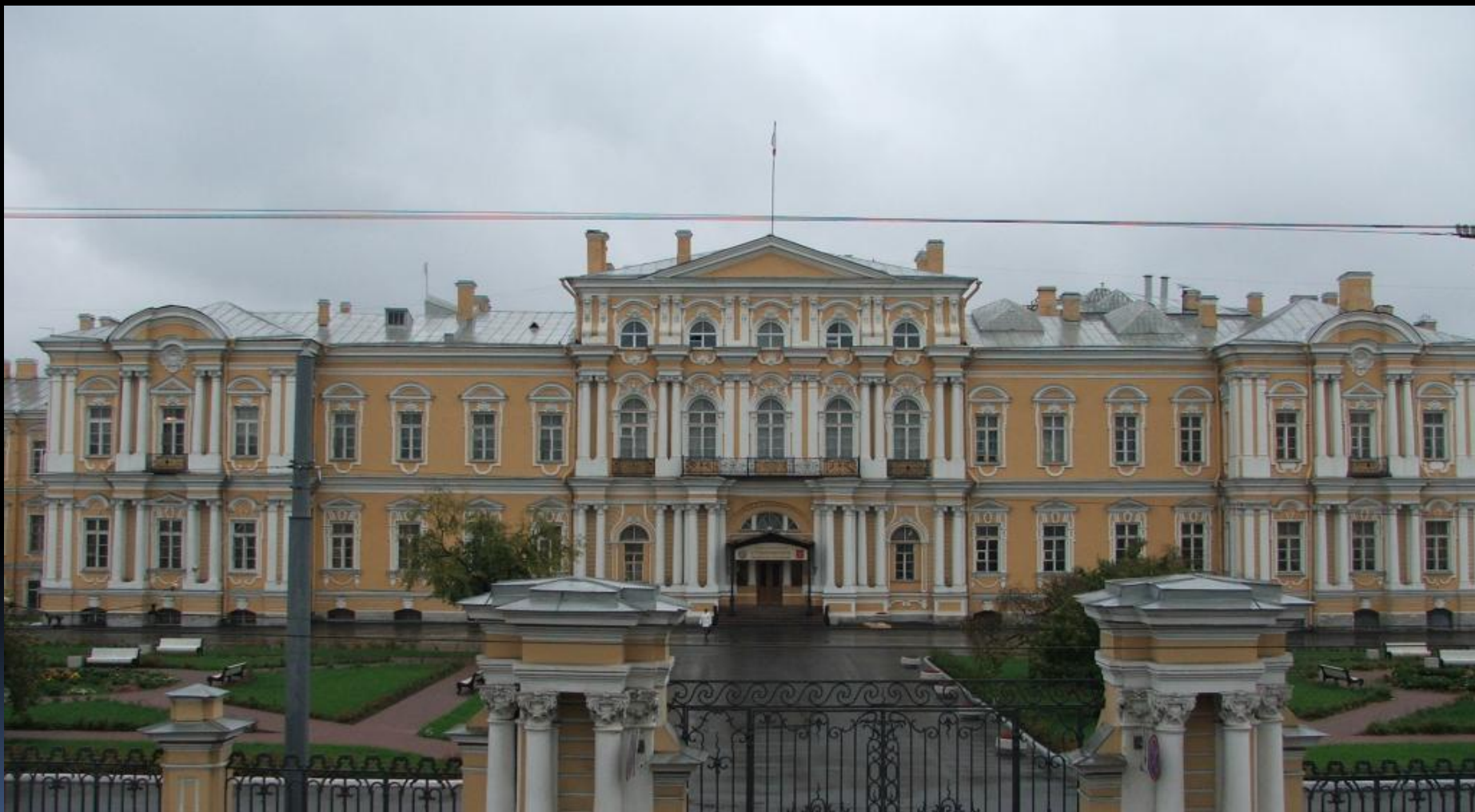
Б. Растрелли. Воронцовский дворец. 1749-1757гг.

В странах католических – барокко пышное, декоративное, торжественное. Бартоломео Растрелли, добавил в него масштабности, монументальности и в то же время жизнерадостности, идущих от теремной традиции раскраски.