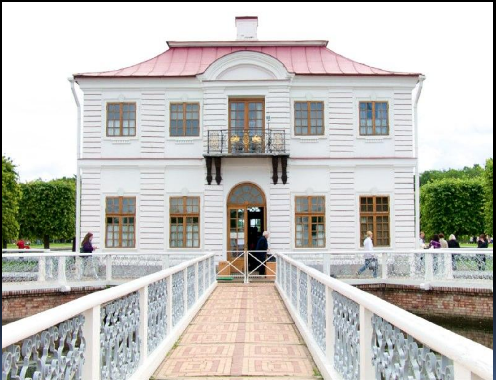
Дворец Марли в Петергофе