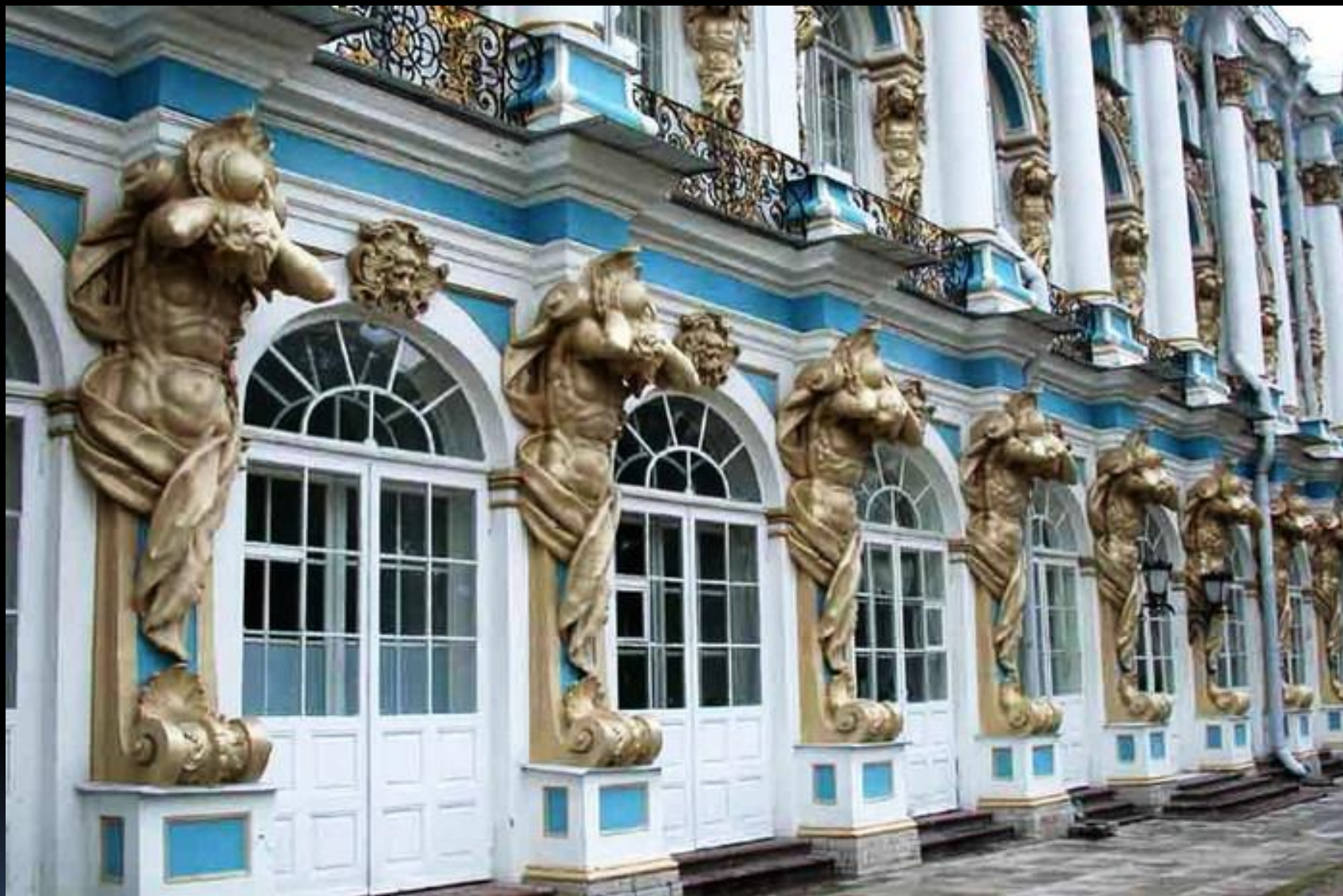
Б.Ф.Растрелли. Атланты. Екатерининский дворец.