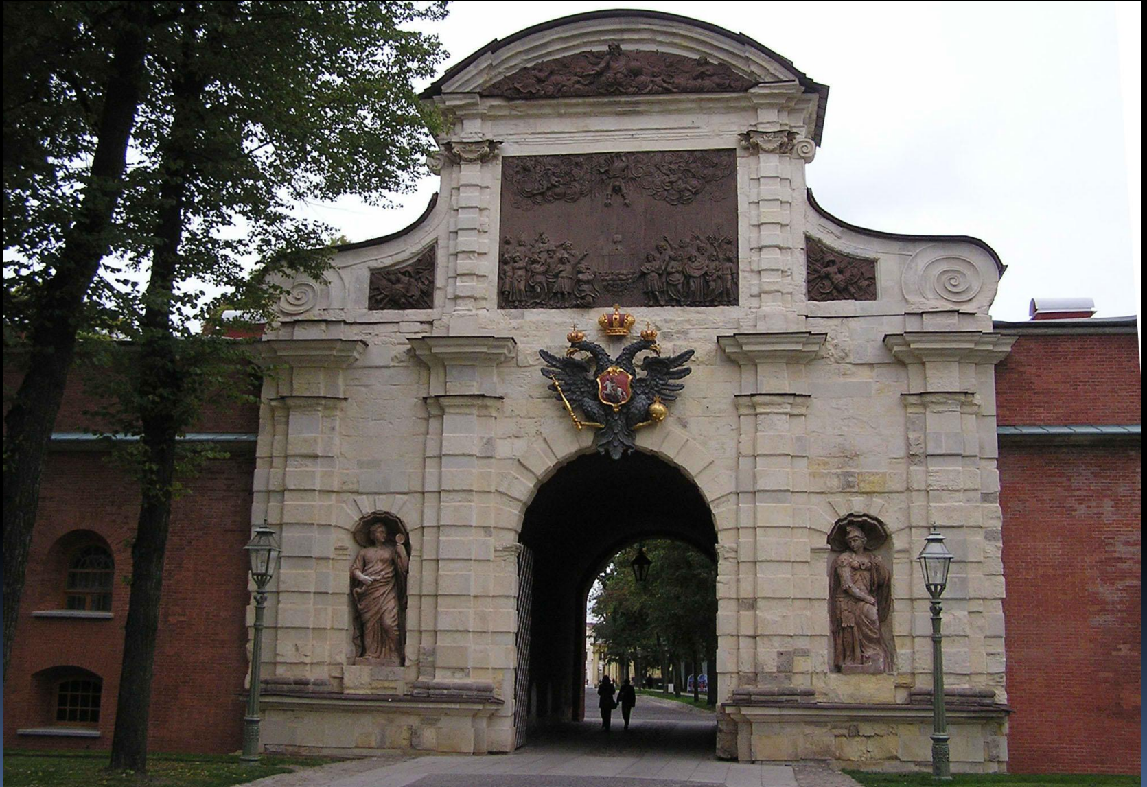
Петровские ворота Петропавловской крепости

Фортификационная и храмовая архитектура отличались простотой и наивным изяществом (колокольня Петропавловского собора, церковь св. Пантелеймона, Петровские ворота Петропавловской крепости и др.).