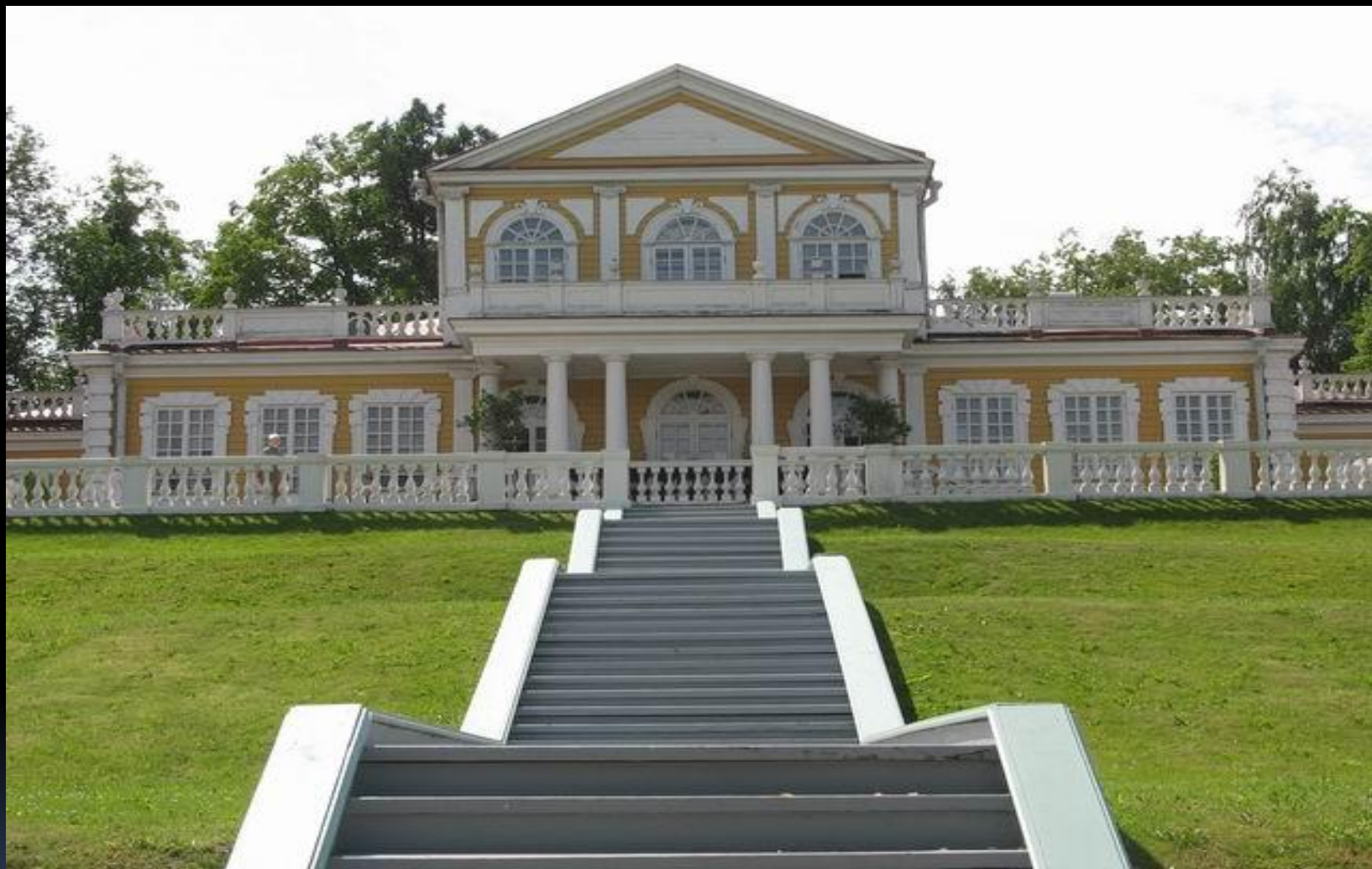
Стрельна, Путевой дворец Петра I