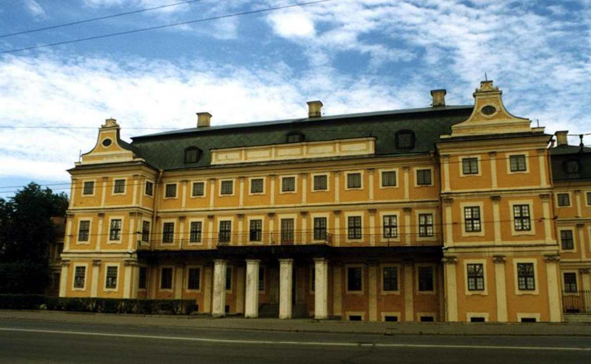
Васильевский остров, Меншиковский дворец