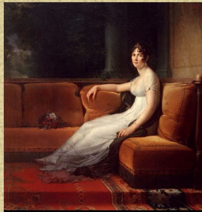
Франсуа Жеррар «Портрет Жозефины» (портрет в интерьере)