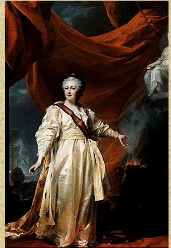
Левицкий Д.Г. «Портрет Екатерины II (портрет в рост)