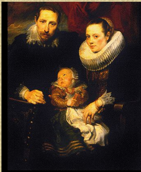
А. ван Дейк «Семейный портрет» 1621г (групповой портрет)