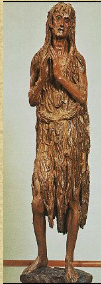
Донателло «Мария Магдалина» Бронза 1455 (бюст в скульптуре)