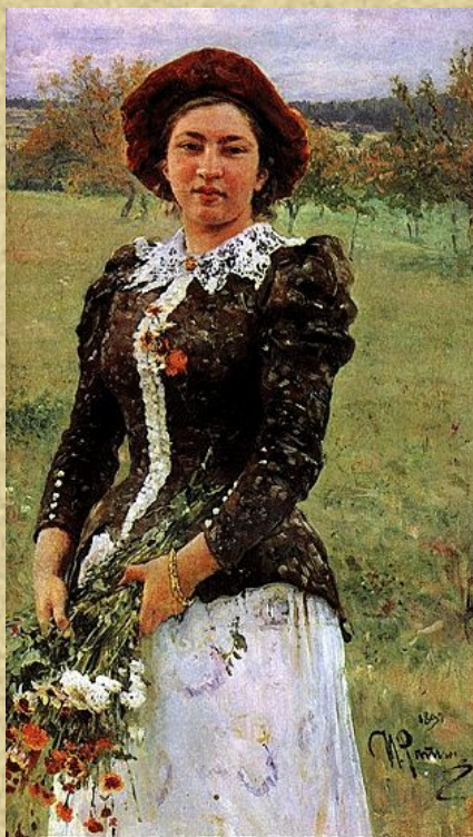
Репин «Осенний букет» (портрет на фоне пейзажа)