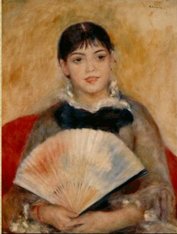
Ренуар «Девушка с веером» 1881 (поясной портрет)