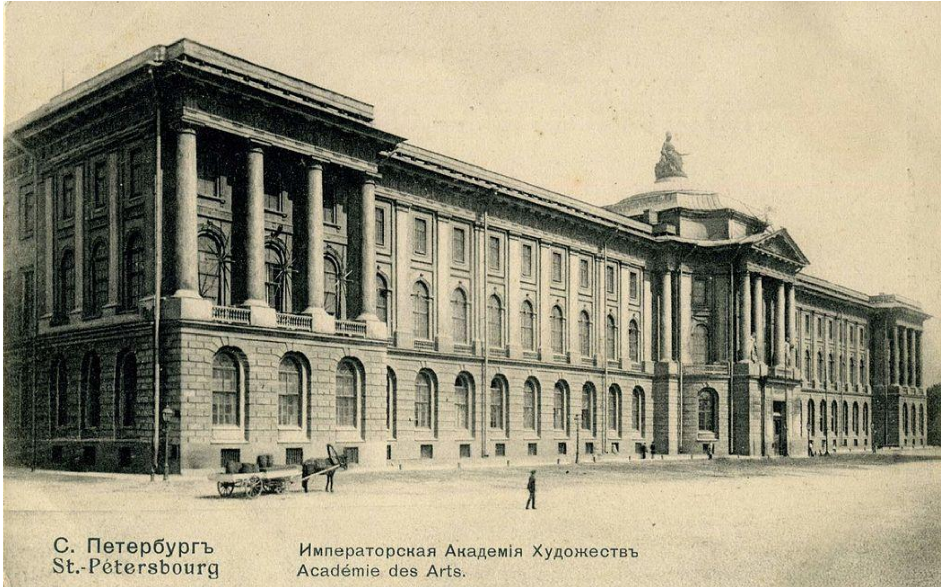
С. Петербургъ St.-Petersbourg