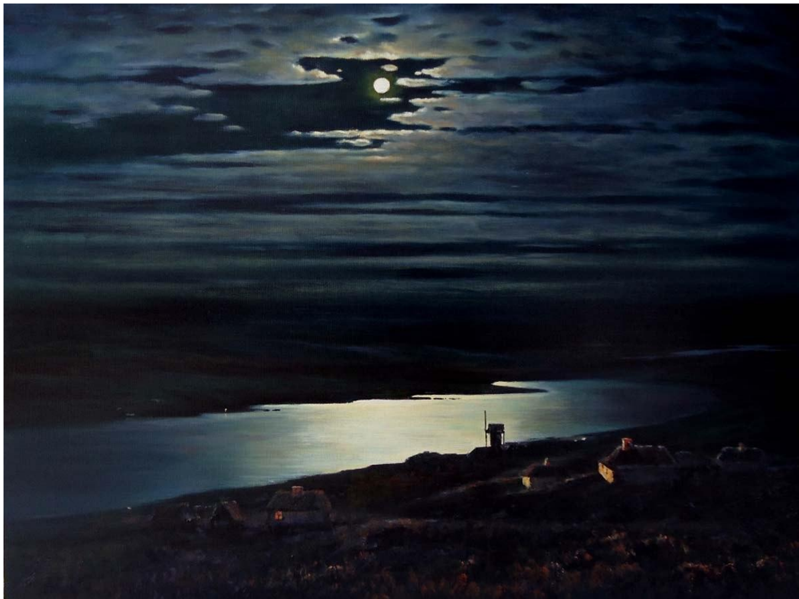
Архип Иванович Куинджи «Лунная ночь на Днепре», 1880 г. Государственный Русский музей, Санкт-Петербург.