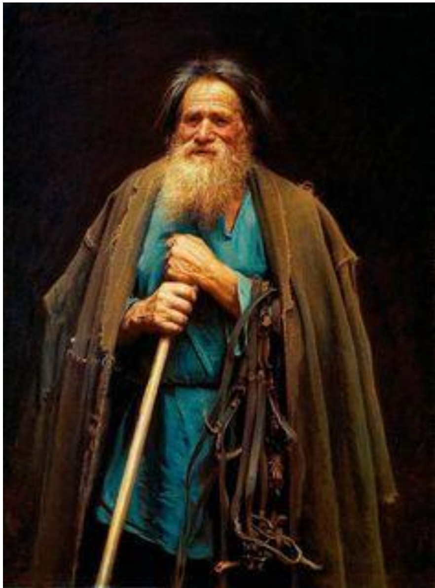
Крамской Иван Николаевич. Мина Моисеев. 1882 г. музей русского искусства, Киев.