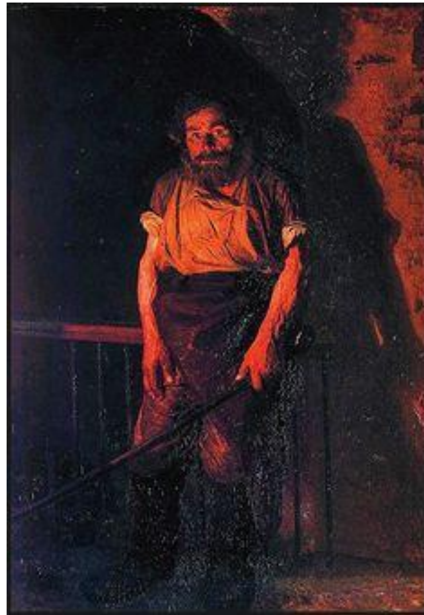
Николай Александрович. Ярошенко. Кочегар. 1878