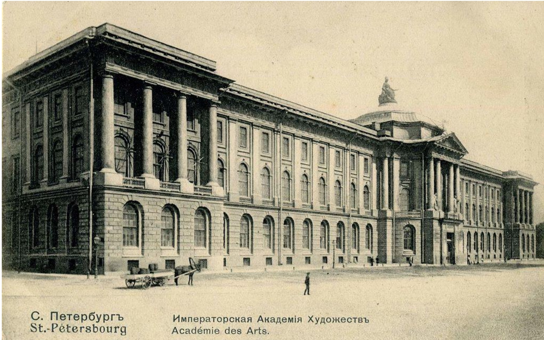
С. Петербургъ St.-Petersbourg