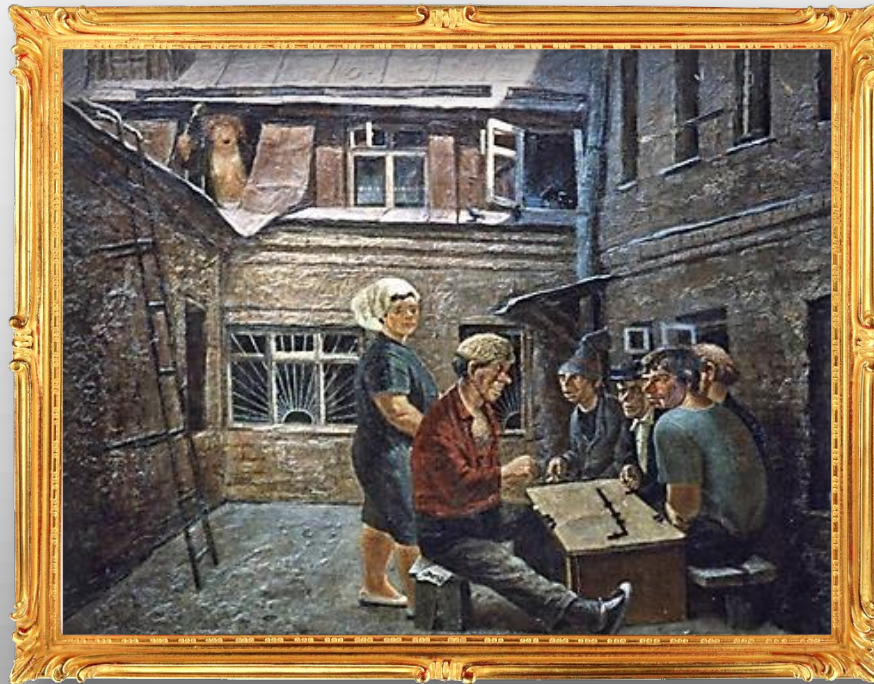
Домино. 1984 г.

В о времена СССР мужики часто часами просиживали во дворе, играя в домино, карты и другие бессмысленные игры, не обращая внимания на свою семью и домашнее хозяйство.