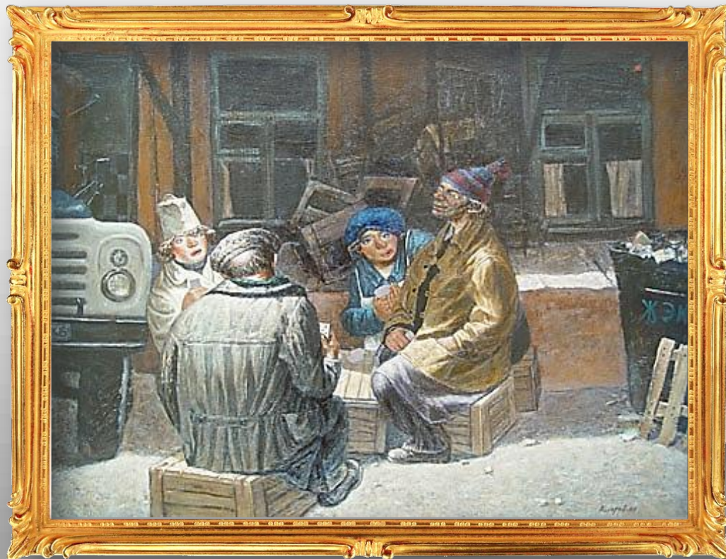
Крестикозыри. 1987 г.

И гра в карты каких-то грузчиков и продавщиц на заднем дворе магазина. На мусорном баке кривыми буквами выведено «ЖЭК».