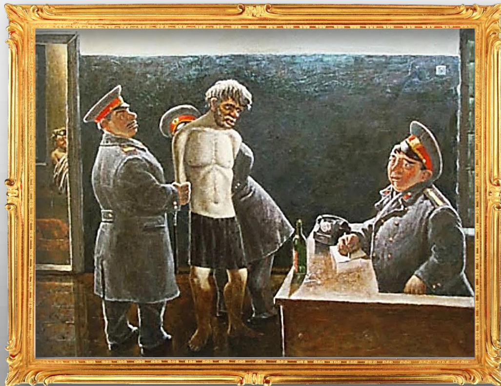
Арест пропагандиста. Медвытрезвитель. 1979 г.

Достаточно правдоподобно изображена жизнь советского вытрезвителя. Пленного алкоголика уже раздели и готовят, судя по всему, к ночёвке в общей камере.