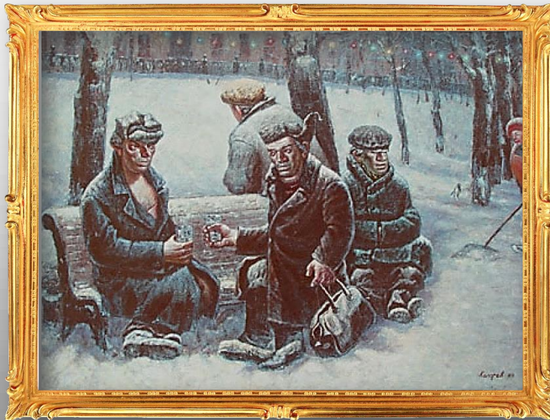
Бульварная сцена - 1. 1984 г.

Изображены дядьки, пьющие горькую прямо где-то на заснеженном бульваре. На заднем плане видна дворничиха, убирающая снег.