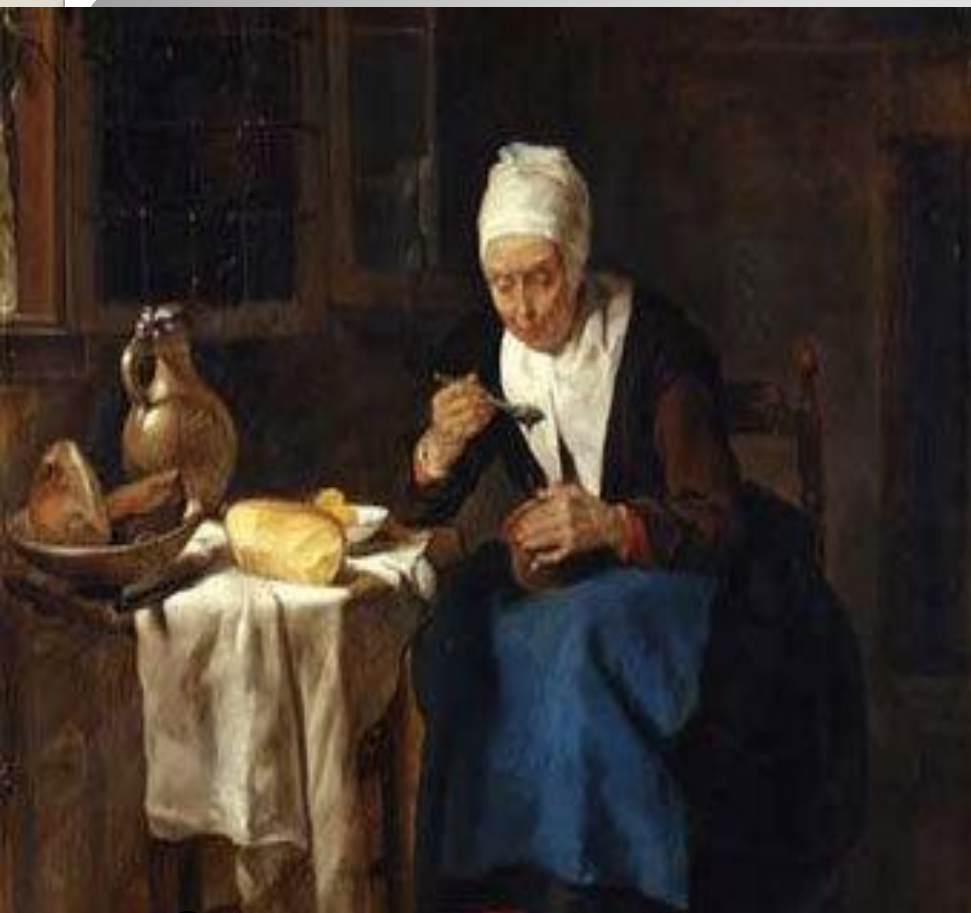
Старуха за завтраком