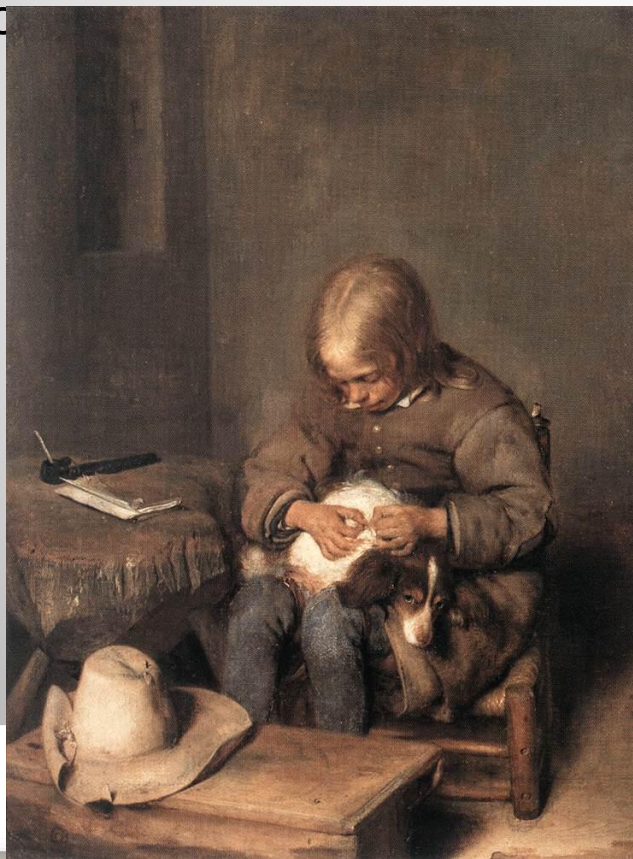
Мальчик с собакой

(нидерл. Gerard ter Borch; конец декабря 1617, Зволле — 8 декабря 1681, Девентер) — нидерландский живописец