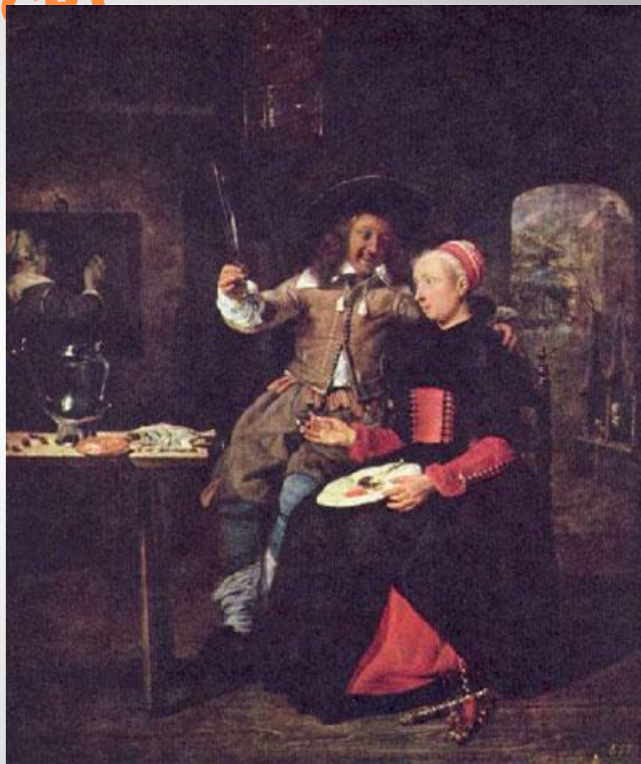
Завтрак с любимой

Габриель Метсю ( нидерл. Gabriel Metsu ; январь 1629, Лейден — (похоронен) 24 октября 1667, Амстердам ) — голландский художник, мастер жанровой, портретной и исторической живописи.