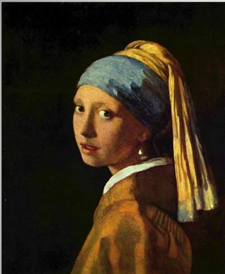
Девушка с жемчужной серёжкой.