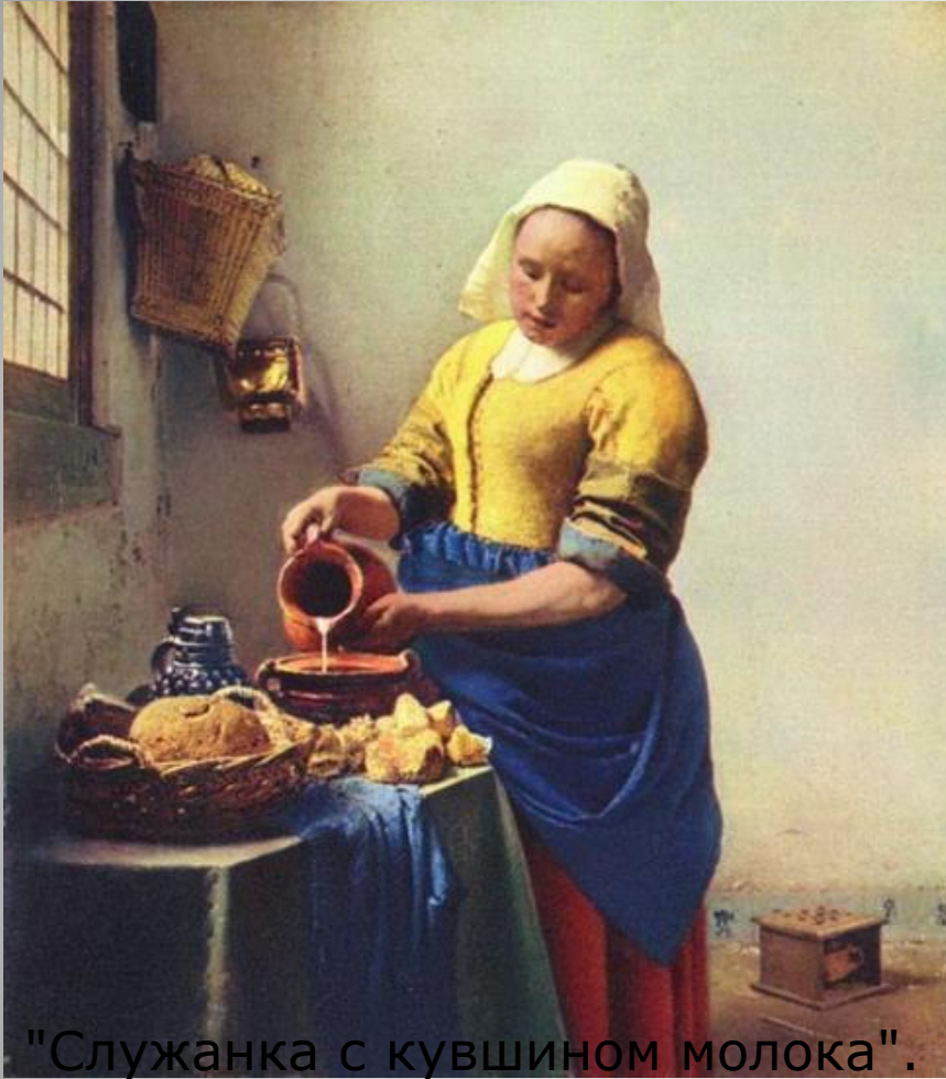
"Служанка с кувшином молока".