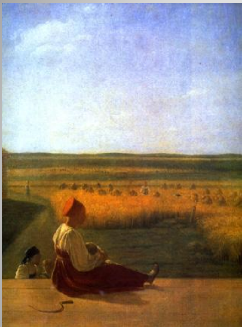
На жатве. Лето.