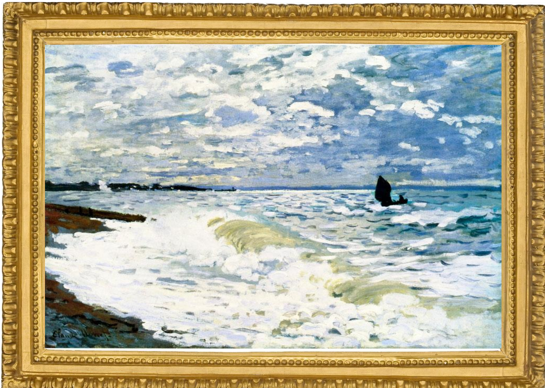
«Море в Сент-