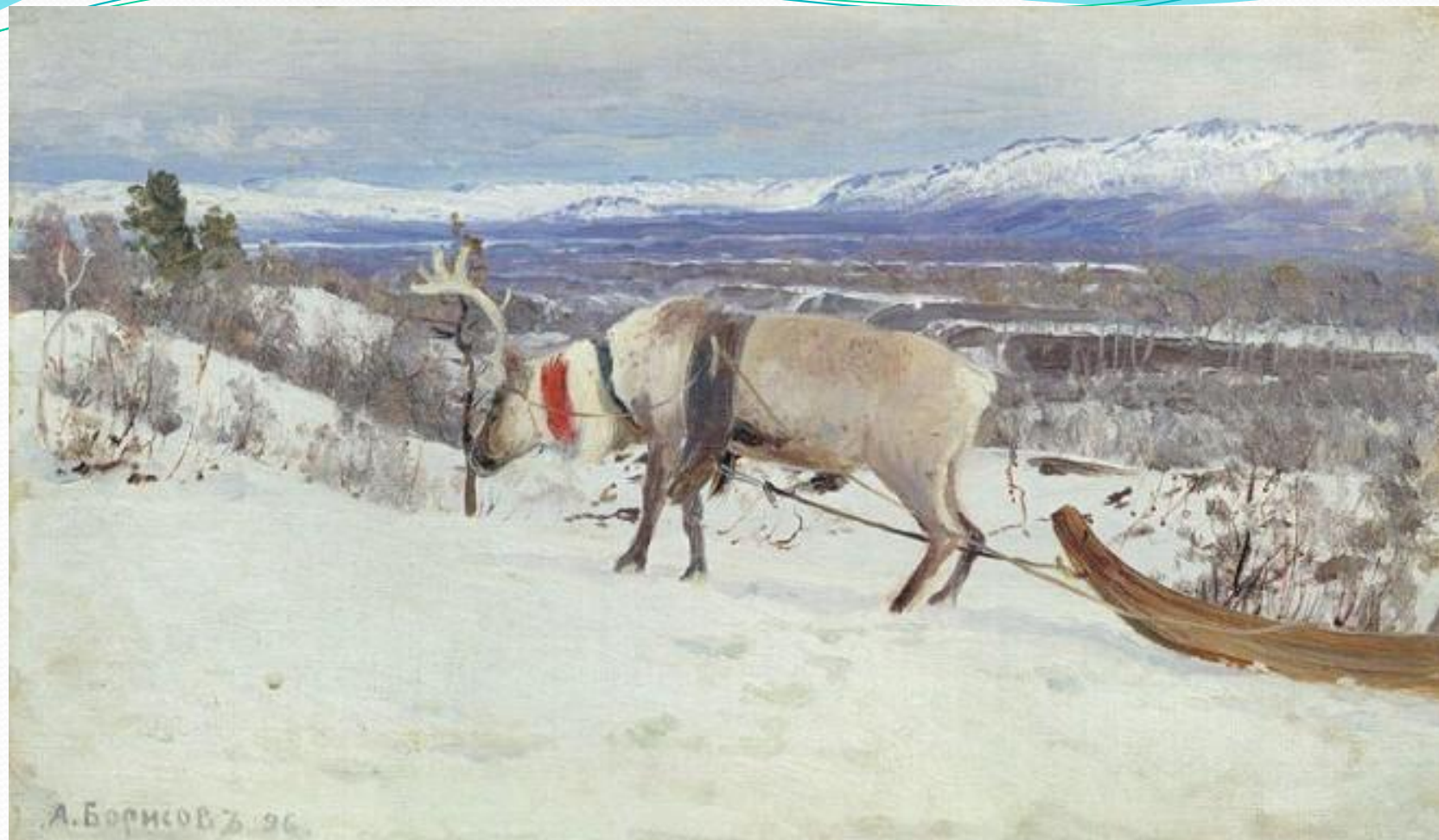
АЛЕКСАНДР БОРИСОВ НА МУРМАНЕ БЛИЗ ГАВАНИ. 1896, ХОЛСТ, КАРТОН, МАСЛО, 25 × 41,7. ГТГ