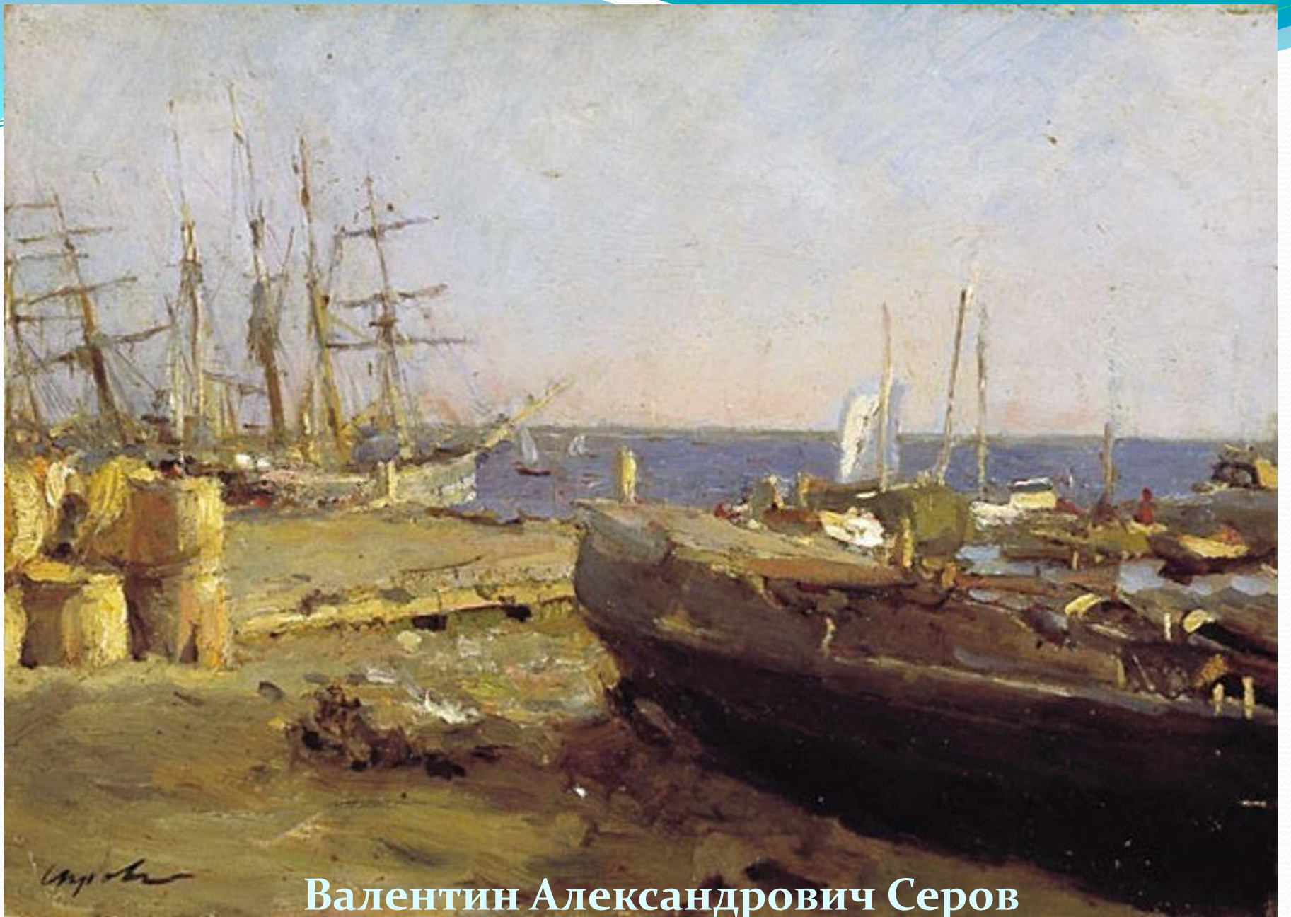
Валентин Александрович Серов Рыболовецкие суда в Архангельске