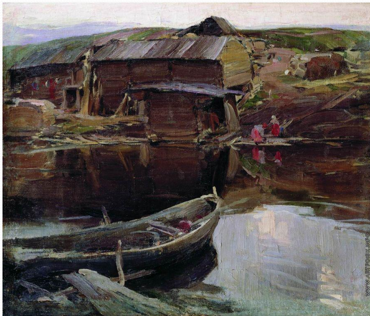
АБРАМ АРХИПОВ. СЕВЕРНАЯ ДЕРЕВНЯ. 1903. ХОЛСТ, МАСЛО. 83 × 68. ГТГ

«Суров и неприветлив Север, но меня к нему тянет. Поеду опять к Ледовитому океану, к бо́льшим и смелым людям»