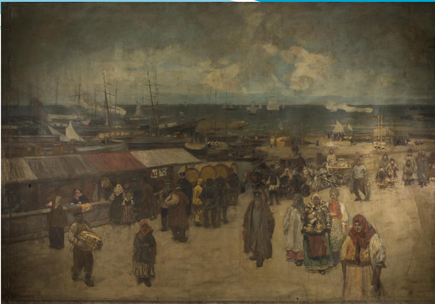
КОНСТАНТИН КОРОВИН БАЗАР У ПРИСТАНИ В АРХАНГЕЛЬСКЕ. ПАННО ДЛЯ ПАВИЛЬОНА НА КРАЙНЕГО СЕВЕРА НА ВСЕРОССИЙСКОЙ ПРОМЫШЛЕННОЙ ХУДОЖЕСТВЕННОЙ ВЫСТАВКЕ 1896 ГОДА В НИЖНЕМ НОВГОРОДЕ. ХОЛСТ, МАСЛО. 260 × 376. ГТГ