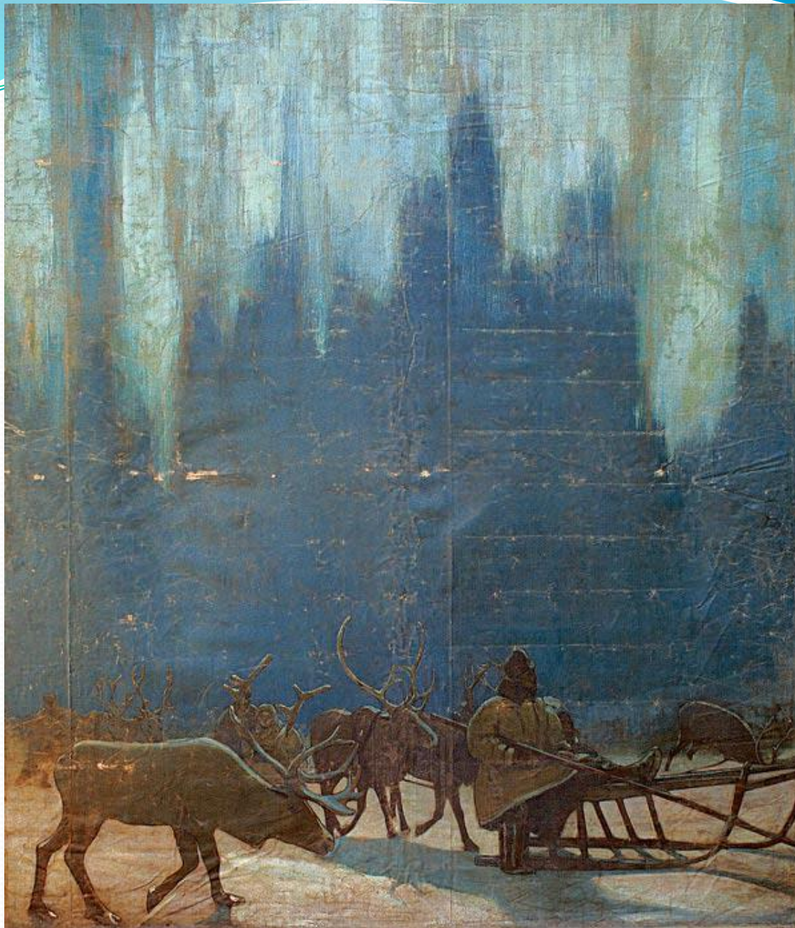
КОНСТАНТИН КОРОВИН. СЕВЕРНОЕ СИЯНИЕ. ПАННО ДЛЯ ПАВИЛЬОНА КРАЙНЕГО СЕВЕРА НА ВСЕРОССИЙСКОЙ ПРОМЫШЛЕННОЙ ХУДОЖЕСТВЕННОЙ ВЫСТАВКЕ 1896 ГОДА В НИЖНЕМ НОВГОРОДЕ . ХОЛСТ, МАСЛО. 425 × 350. ГТГ