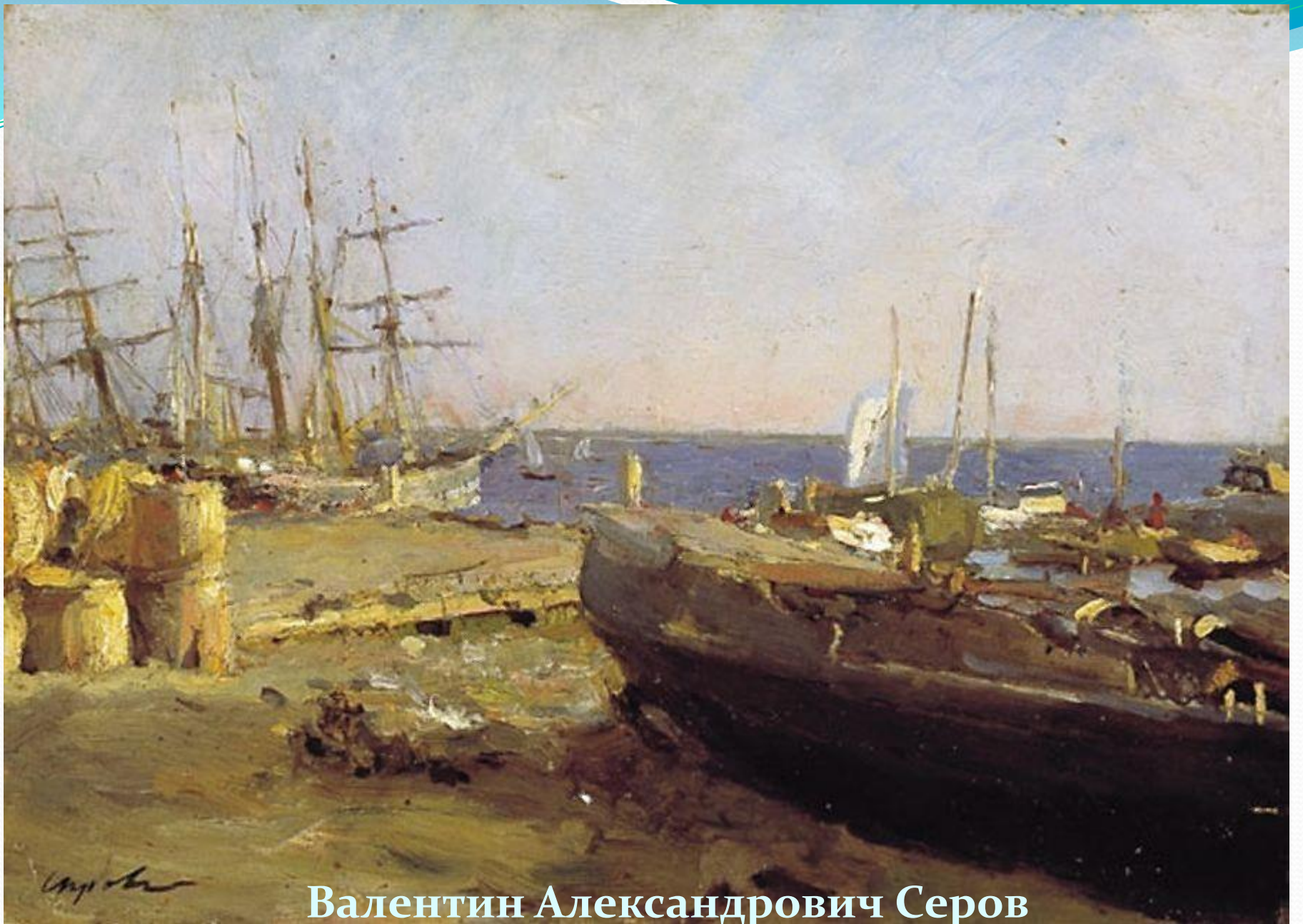
Валентин Александрович Серов Рыболовецкие суда в Архангельске